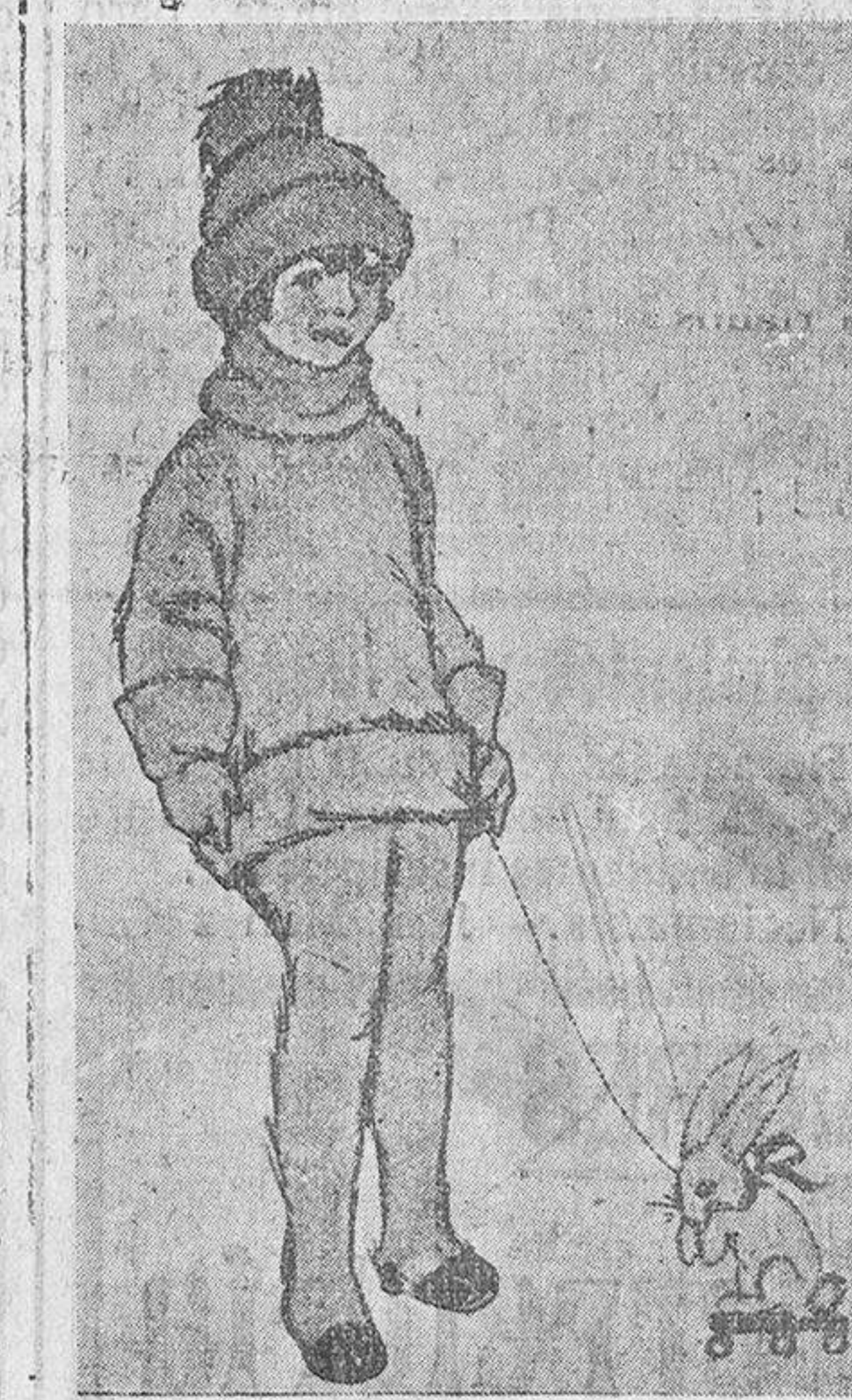
Grabado núm. 6.

El rey había tenido ya otra esposa y de ella le quedaban siete niños, seis de ellos varones y una hembra, a la cual amaba sobre todo lo de la tierra. Temió que la madrastra no los tratara bien o les hiciera algún daño, los llevó a un castillo solitario, escondido en medio de un bosque. Tan escondido estaba y era tan difícil de hallar el camino que ni él mismo lo hubiera encontrado si una hechicera no le hubiera dado un ovillo de hilo de maravillosa virtud: al lanzarlo lejos de sí, se enmara-