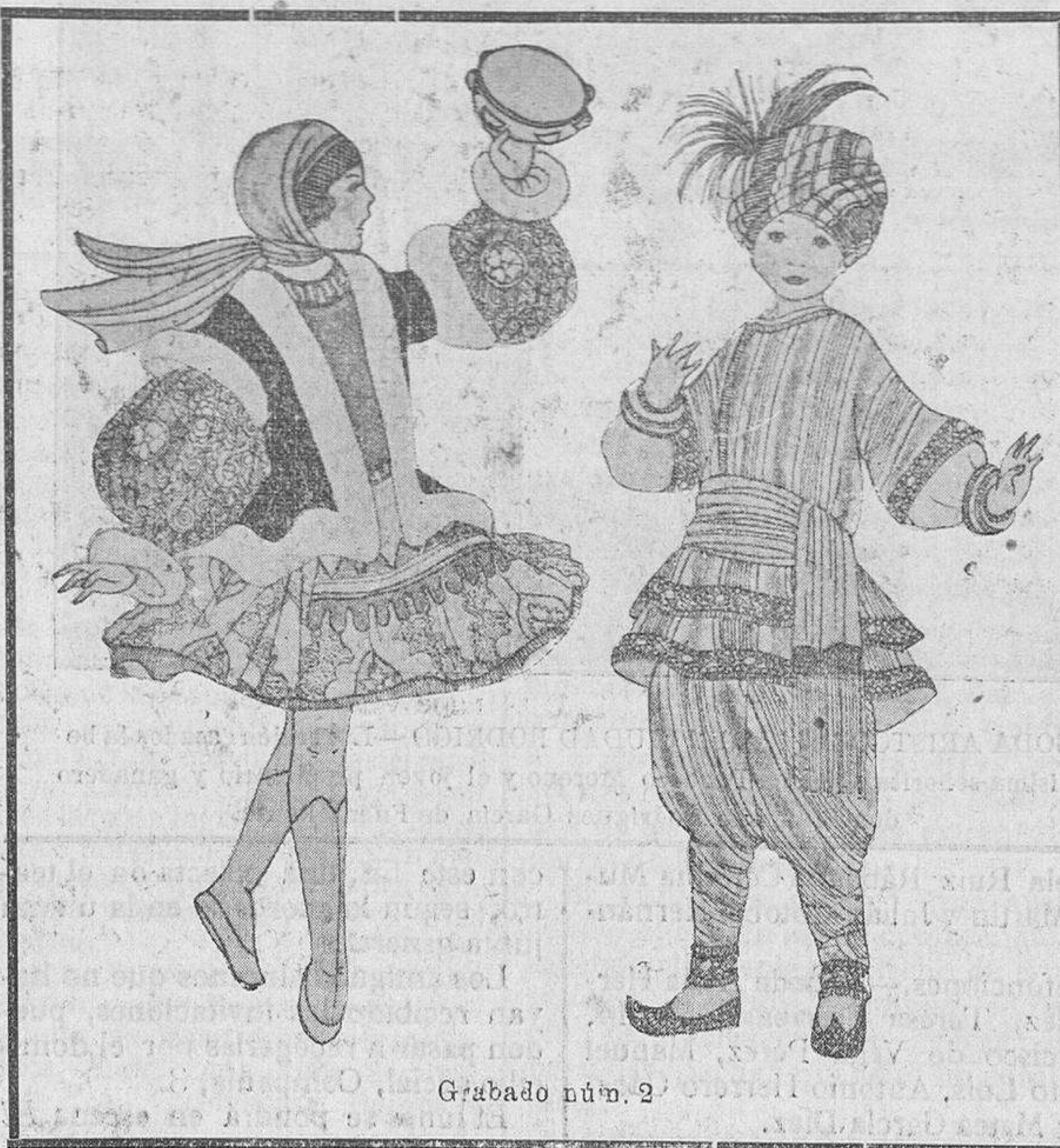
Grabado núm. 2.

—Voy a cumplir mi promesa antes de abandonarte para siempre. Voy al jardín; fíjate bien en qué árbol me poso. Cava un rato junto a su pie, hacia donde nace el sol, y encontrarás un jarra llena de monedas de oro. Son tuyas. Y descubí