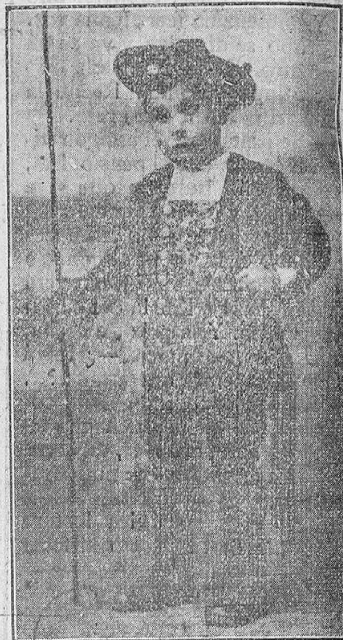
Grabado núm. 3.

reconoció a sus hermanos; con gran alegría salió de debajo de la cama y sus hermanos no estuvieron menos contentos que ella al ver a su hermanita; pero su alegría duró muy poco.