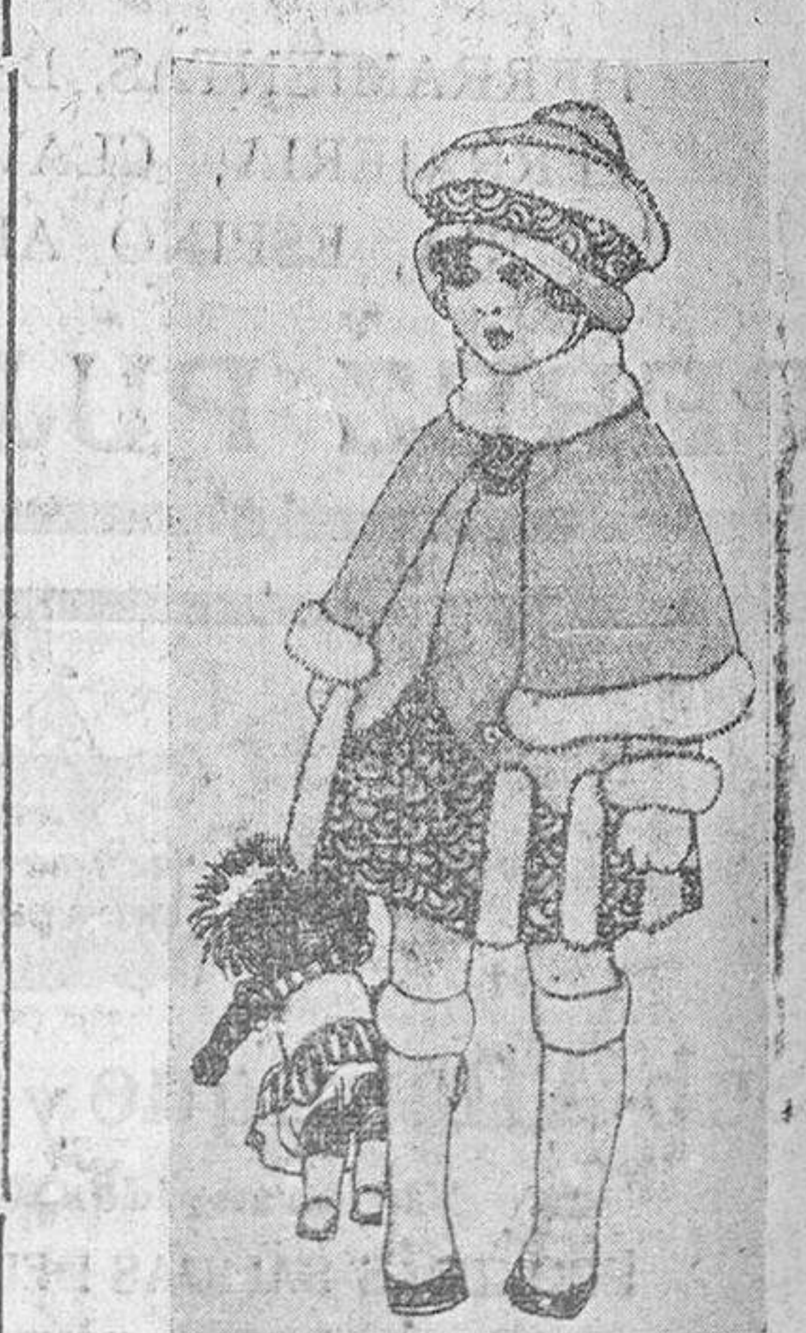
Grabado núm. 7.

Su hermanita les dijo, llorando: —¿Y no podéis ser librados de este encantamiento?