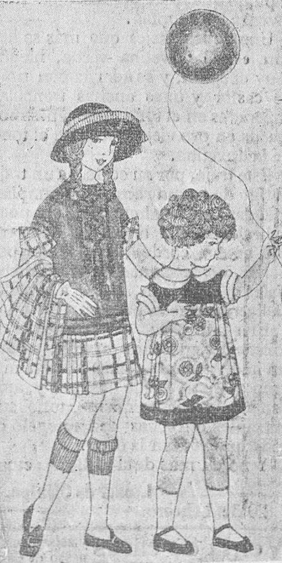
Grabado núm. 4.