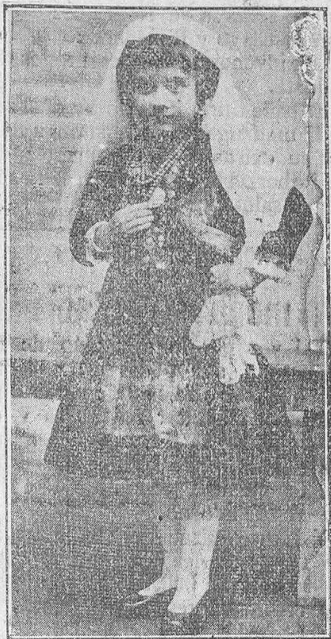
Grabado núm. 1.

Y aunque esto de los «niños prodigios» va estando un poco descreditado, pues como recientemente dijimos en EL ADELANTO, la experiencia ha demostrado que casi todos ellos no llegan a cogúlmolo, —tal le ocurrió al niño Pico nill, que prematuramente bajó al sepulcro— y los que medran en edad, de mayor-