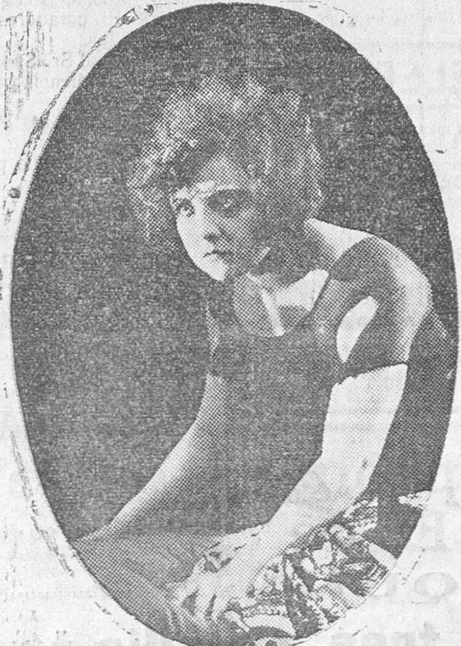
LUCY DOBAYNE Famosa artista Húngara.