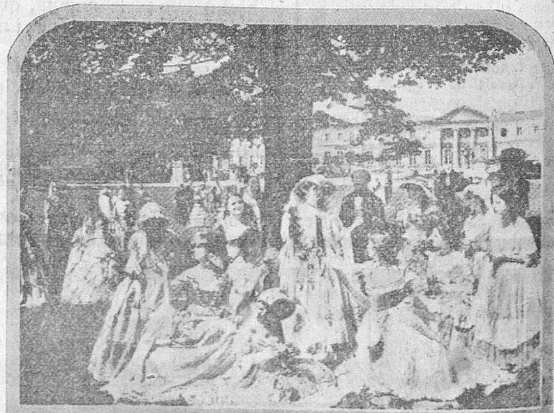
La Emperatriz Eugenia, aparece en este cuadro de «Violetas Imperiales», en los jardines suntuosos de Compiègne, en una tarde de espléndidas fiestas.