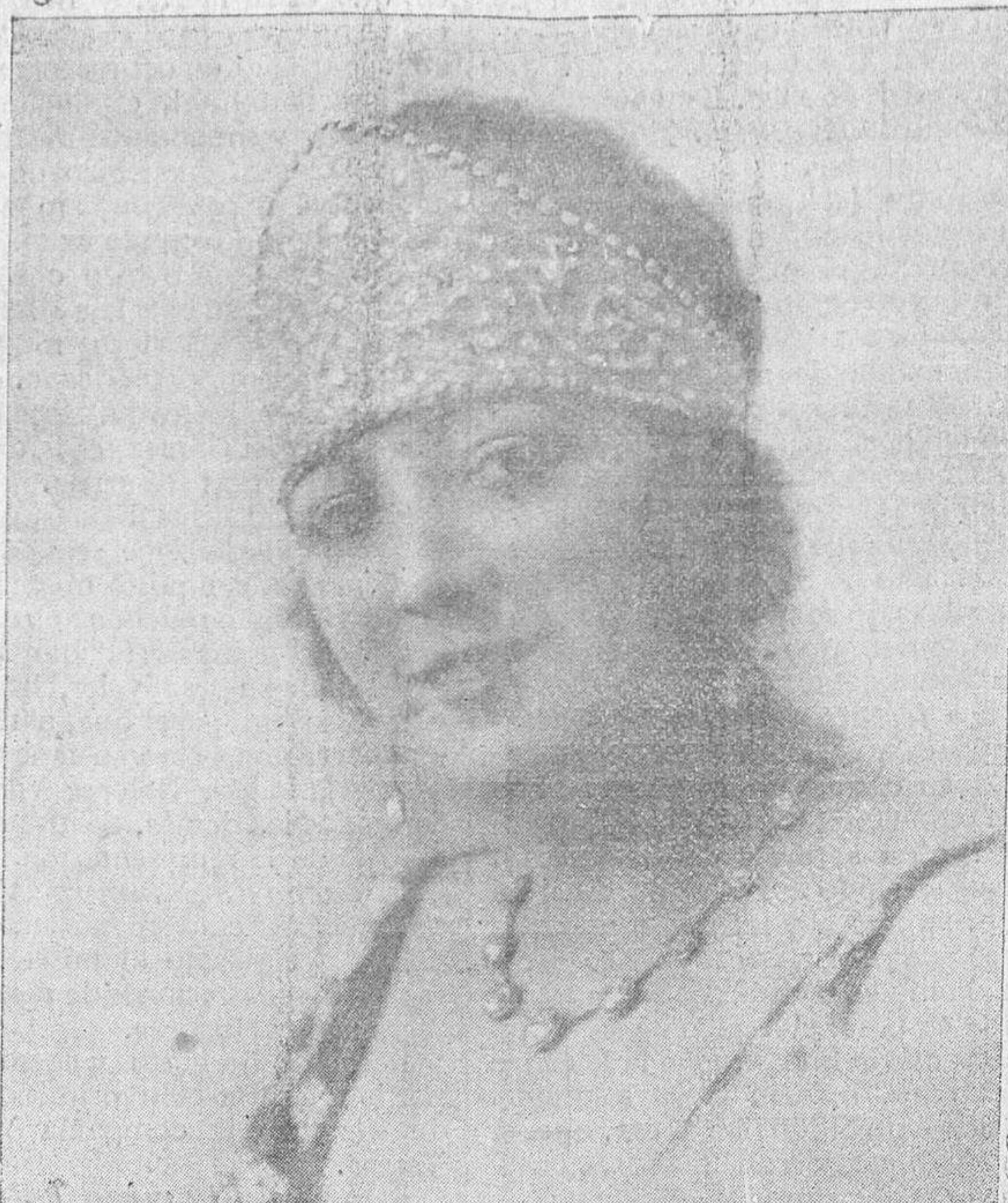
LA PRECIOSILLA bella y notable artista, que en breve debutará en el teatro Bretón.