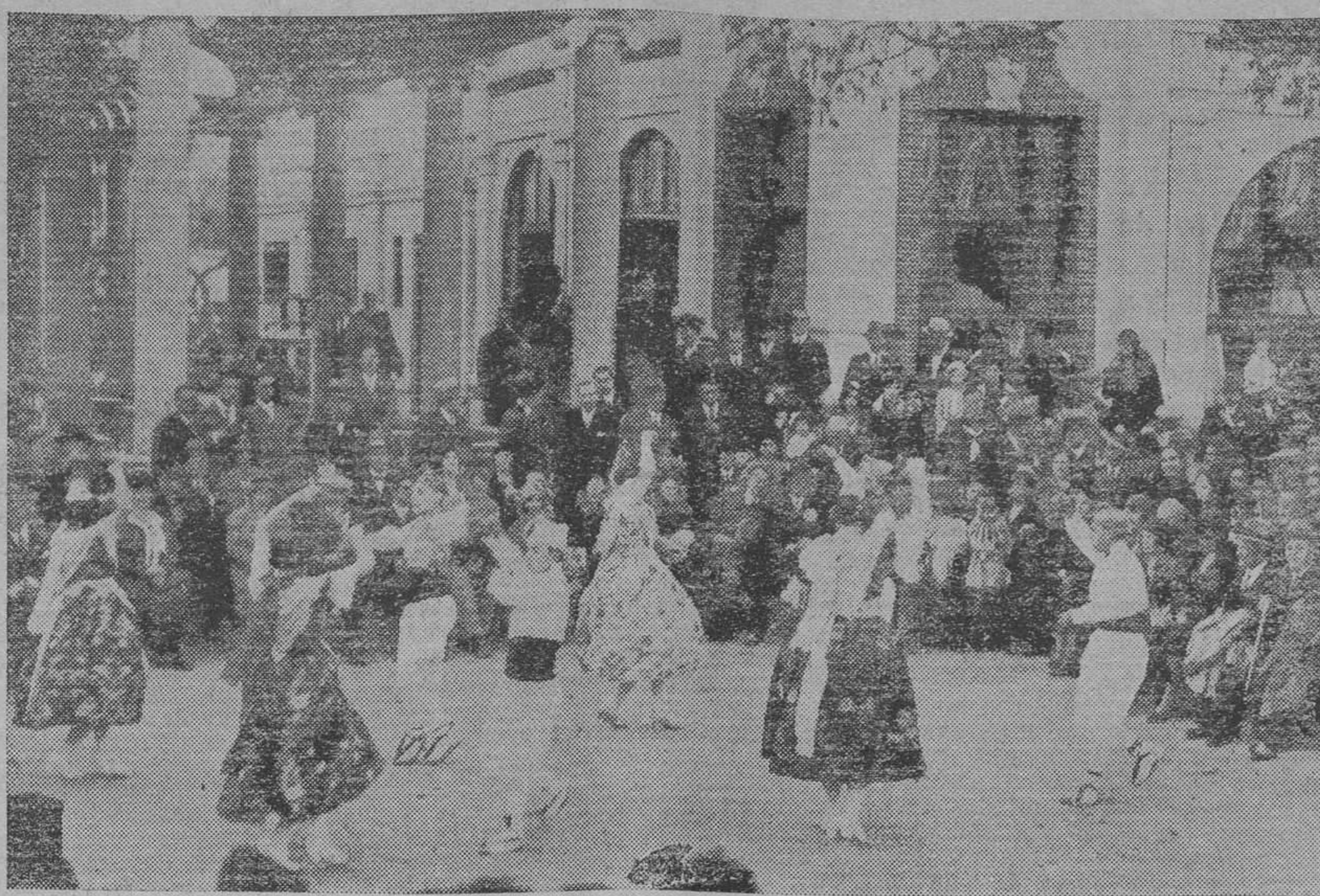
Un festejo en la Casa Ayuntamiento