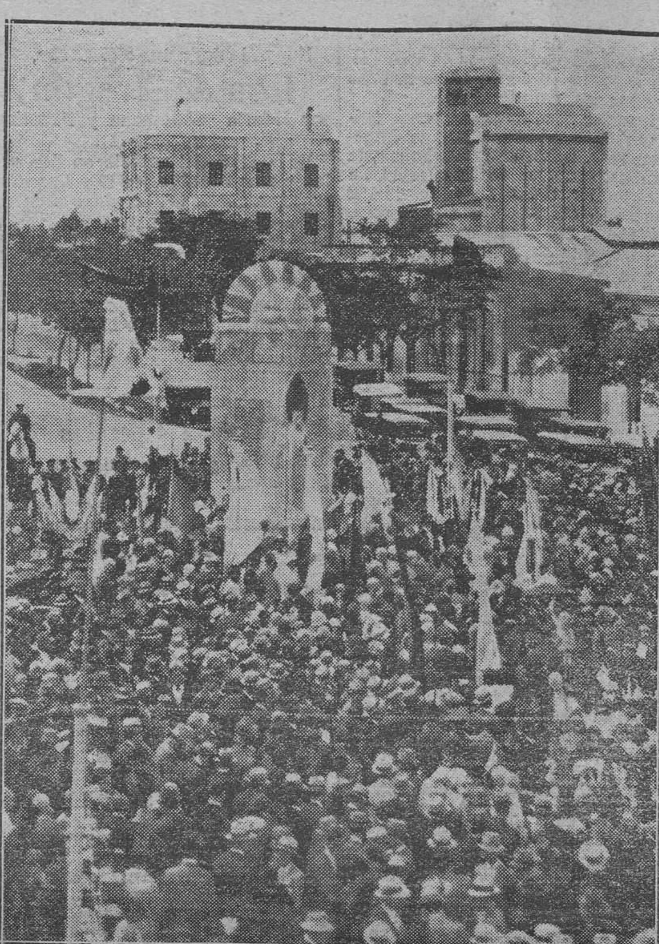
El acto inaugural del monumento

Como saben nuestros lectores, pues de ello nos ocupamos oportunamente, en el concurso abierto en la ciudad de Paysandú (Uruguay), por la colonia española, para erigir un monumento a la independencia del Uruguay, logró la adjudicación de guardar en su memoria aquella manifestación de amor a la Patria.