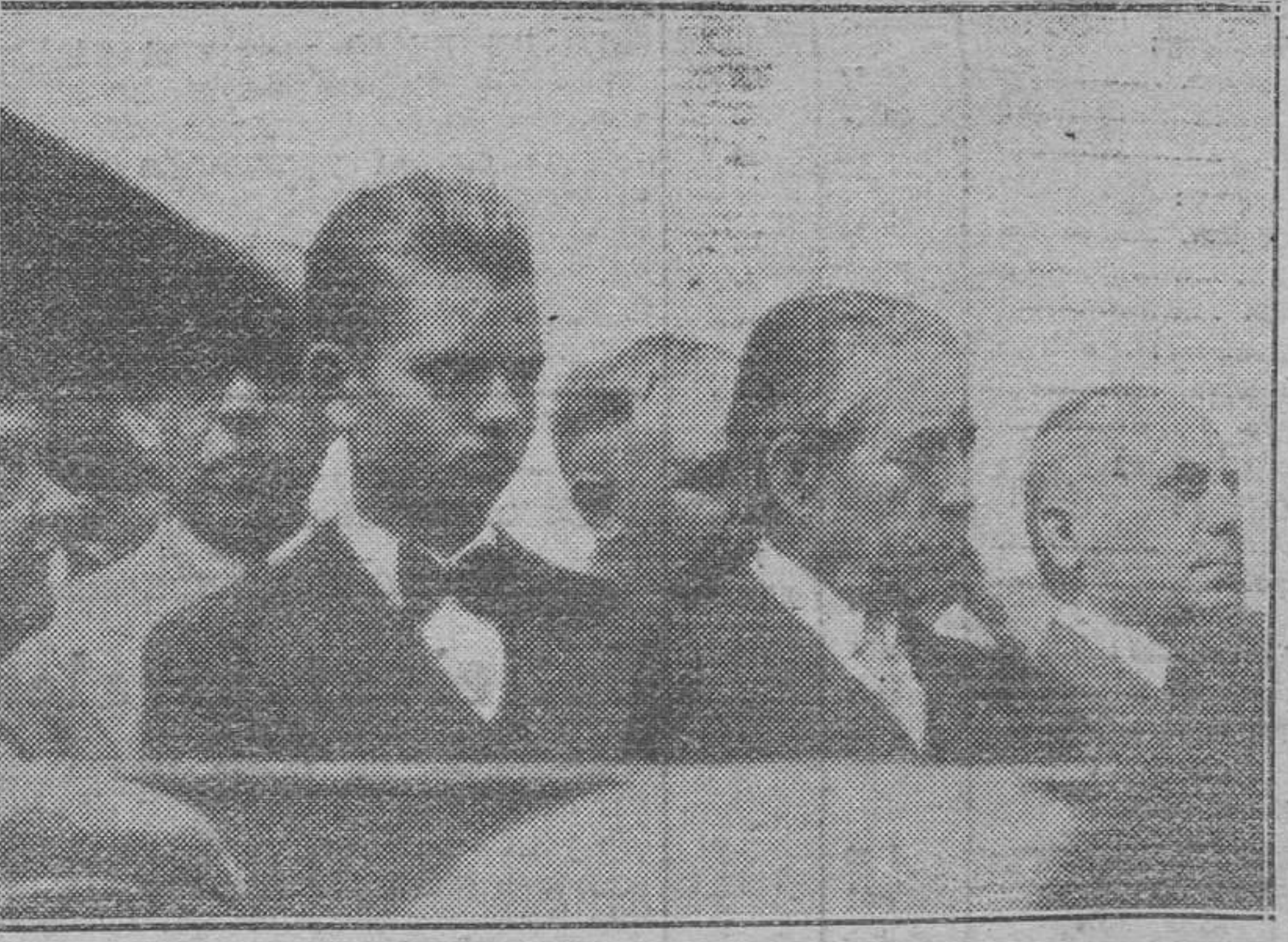
La tribuna presidencial, en la que figura el joven escultor valenciano, entre las autoridades

a la bella ciudad de aquella simpática República. Se le hizo un recibimiento por demás entusiasta, disputándose autoridades y ciudadanos el honor de agasajar al joven escultor, declarándosele huésped oficial, celebrando fiestas en su honor, un baile organizado por los estudiantes y un sin fin de pruebas de singular afecto. Hasta hacerle hablar ante la radio.