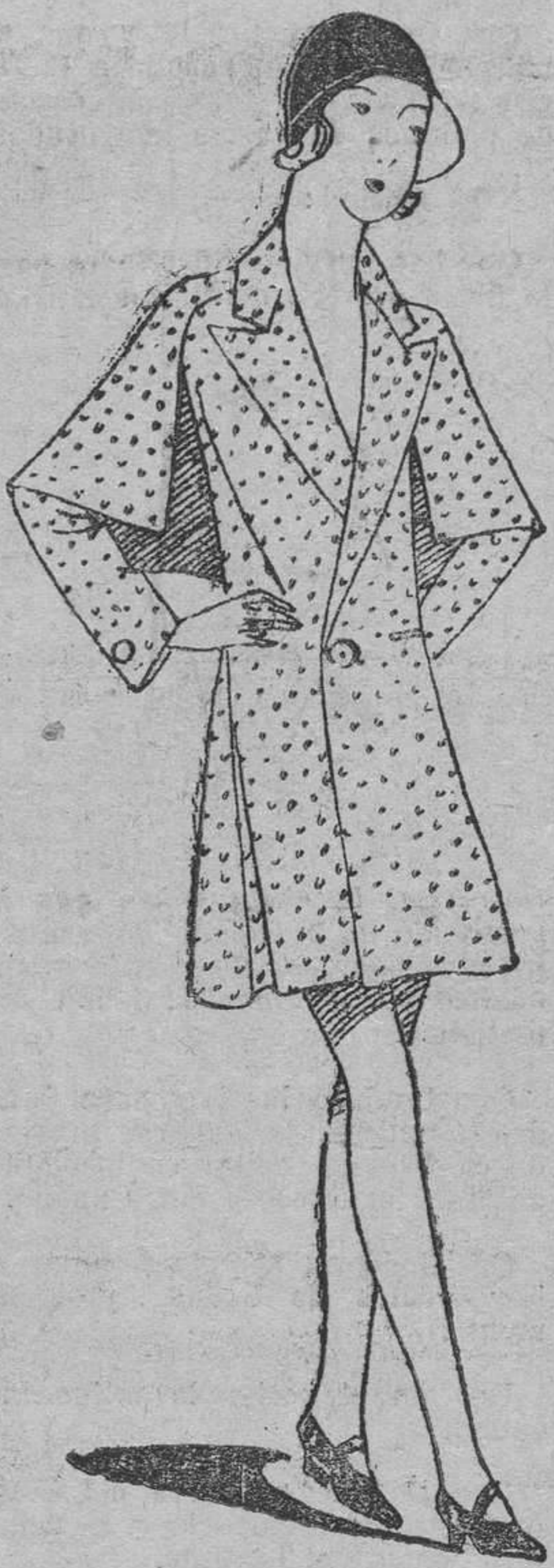
Mantón en tweed gris con molitas blancas