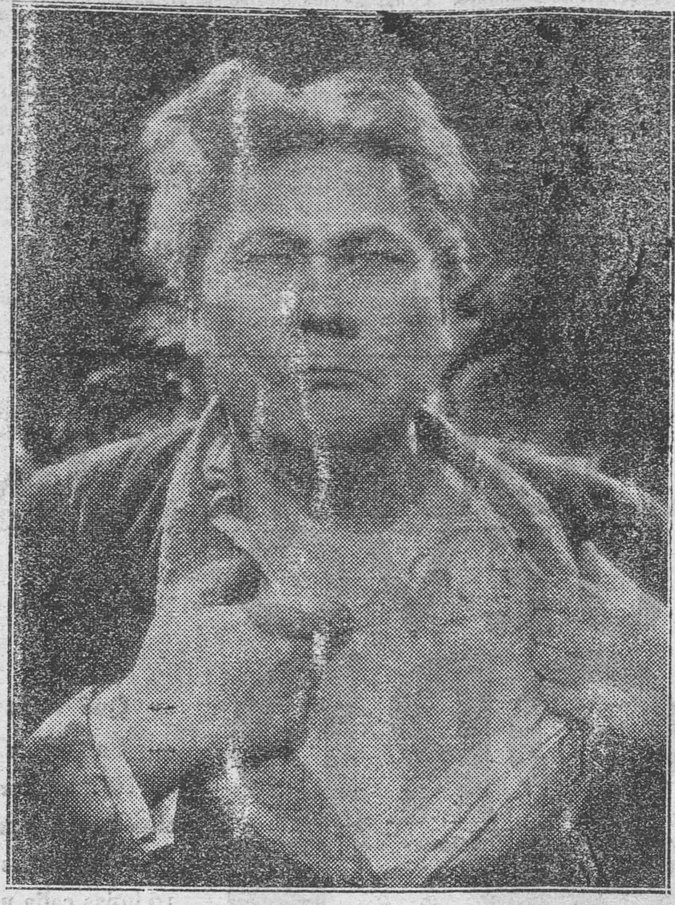
El formidable actor PAUL WERGENER , que con ANDREE LAFAYETTE y Werner Fuetterer interpreta admirablemente esta película, que se estrenará el próximo en el GRAN TEATRO

Adaptación de la célebre obra de Honorato Balzac (LUJO Y MISERIAS DE UNA CORTESANA)