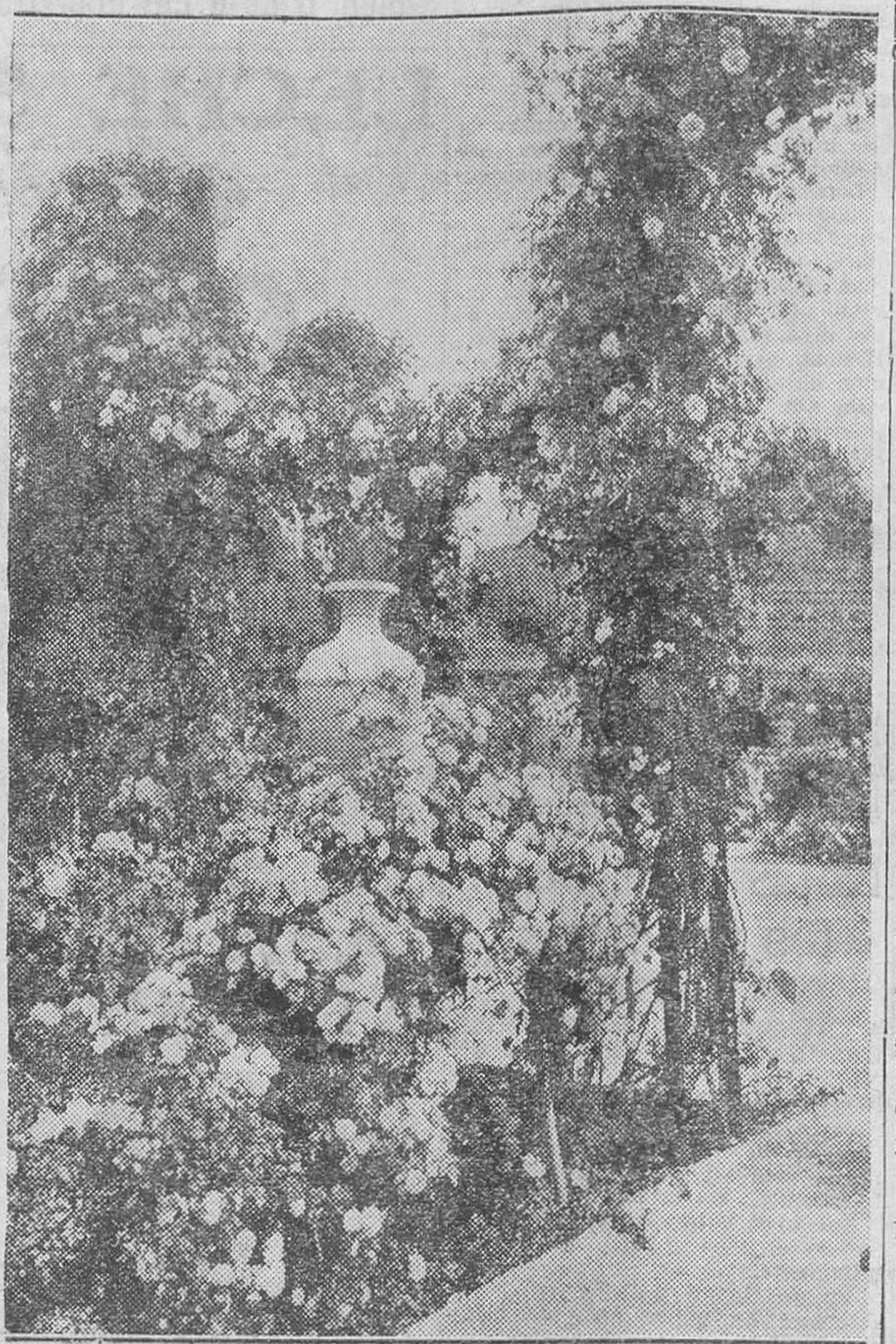
Detalle de los Viveros