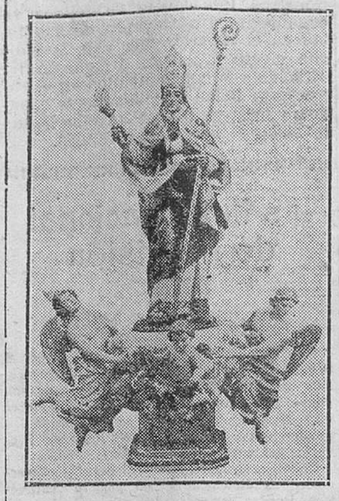
San Blas, Obispo y mártir, Patrón de Bocairente

¿Quién de los hijos de este querido y católico pueblo no te evoca el día de tu gran fiesta? ¿Quién deja de hacer los mayores sacrificios para ofrecerte sus amores, sus carinos, rindiéndote la mayor y más ferviente pleitesía?