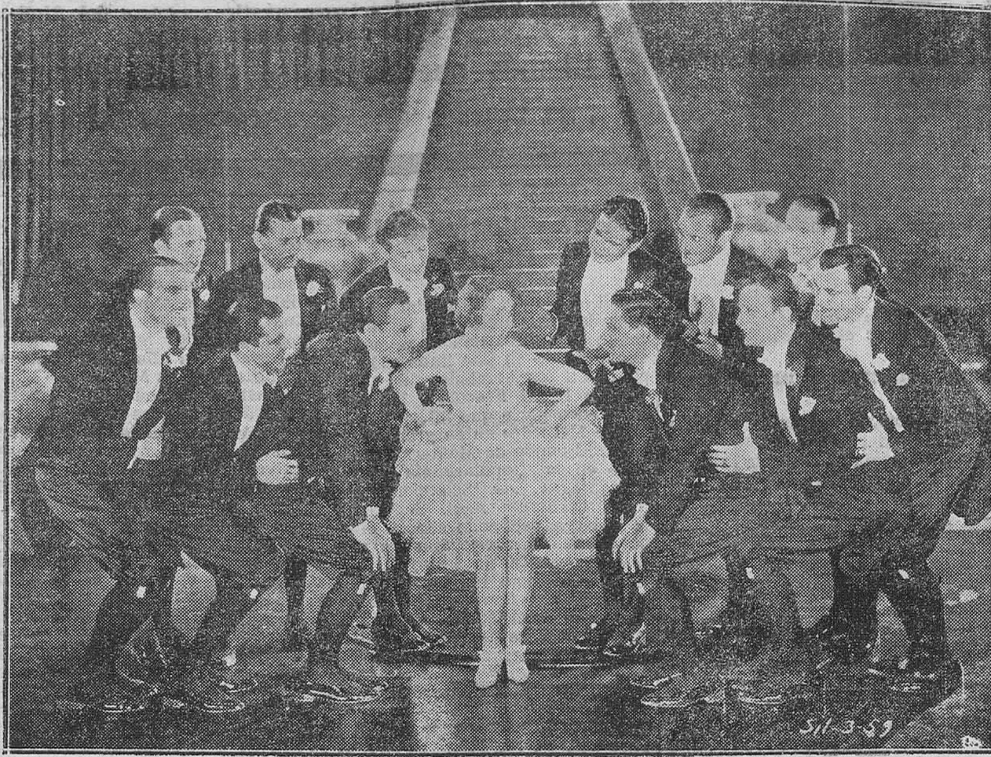
Divertidísima y graciosa escena de la revista 'Letra y música', de la Hispano Fox Film, en la que realiza una genial interpretación la celebrada estrella LOIS MORAN