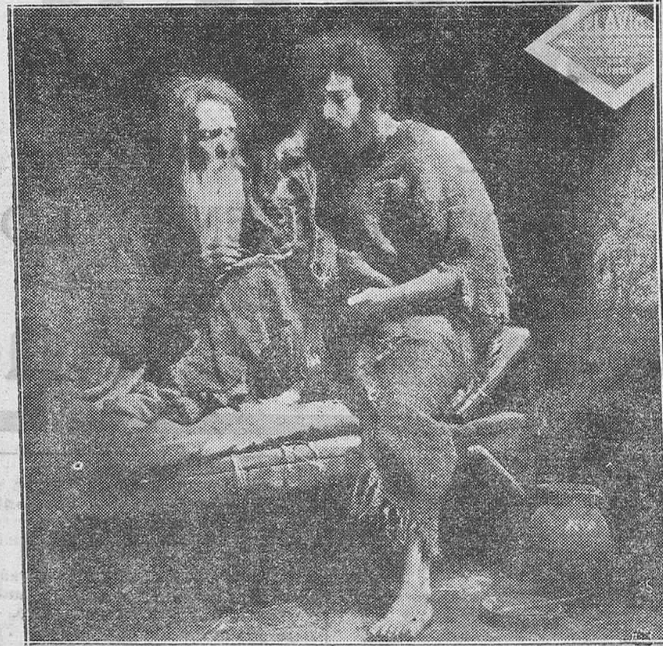
Un momento de esta sensacional película (edición moderna), cuyos principales protagonistas son Jean Angelo y Lil Dagover