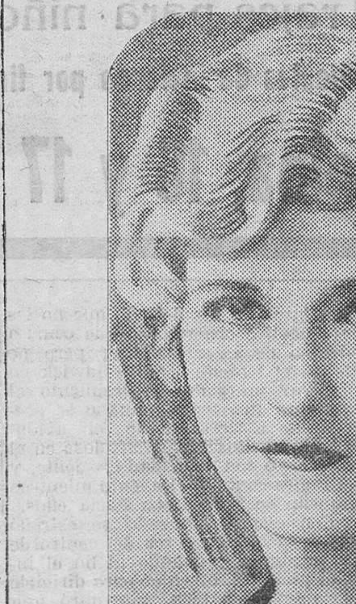
Laura La Plante