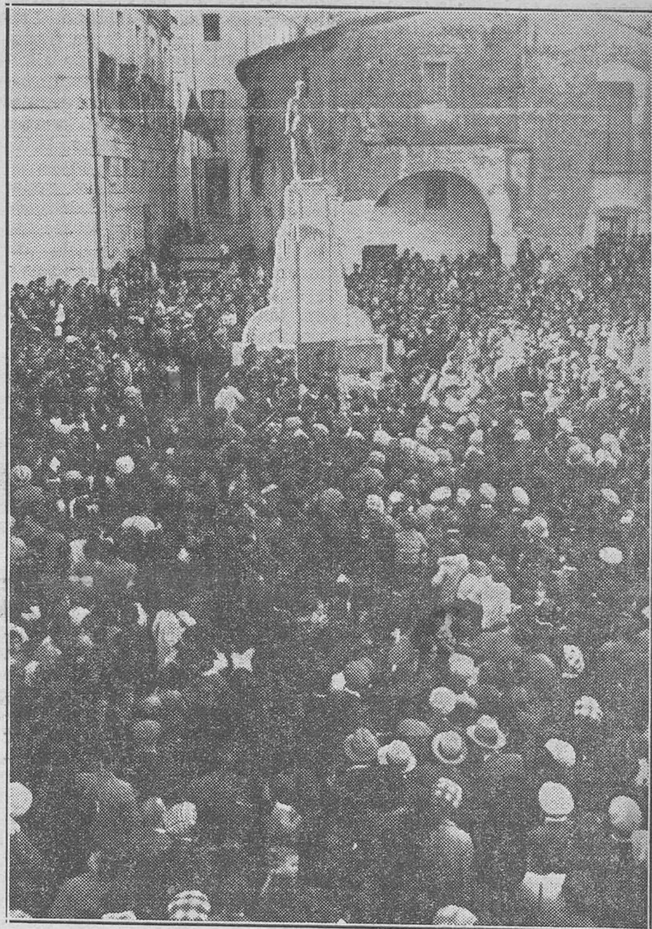
Solemne acto de ser descubierto el monumento que la ciudad de Oliva ha erigido a su hijo ilustre G. Ciscar.