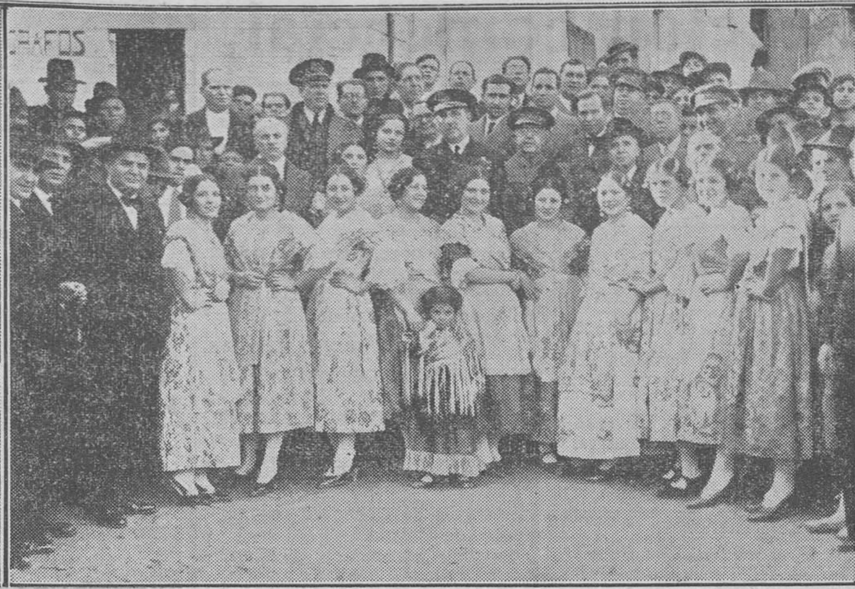
El ministro de Instrucción pública en el patio de Armas del Palacio Ducal, de Gandía, con los niños de las escuelas de esta ciudad.—Grupo de bellísimas señoritas de Oliva, que concurren al descubrimiento del monumento erigido a Ciscar.