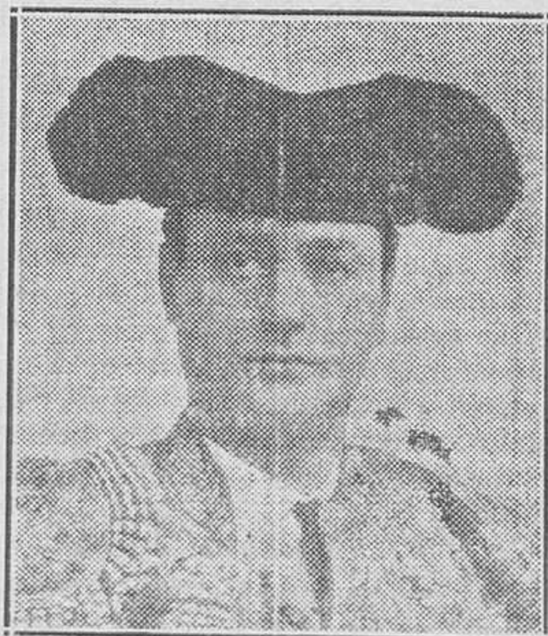
El Bomba, cuando en el apogeo de la fama, compartía la popularidad con el Espartero, Guerrita, Reverte y Fuentes

A partir de allí fué ya Emilio uno de los "ases" taurinos de su época, y contrató casi el máximo de corridas que podía ser en aquellos