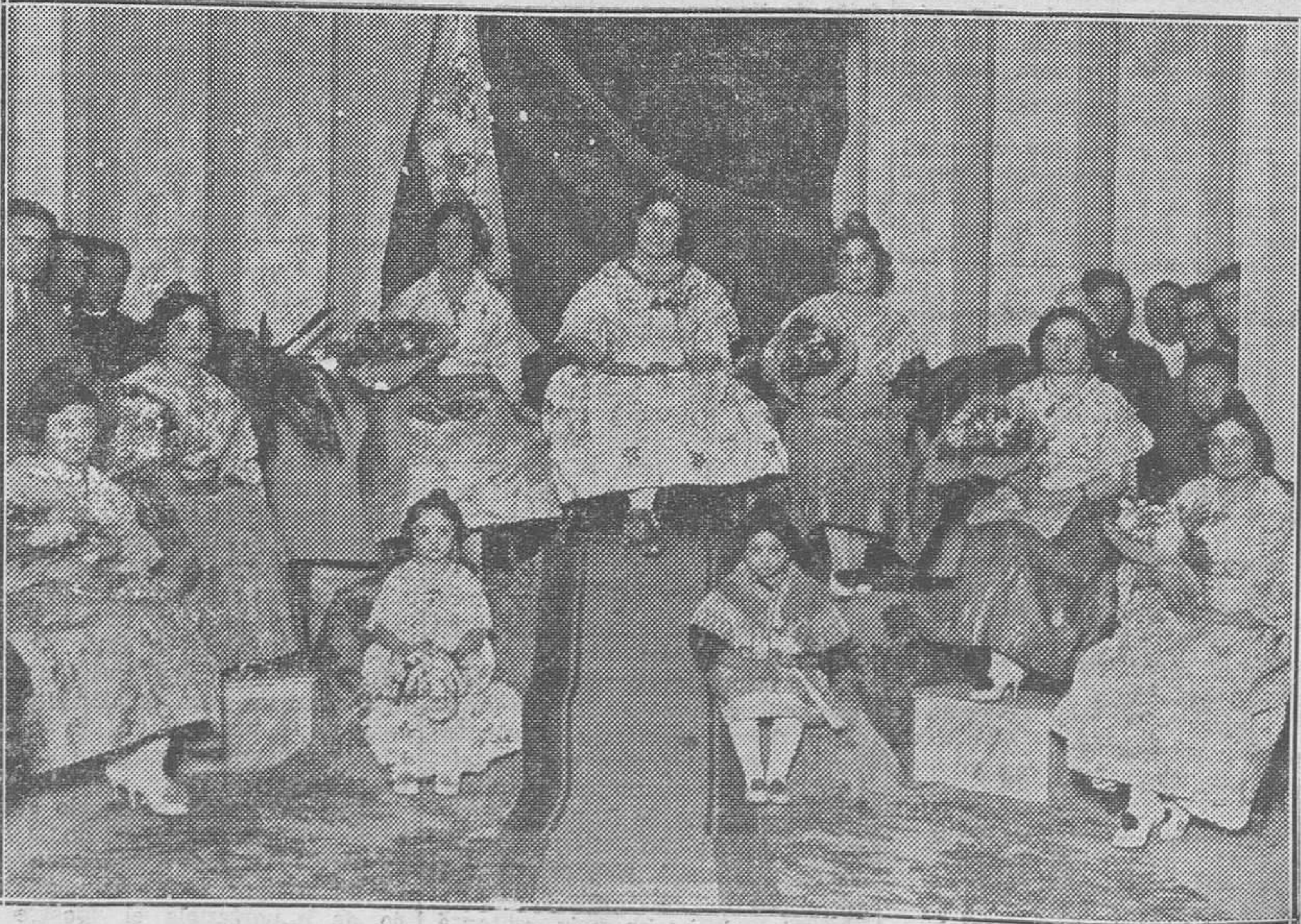
LOS JUEGOS FLORALES DE TORRENT.—La bellísima Reina, con la Corte de Amor.