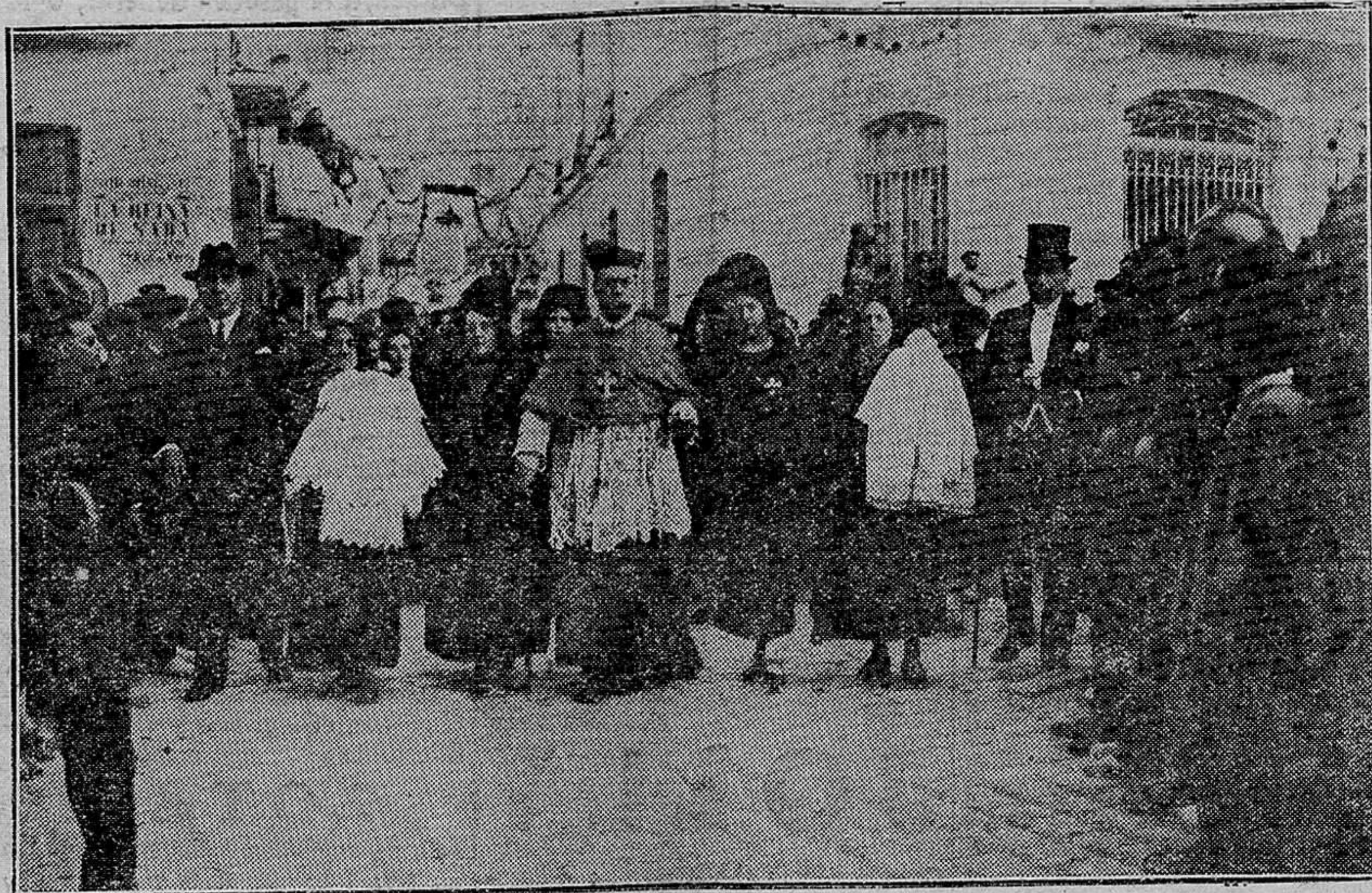
El Cardenal doctor Benlloch, en dirección a la capilla de la Virgen de la Salud, con los padrinos, para bautizar los dos niños que nacieron el día de la coronación de la veneranda Patrona de Algemesí, el día 27, a las siete de la tarde