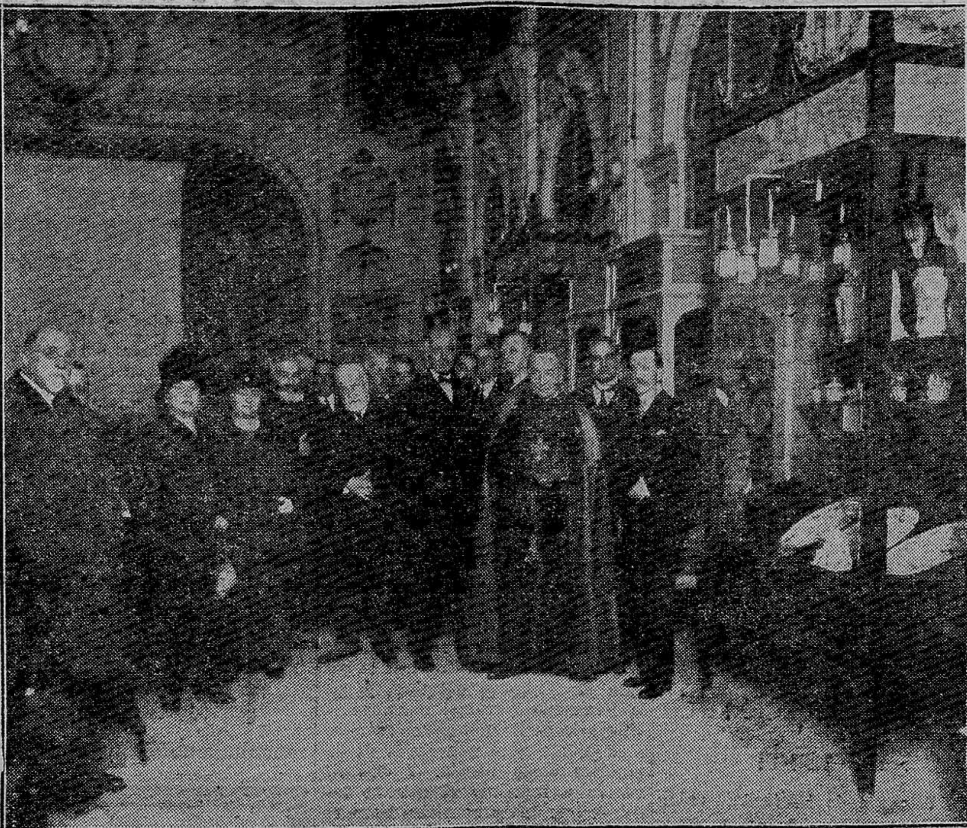
El ilustre conferenciante, junto a una vitrina, con las autoridades y otros distinguidos concurrentes al acto