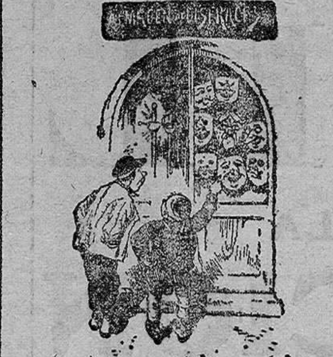
—¡Santo Dios! ¡Si era la cara de la dueña de la tienda!