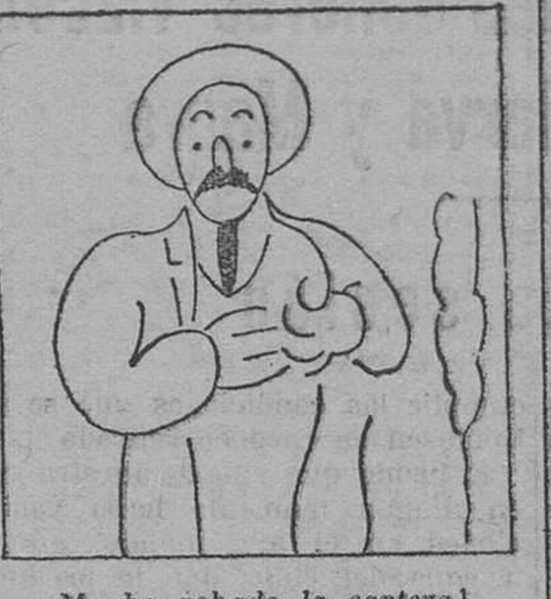
—¿Me ha robado la cartera!