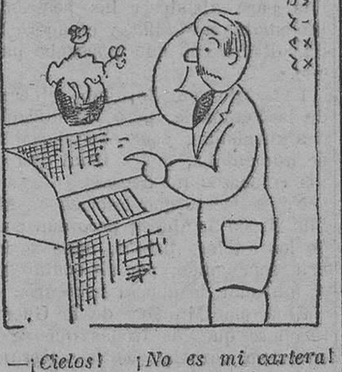
—¡Cielos! ¡No es mi cartera! ¡Ha robado a un infeliz!