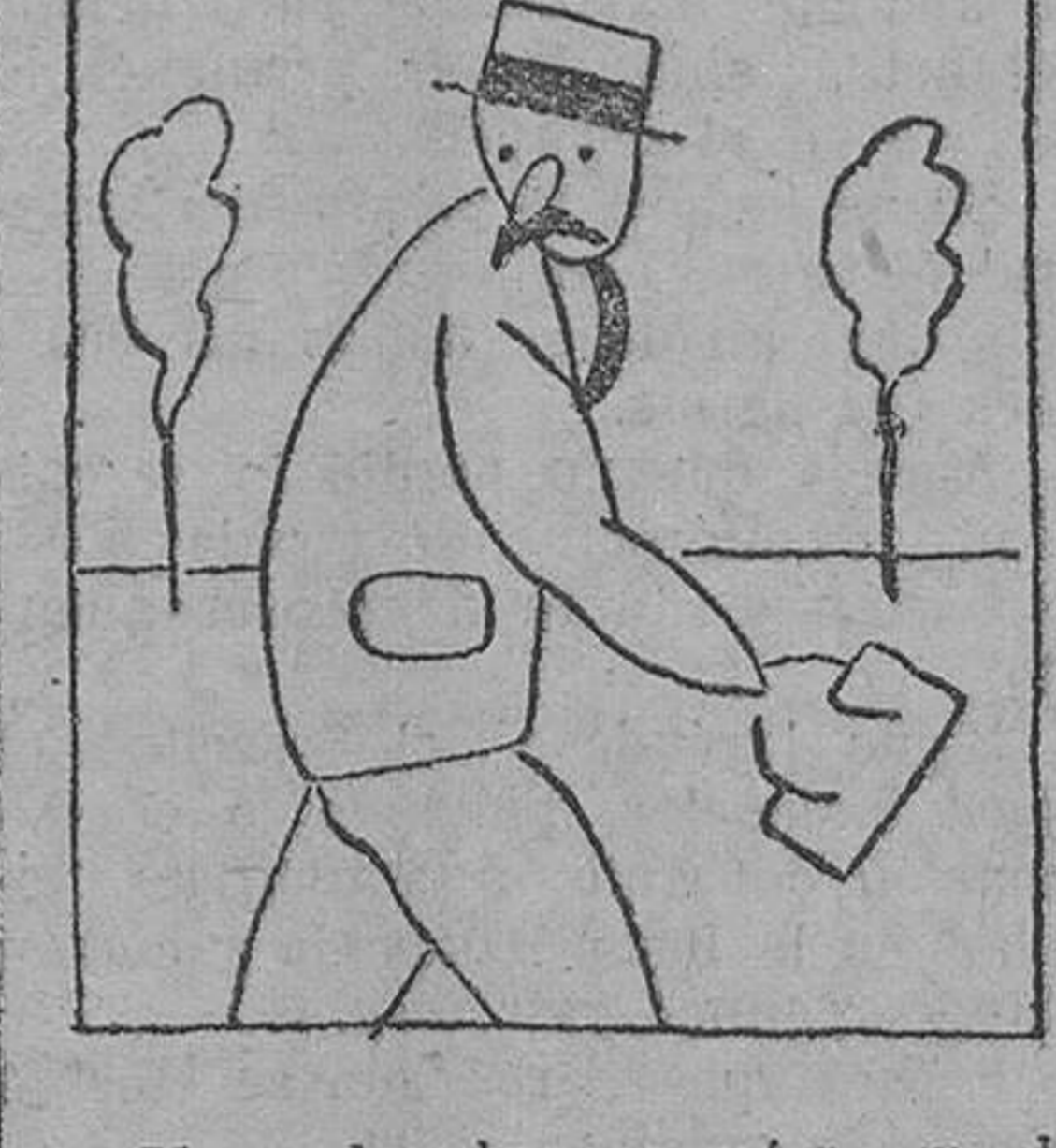
—Vaya, hombre: a mí no me la pegas nadie.