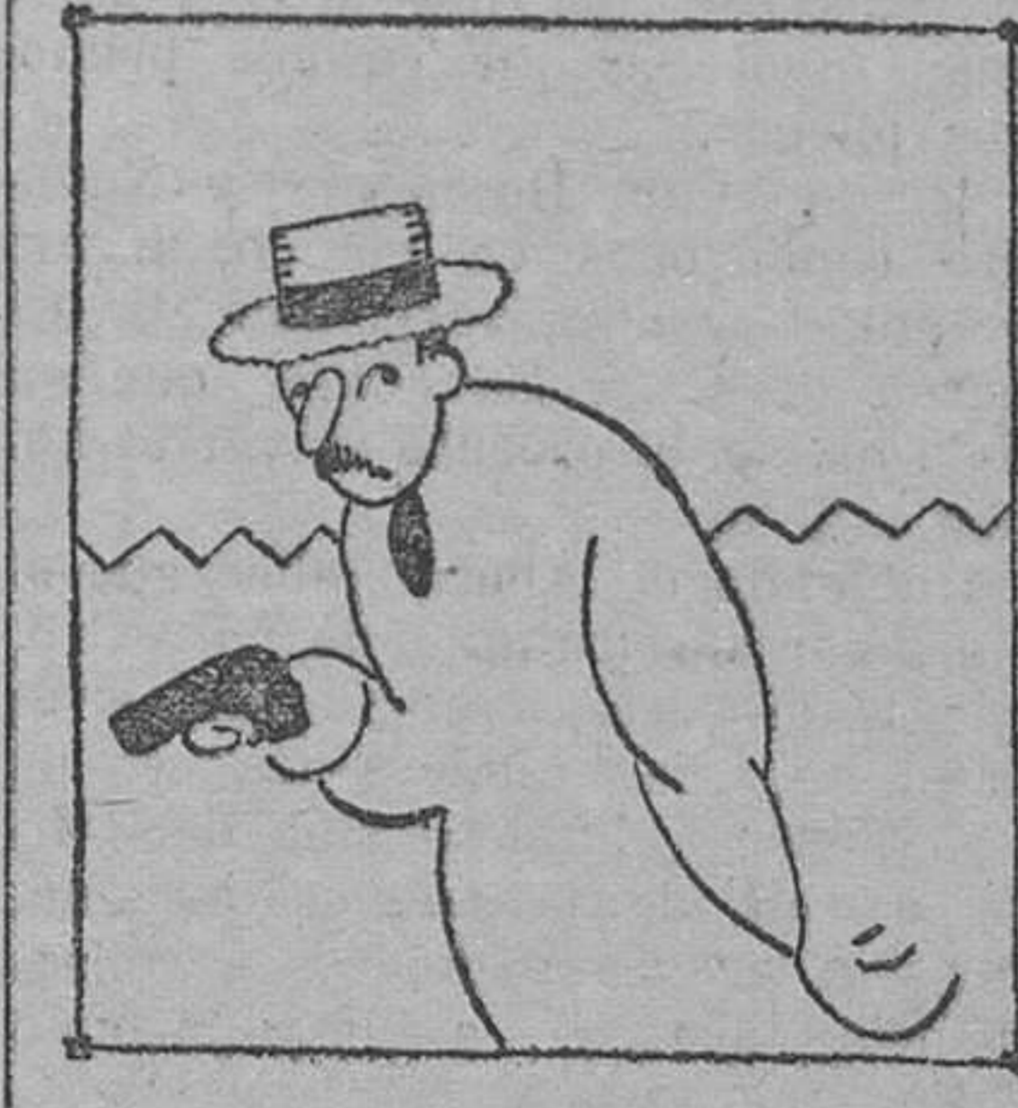
—¿Lo que es a mí no hay quien me rebel?