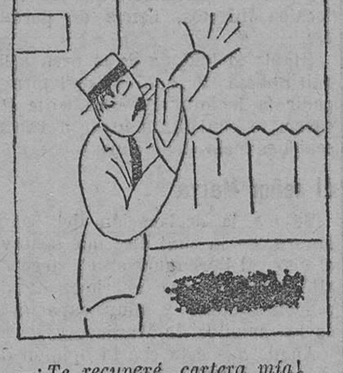
—Te recuperé, cartera mía! Al llegar a casa: