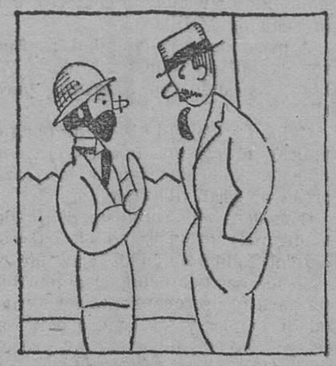
—¿Qué encontraron? ¡Usted perdone!