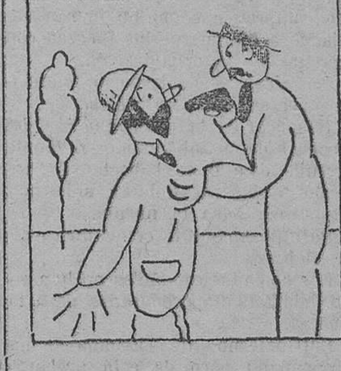
—Menos mal, que le encontré. ¡La cartera, o le pago un tiro!