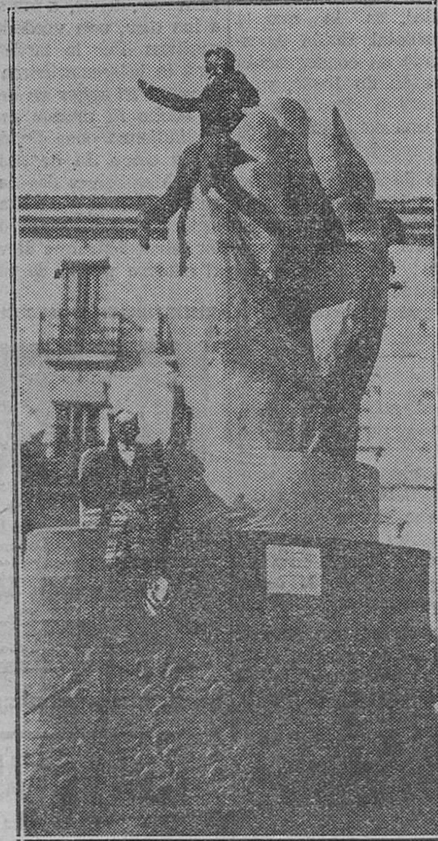
Falla de la calle de Jerusalem

RECAUDACION El Ayuntamiento recaudó ayer las siguientes cantidades: Por arbitrio de carnes: Matadero general, 6.448'45 pesetas; Matadero del Grao, 5.906'8; Matadero del Cabanal, 2.957'2; Estaciones sanitarias, 1.135'7. Por análisis y examen de subvenciones, 3.415. Por circulación rodada, 1.375.