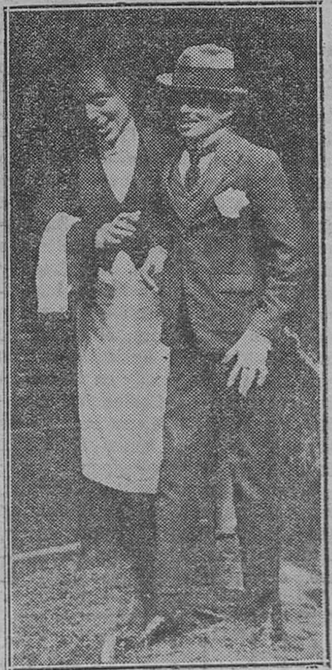
El coleccionista ideal de cucharillas

ción de la «falla», dándole cierta modernidad que no dudamos tendrá imitadores en años sucesivos.