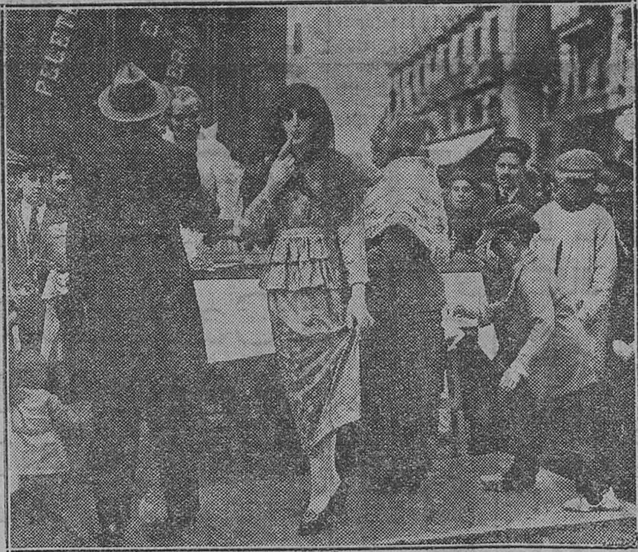
La «torrater», que estableció ayer su puesto en la calle de la Paz

El Jurado de premios «als llibrets» de «Lo Rat-Perat», ha hecho público su fallo, en la siguiente forma: «Reunida la Secció de Literatura de «Lo Rat-Perat» en el domicilio social, a les dotze hores del dia divuit de Mars de mil noucents vintiquatre, per a premiar els llibrets de les fallas d'enguany, acordaren concedir, per unanimitat, els premis de la següent forma: Un dobló d'a quatre i un plat de gloria, al llibret de la falla del carrer de la Pau; el Flori d'or, al llibret de la falla dels carrers Barrys dels Pavosos i Grines; i en atenció al mèrit d'altres llibrets rebuts, se concediren accésits als següents: plaza del Anhel, Santa Teresa i Pintor Domingo, Maldonado i Vintater, Pelayo i Bonavista i Corcheria. Son dignes de menció els llibrets