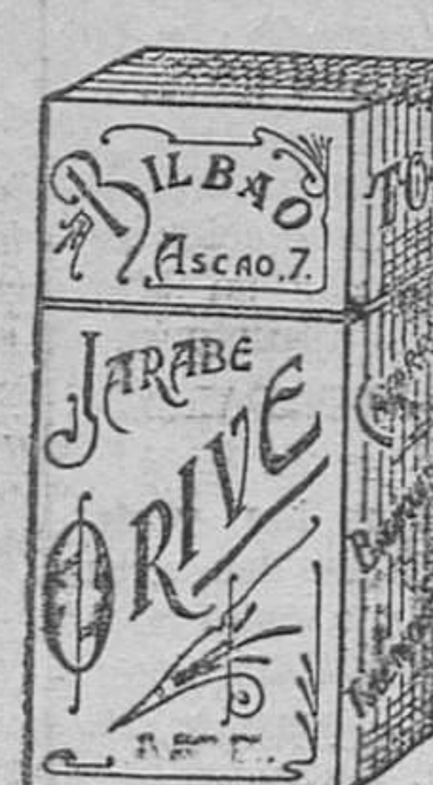
EL MEJOR remedio para EL PEOR catarro, Jarabe Orive.

CERCA DE LA ESTACIÓN DEL CABAÑAL Se venden 3.238 metros cuadrados en esta forma: un solar de 32 por 22 metros; otro de 35 por 20; otro de 21 por 16; otro de 30 por 17; otro de 32 por 29 metros cuadrados. Razón: calle del Mar, 26, principal derecha.