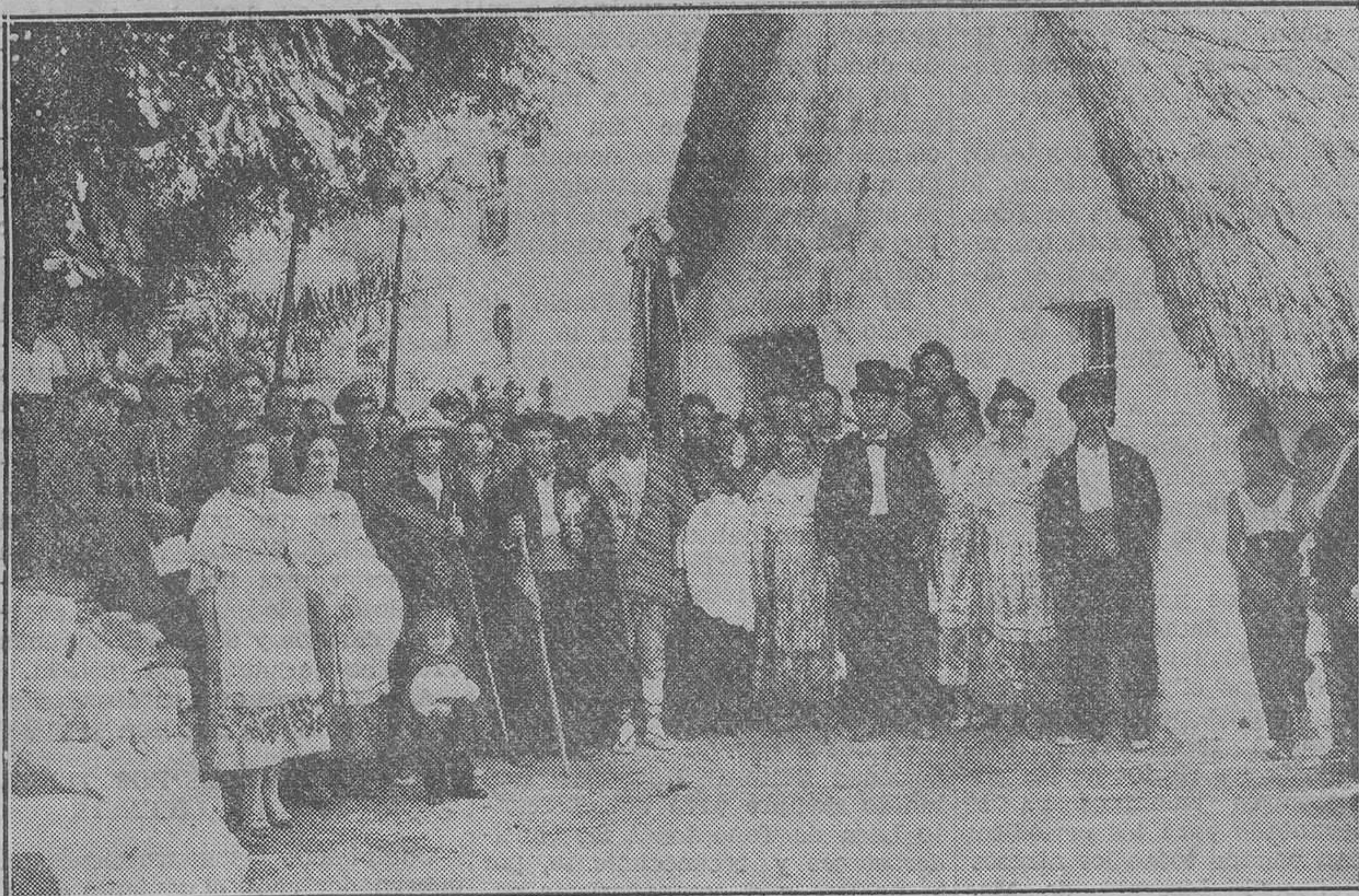
Fiestas en la calle del Porvenir, de Ruzafa. Bautizo de un niño, vistiendo la comitiva trajes antiguos de nuestra huerta (Fot. Lázaro.)

car y defenderse jugando "a comunistas y guardias civiles..." Ante un hecho de esta naturaleza, verán ciertamente con pena los maestros cómo sus palabras de paz no encuentran el eco debido en los tiernos infantes que le escuchan. Para que no fueran baldíos