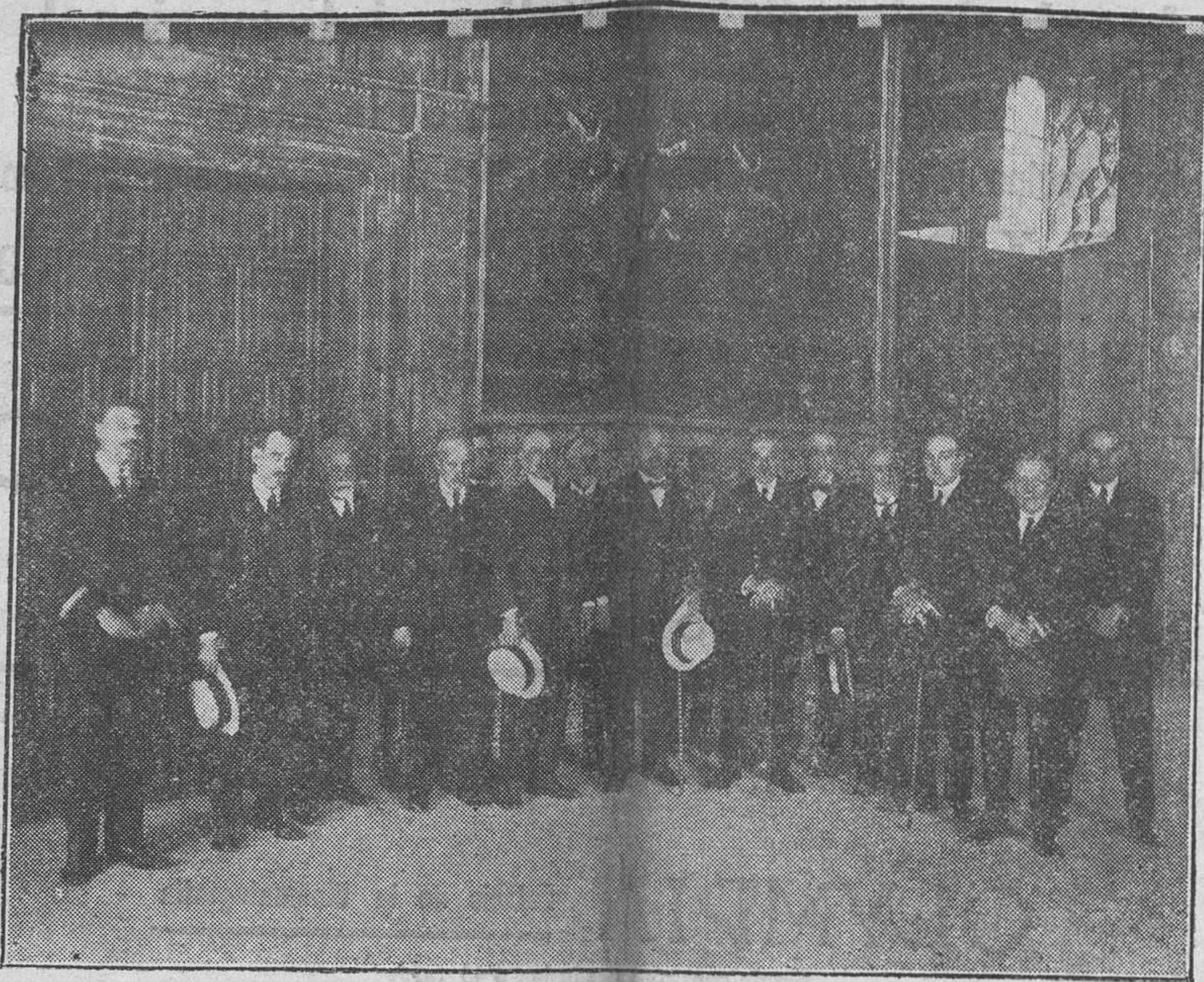
Ayer se reintegró nuestra Diputación provincial del antiguo edificio de la Generalidad