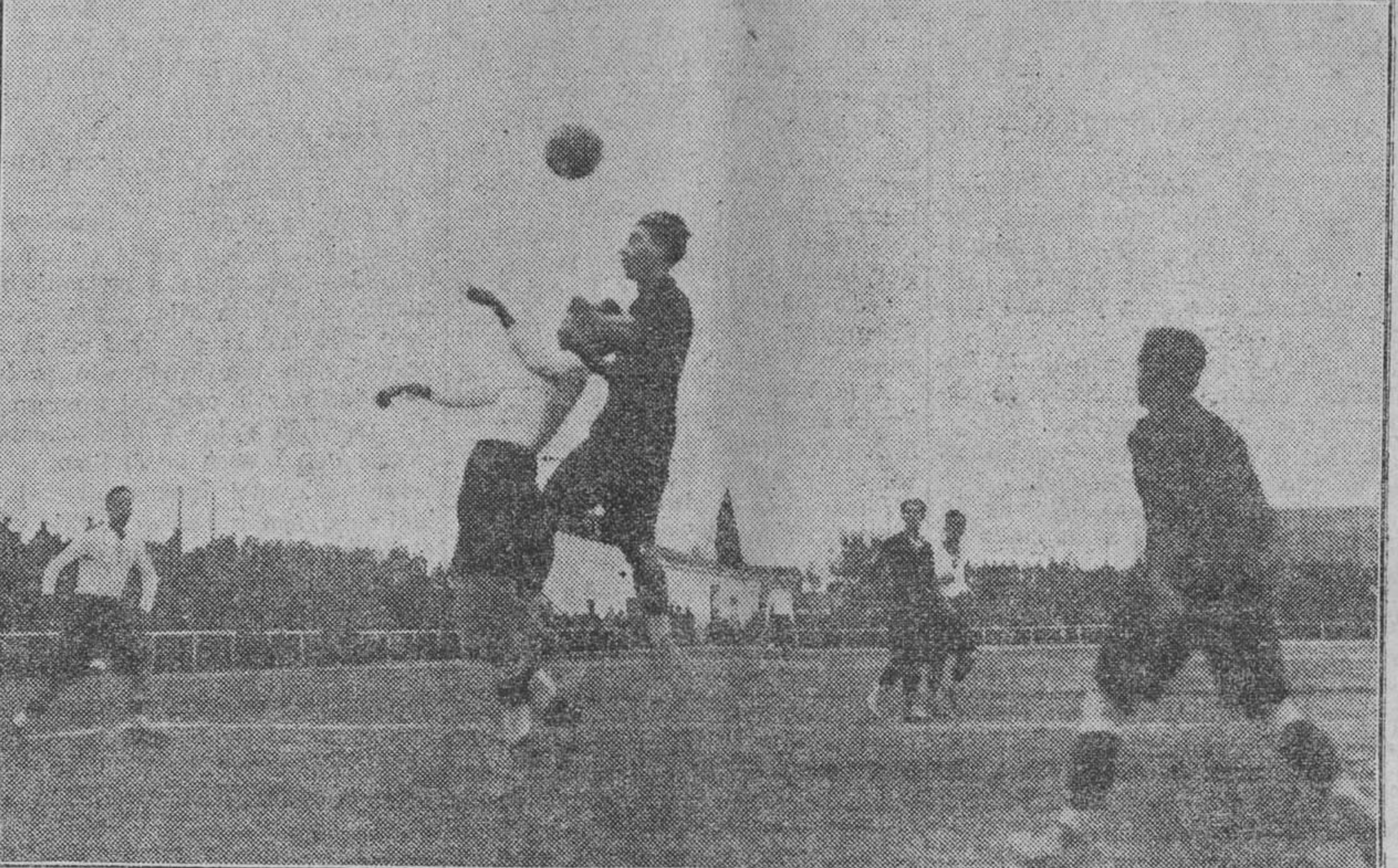
Una demostración del «cambio de forma» de nuestro Campeón

lugar la celebración de un interesante partido entre los equipos C. D. Europa y Sagunto F. C., ambos del grupo B. Los precios serán económicos y las señoras tendrán la entrada gratis. Advertimos también que, al fin de que solamente puedan disfrutar de este derecho de elección los señores socios, se exigirá la presentación del recibo del mes actual. Los señores que tengan hechos encargos para todos los partidos, también podrán retirarlos en los dichos días 10 y 11. Para el público en general quedarán abiertas las taquillas a las mismas horas, en el Club, a partir del día 12. La directiva,