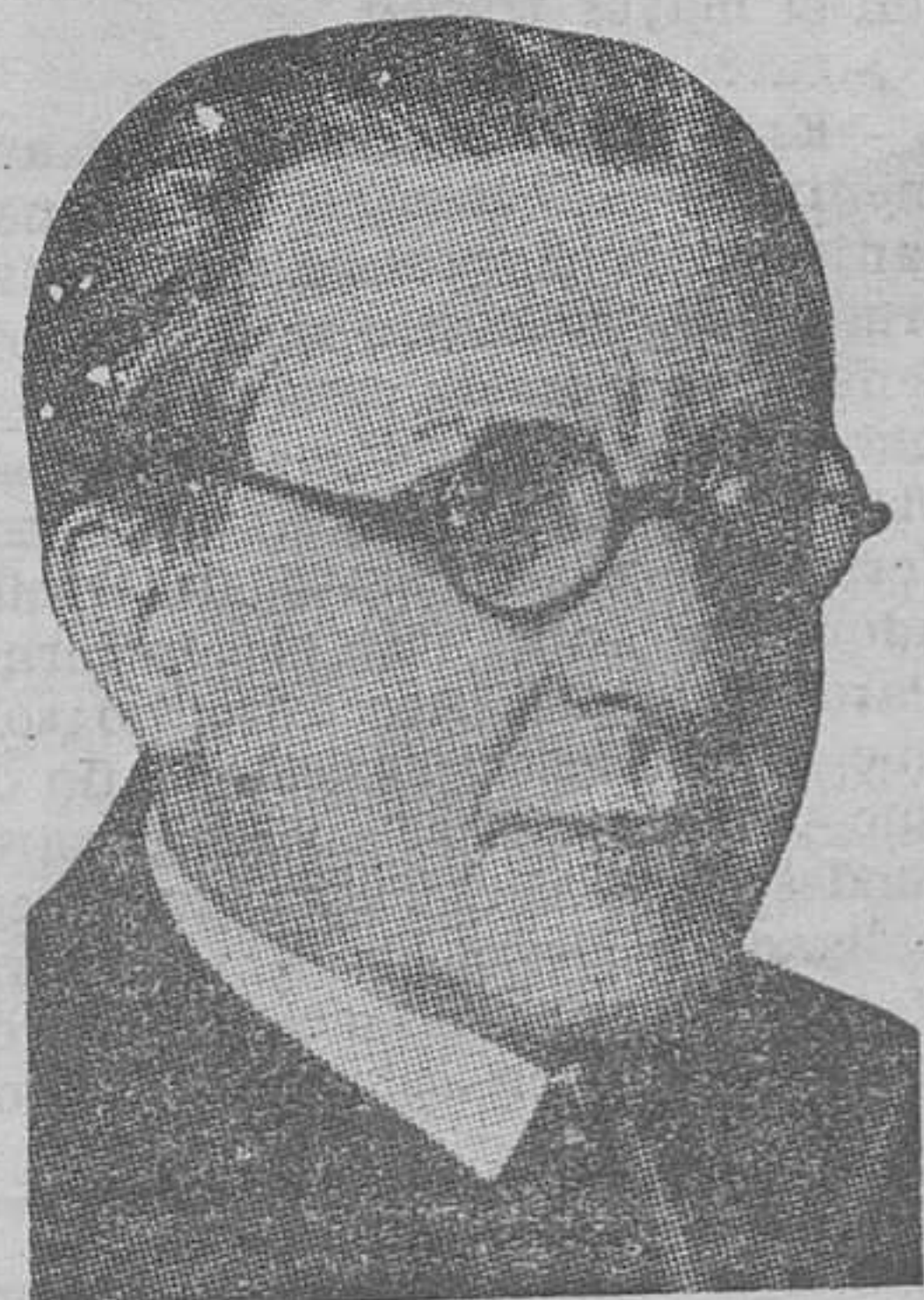
Don José Anguera de Sojo, que ha sido nombrado fiscal general de la República

—Total: que podríamos nosotros conquistar el mercado de Cuba, pero para ello sería necesario llegar a un cambio de concesiones; naturalmente, nadie da nada gratuitamente. Con esto desharíamos la dificultad de la exportación de las treinta y tantas mil toneladas que nos sobran. En cuanto al consumo interior, con lograr que se abaratasen las tarifas ferroviarias—no al extremo del 50 por 100, como en el caso de la naranja, sino bastan-