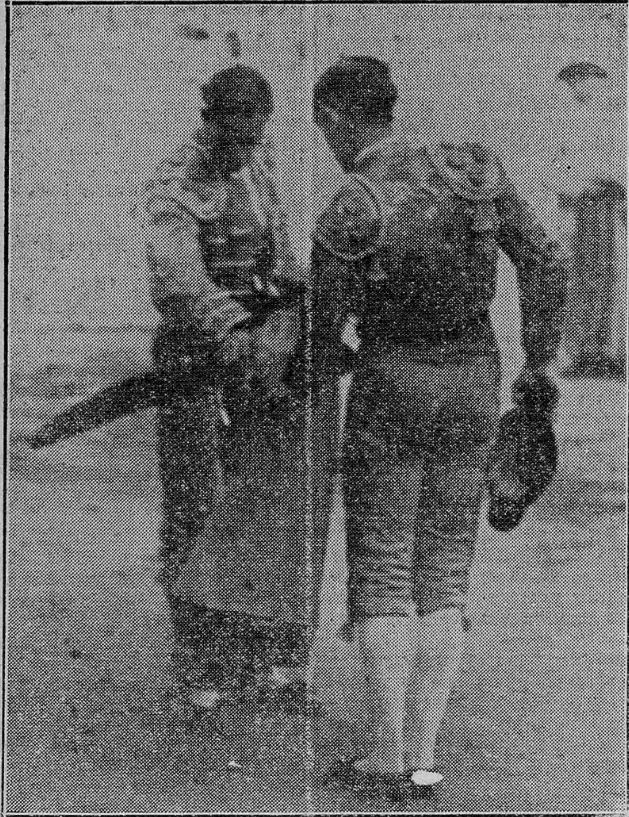
Momento en que Marcial Lalanda concede la alternativa al Estudiante

resolverse las dificultades en la lidia, porque usted no ignoraba que cada toro tiene su lidia correspondiente... —Sí. —Pues, ¿por qué no lo dice usted ahora? —Es que... yo... es... que no recuerdo esas lecciones. Total: que Marcial hizo un examen