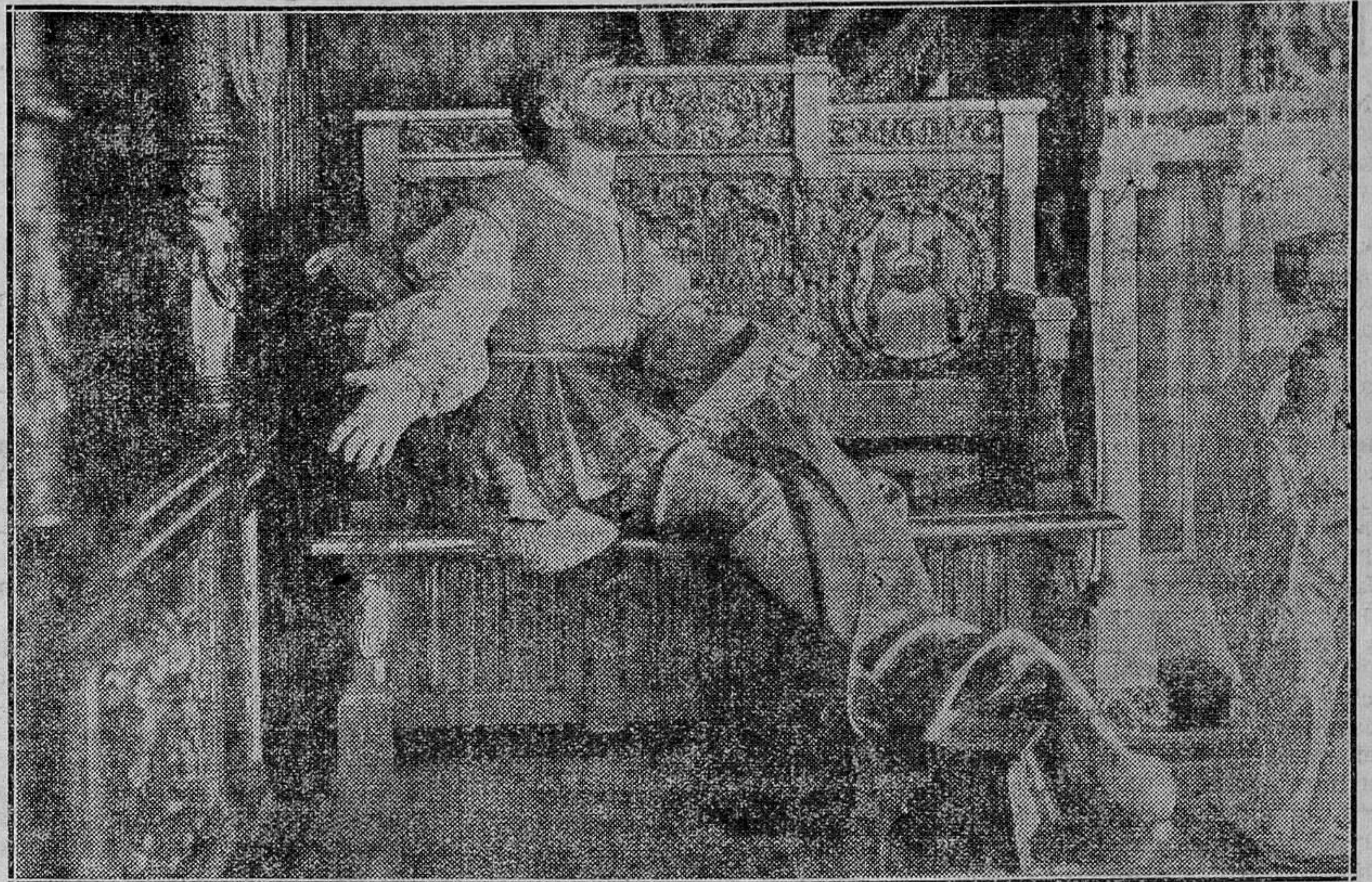
Estatua de San Ignacio, en su camerino del Santuario de Loyola

Pero el caso es que estamos en el mundo para perfeccionarnos. El progreso no es una fatalidad irremediable, como creyeron los enciclopedistas, ni mucho menos pueden quedar hombres que esperen, como Cabanis en 1799, que