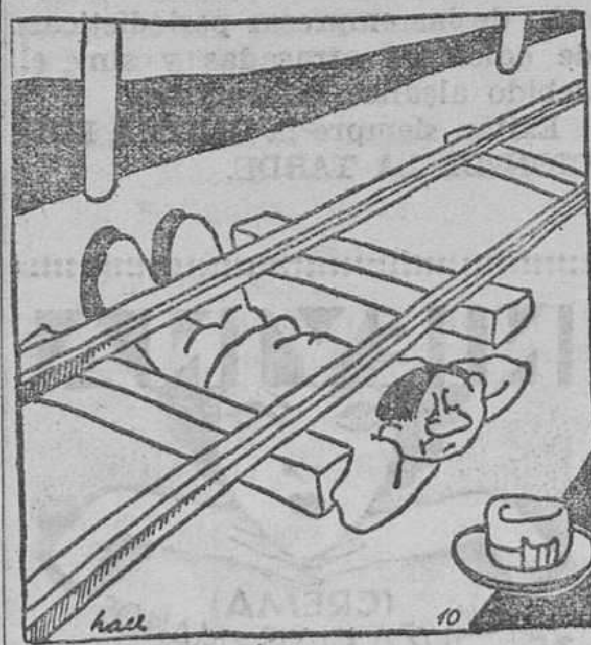
El hombre que quiere poner fin a una vida llena de equivocaciones.

—La Asociación de Maestros de Primera enseñanza no oficial de la provincia de Valencia, celebrará junta general extraordinaria mañana, a las once de la misma, en la Escuela Normal de maestros de esta ciudad, para tratar de los asuntos relacionados con la apertura de clases y otras cuestiones de interés para los asociados.