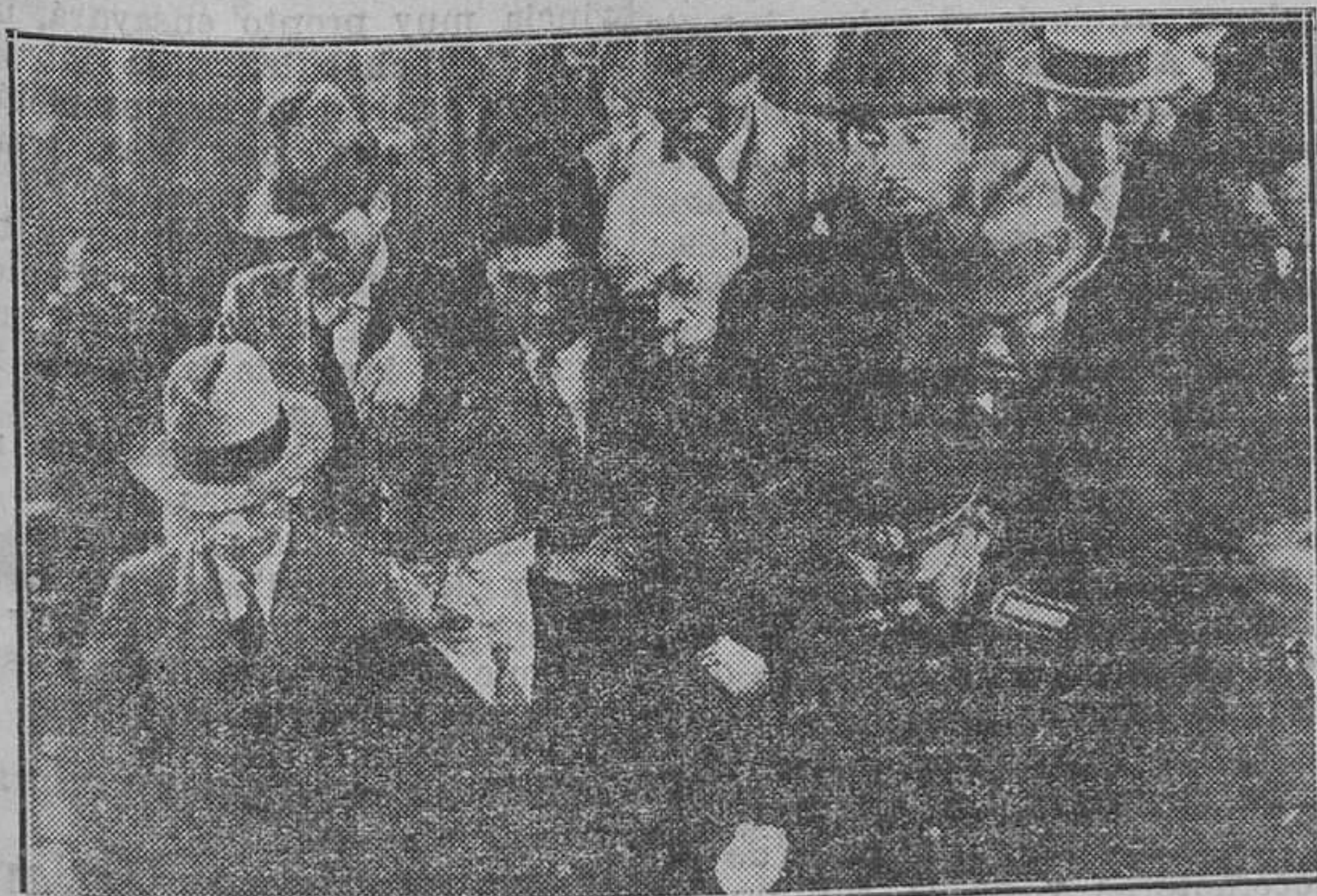
El presidente del Gobierno japonés, Mr. Hamaguchi, pocos momentos después del atentado en que fué gravemente herido hace unos meses, y a consecuencia de cuyas heridas ha fallecido estos días