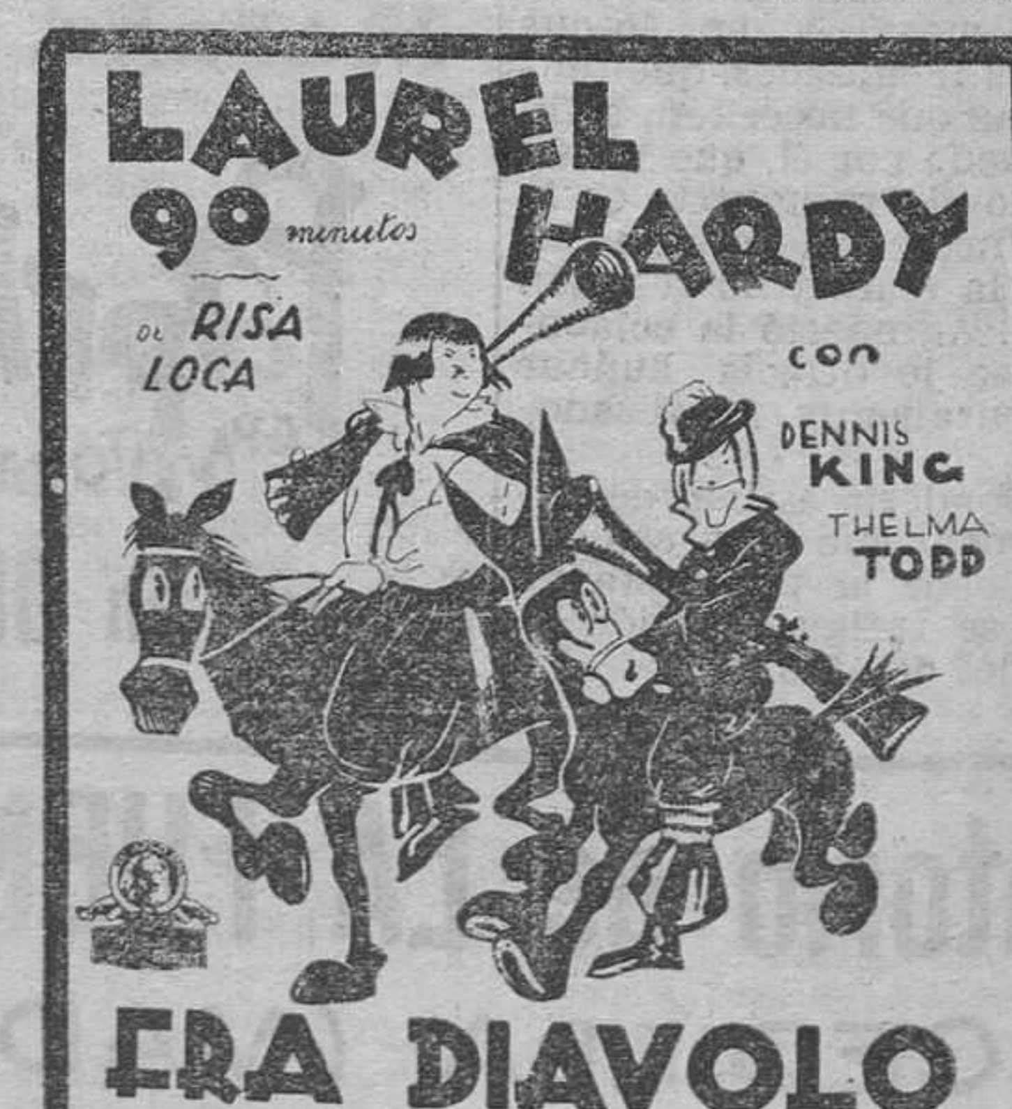
La opereta del medio millón de dólares y el millón de carcajadas

Teléfonos de LAS PROVINCIAS 12-5-20 y 13-8-97