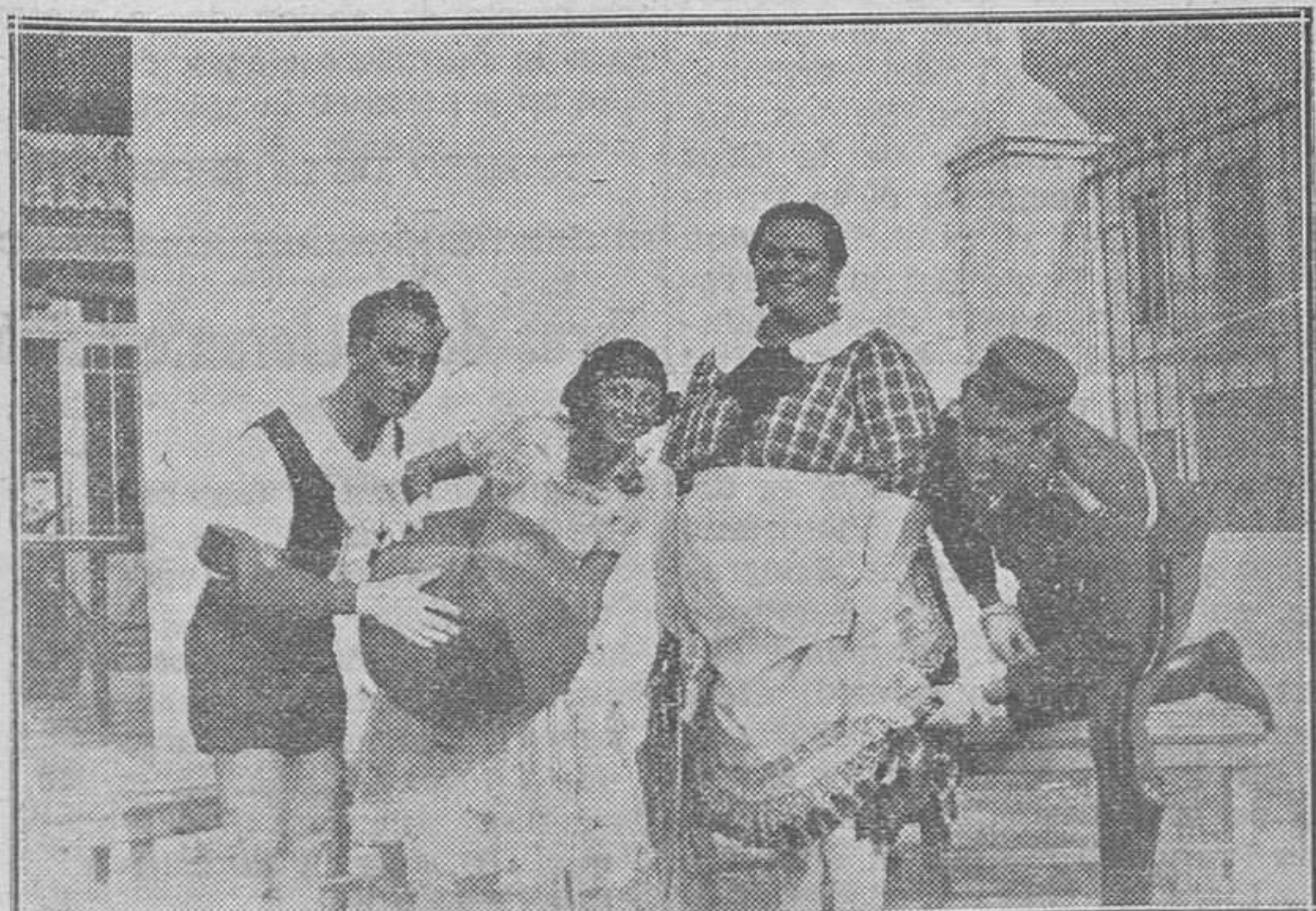
Benimámet.—Grupo que obtuvo el primer premio en el baile de mascarar celebrado el sábado pasado

—De mejor gana estaríamos tomando el fresco, en un butacón, como usted... Pero hay que hacer el reparto. Nuestro Sindicato ha