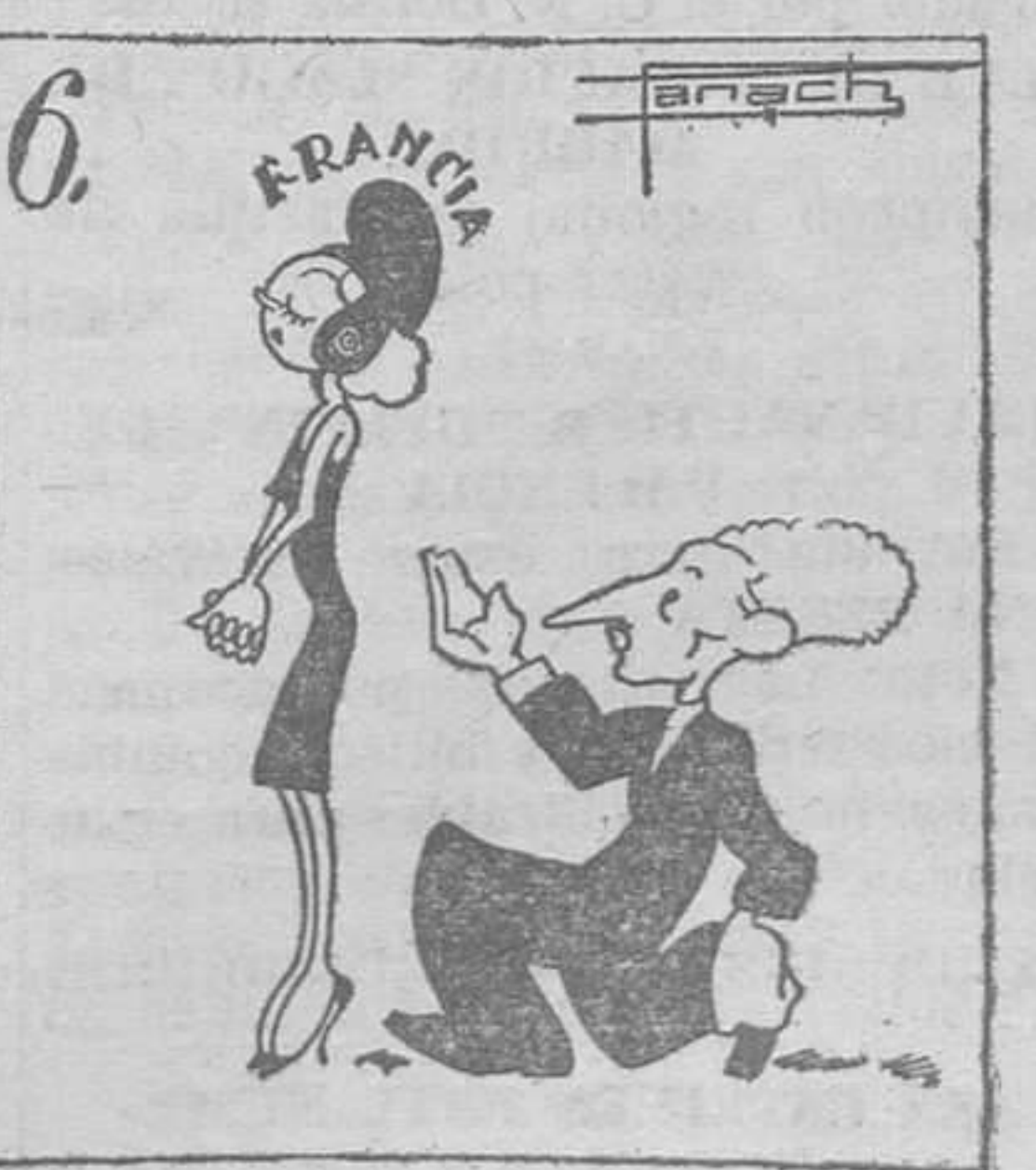
Y ahora, por lo que veo, es con Francia el coqueteo. (Texto y monos de Panach.)