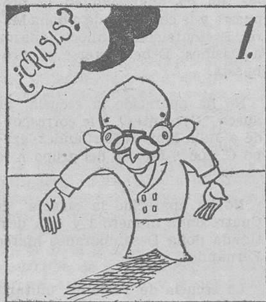
¿Crisis? ¿Por qué? No hay motivo y el Gobierno aún está vivo.