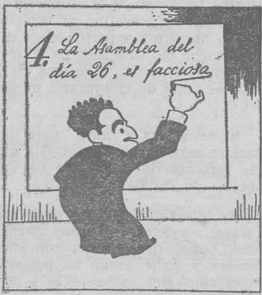
Por facciosa fué tachada la Asamblea vasco-gada.