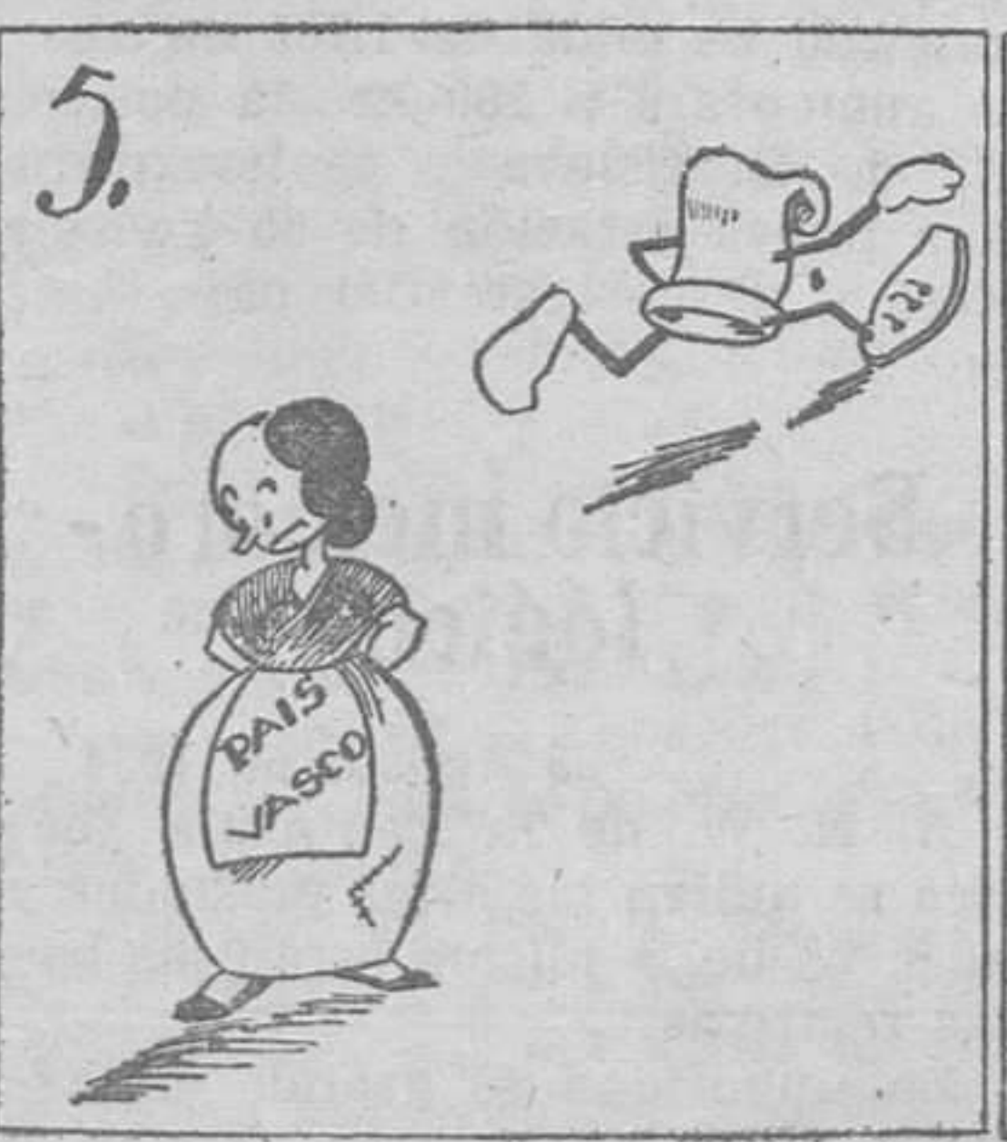
Faltó solidaridad de la Generalidad.