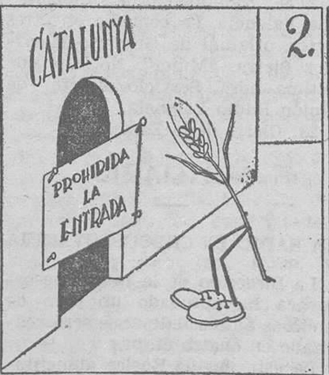
Eso que hacen con los trigos, no se hace con los amigos.