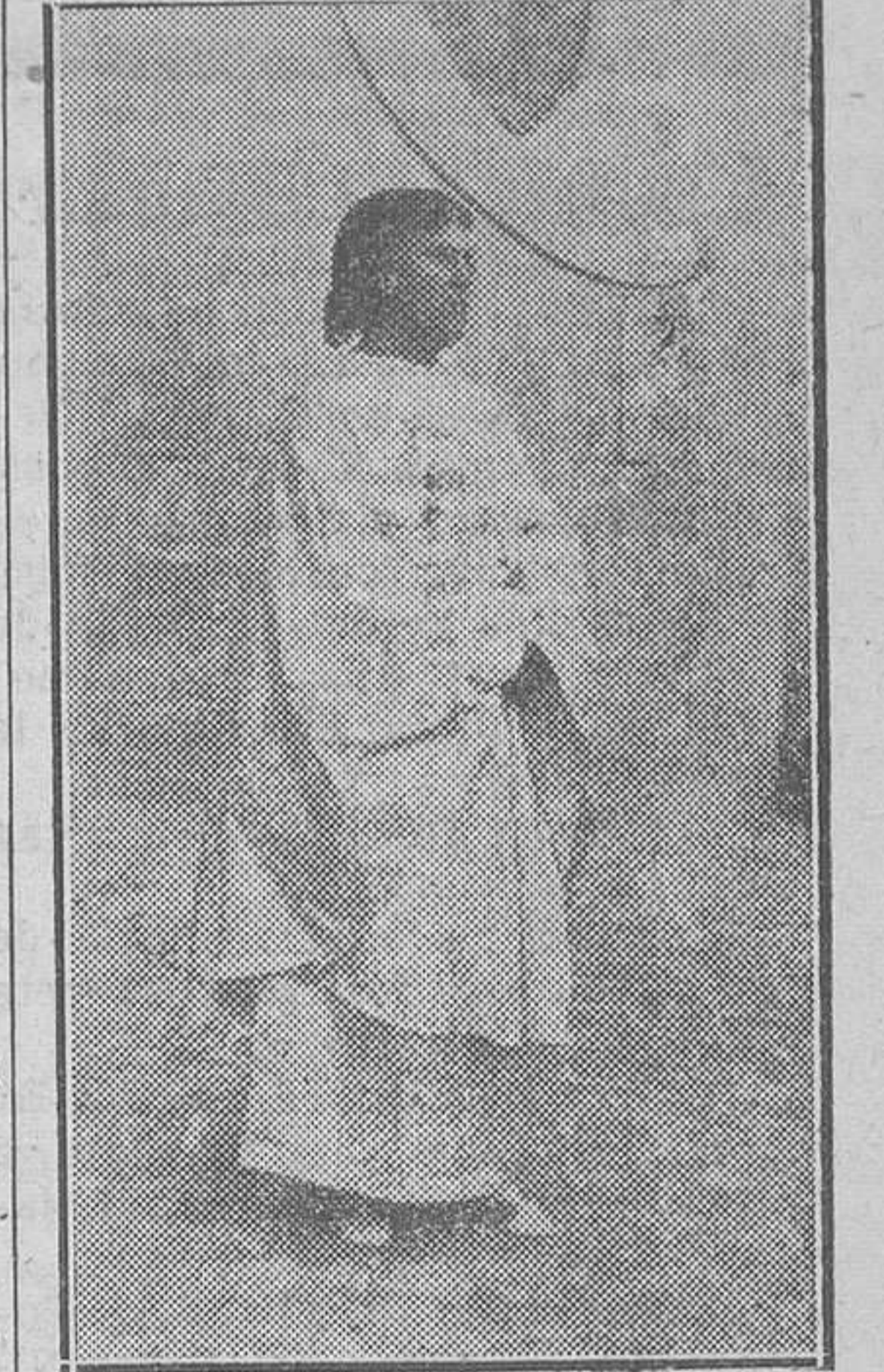
San Juan