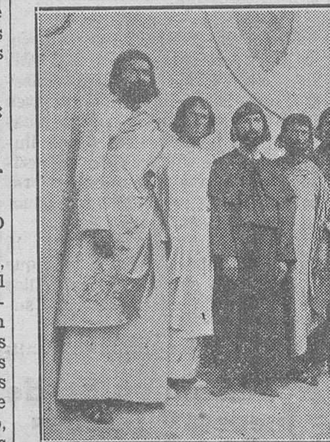
Los Apóstoles.

Agosto. A pleno sol las calles en la hora de la siesta se llenan de gentío que marcha hacia la iglesia para aposentarse en buen sitio... El templo, abarrotado ya. Gentío incalculable en galerías y tribunas. El pueblo llena el templo... Mariaposas aleteantes de millares de