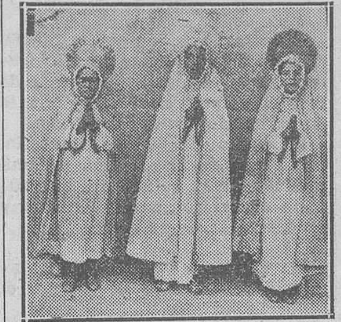
"Maria" y "Marías mudas".

Drama sacro-lírico (para nosotros no es auto sacramental como eruditos erróneamente lo califican)