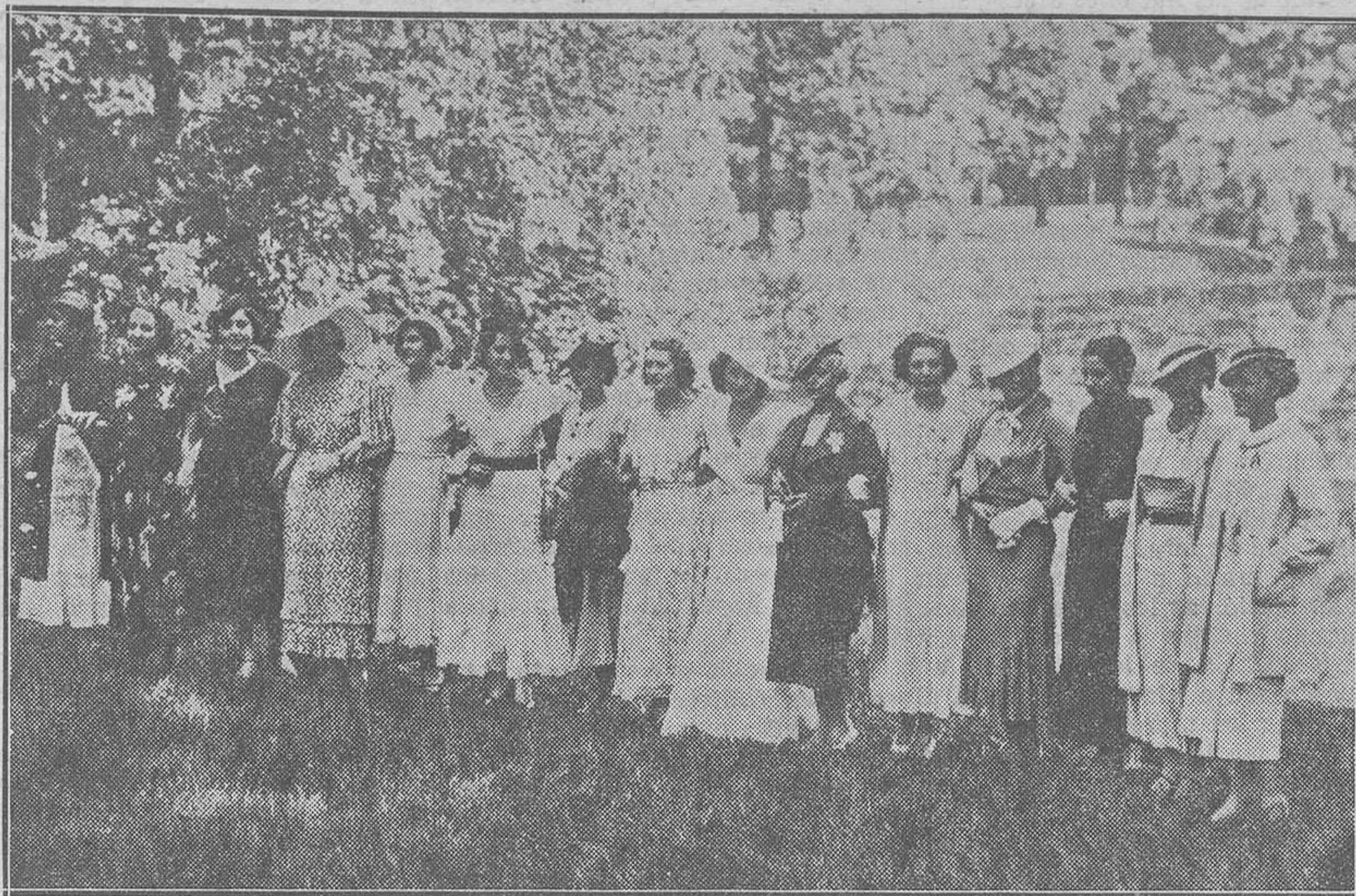
Las "misses" reunidas en el bosque de Bolonia, de París, donde pasarán varios días antes de emprender el viaje a Inglaterra, lugar elegido este año para la celebración del concurso

El nazi: No. No es así. En Noviembre no se votaba por la persona de Hitler, sino por la política exterior del régimen y para aprobar la nueva lista de los diputados. Pues bien: podía ser un ciudadano enemigo personal de Hitler y encontrar, sin embargo, acertada la separación de Alemania de la Liga de Naciones. Podía no ser nazi y votar, a pesar de ello, en favor de la lista en que figuraban Hugenberg y Papen. Quiero decir que el mismo ciudadano que en Noviembre dijo "sí", podía decir esta vez "no", sin que ello significara la pérdida de un solo