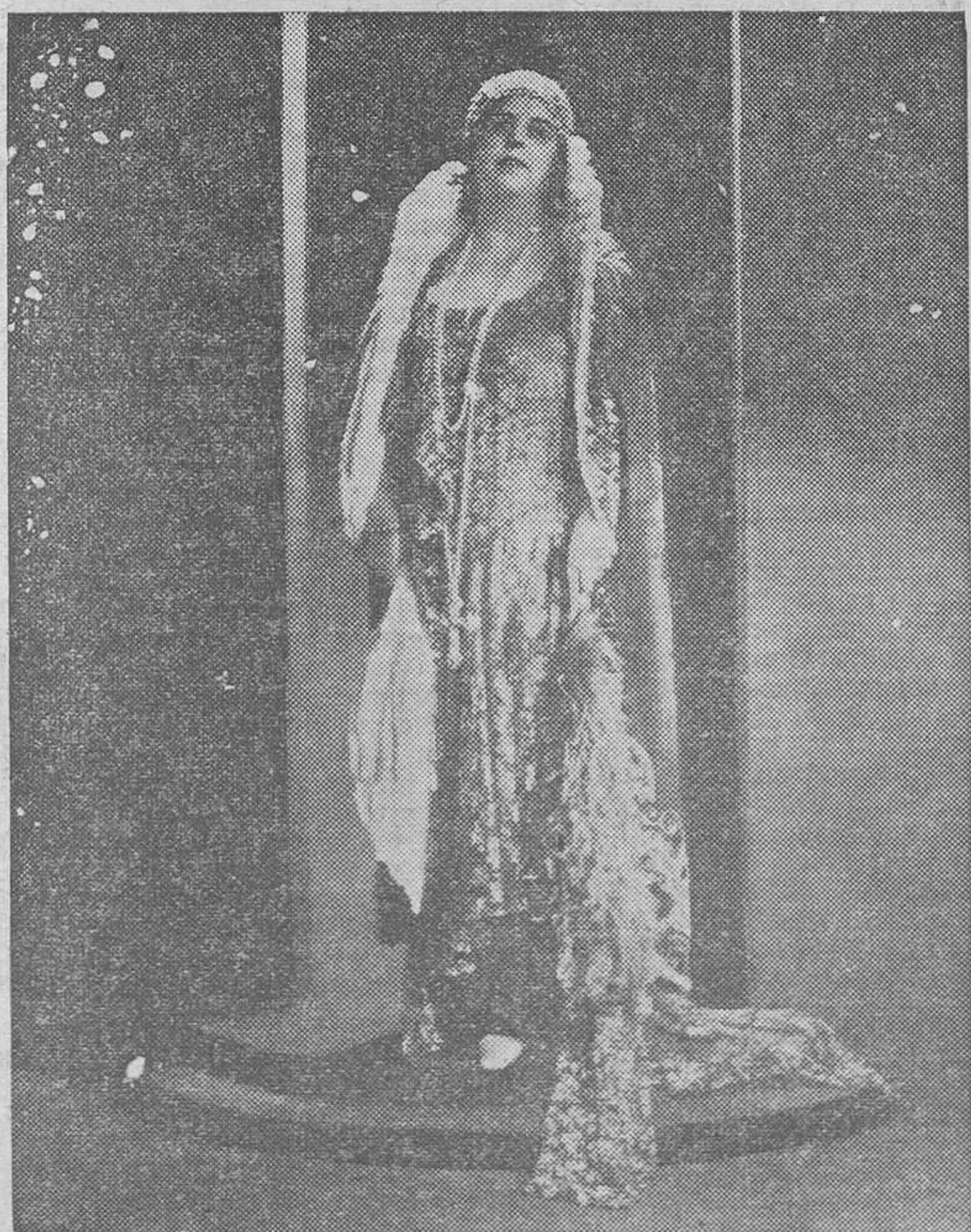
María Llácer, eminente tiple valenciana que cantará mañana sábado "Aida" y el domingo "Tosca" en la plaza de Toros