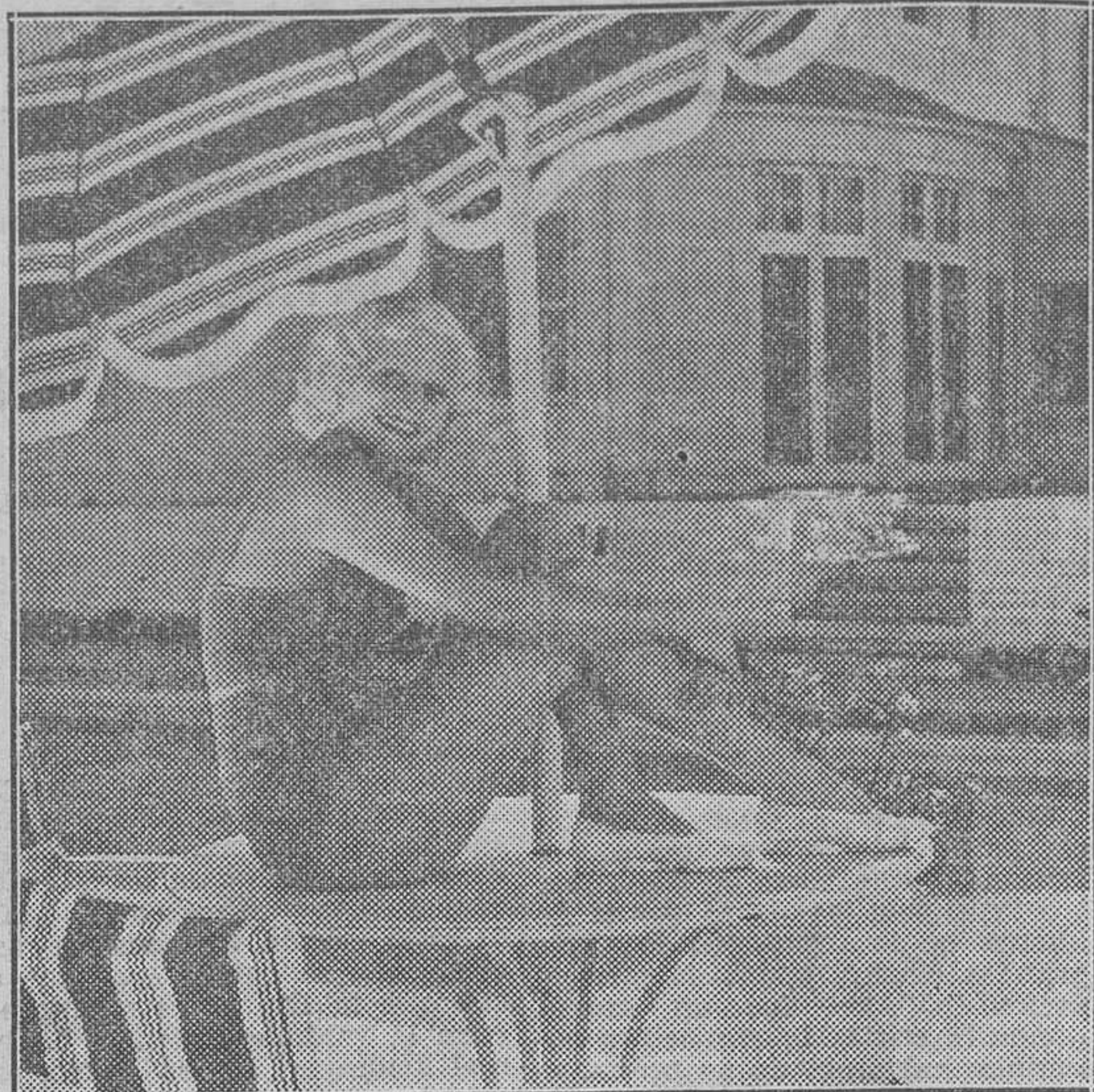
Jean Harlow, la rubia espléndida de Metro G M., hurtando al solaciente su epidermis delicada, siempre en ofrenda al aire, la luz y el mundo. Marítima y cinematográfica, la Harlow conserva su estilo de vestuario mínimo

El film de Zoltan Korda para London Film Productions, primitivamente titulado en español "A través del Congo" (Kongo Raid), se titulará en definitiva "Bozambo", que es el nombre de su protagonista. Esta película, basada en la novela de Edgar Wallace, "Saunders of the River", entrará en producción simultáneamente con "La Pimpinela Escarlata" en los estudios de la prestigiosa editora inglesa. Los exteriores se rodaron ya durante la expedición a Africa del grupo filmador, capitaneado por Zoltan Korda, y como se ha anunciado, serán estrellas de "Bozambo" Paul Robeson y Nina Mae McKinney.