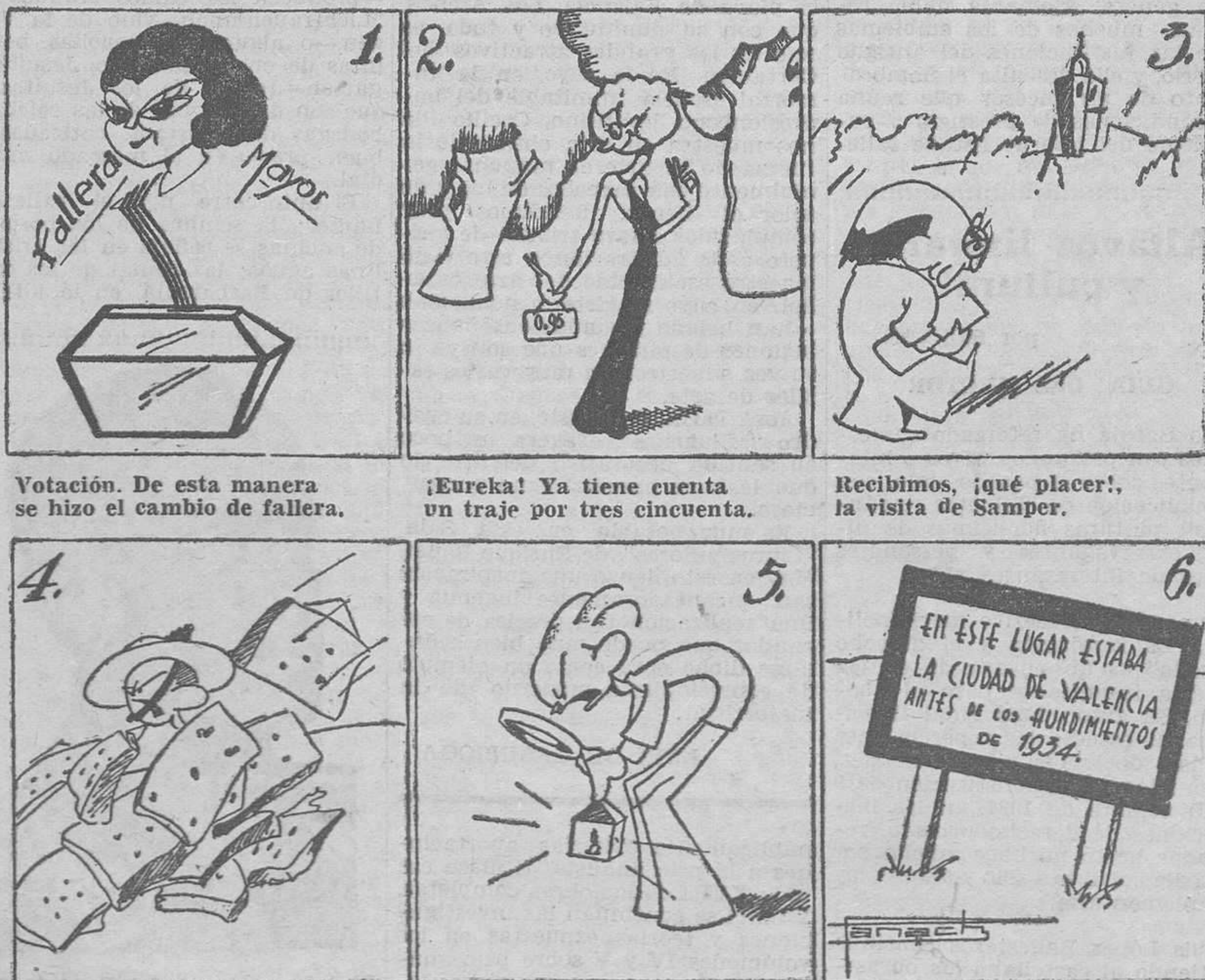
1. Votación. De esta manera se hizo el cambio de fallera.