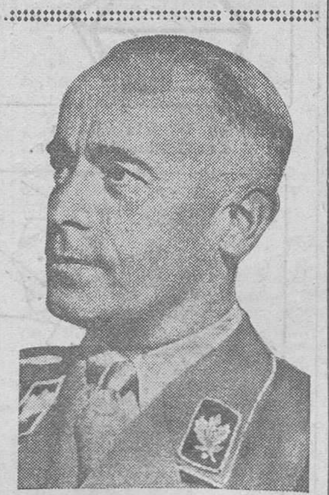
El jefe nacional del Deporte alemán, Hans V. Tschammer und Osten, bajo cuya dirección se prepara la Olimpiada de 1936, en Berlín.

El auto corre por el valle del Lauter; la sombra de los bosques de encinas se refleja en las cristalinas aguas; las ruinas de los castillos de Barbarroja, en lo alto, y