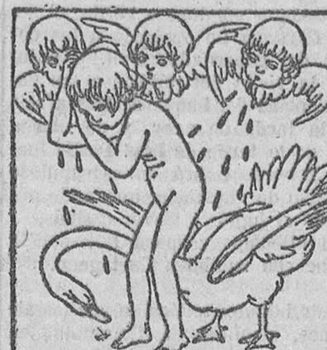
Marzo, ya crecido el año, recibe las lluvias de los cielos rosados, tras las nieves hoscas.