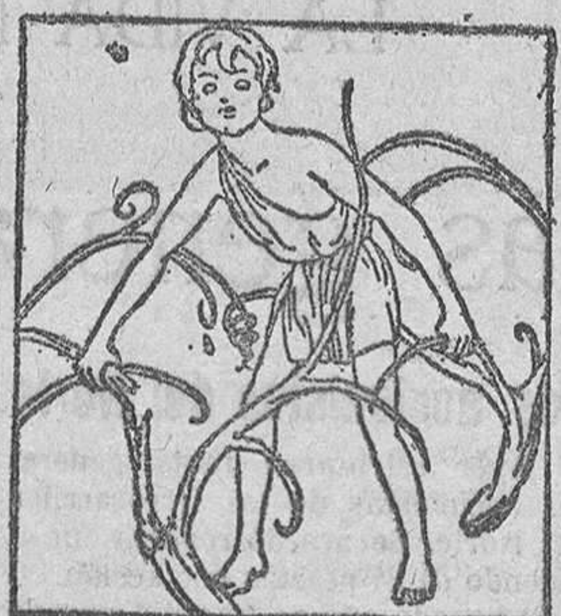
Abril ya correteaba entre los viñedos, acabados de podar para los nuevos retoños.