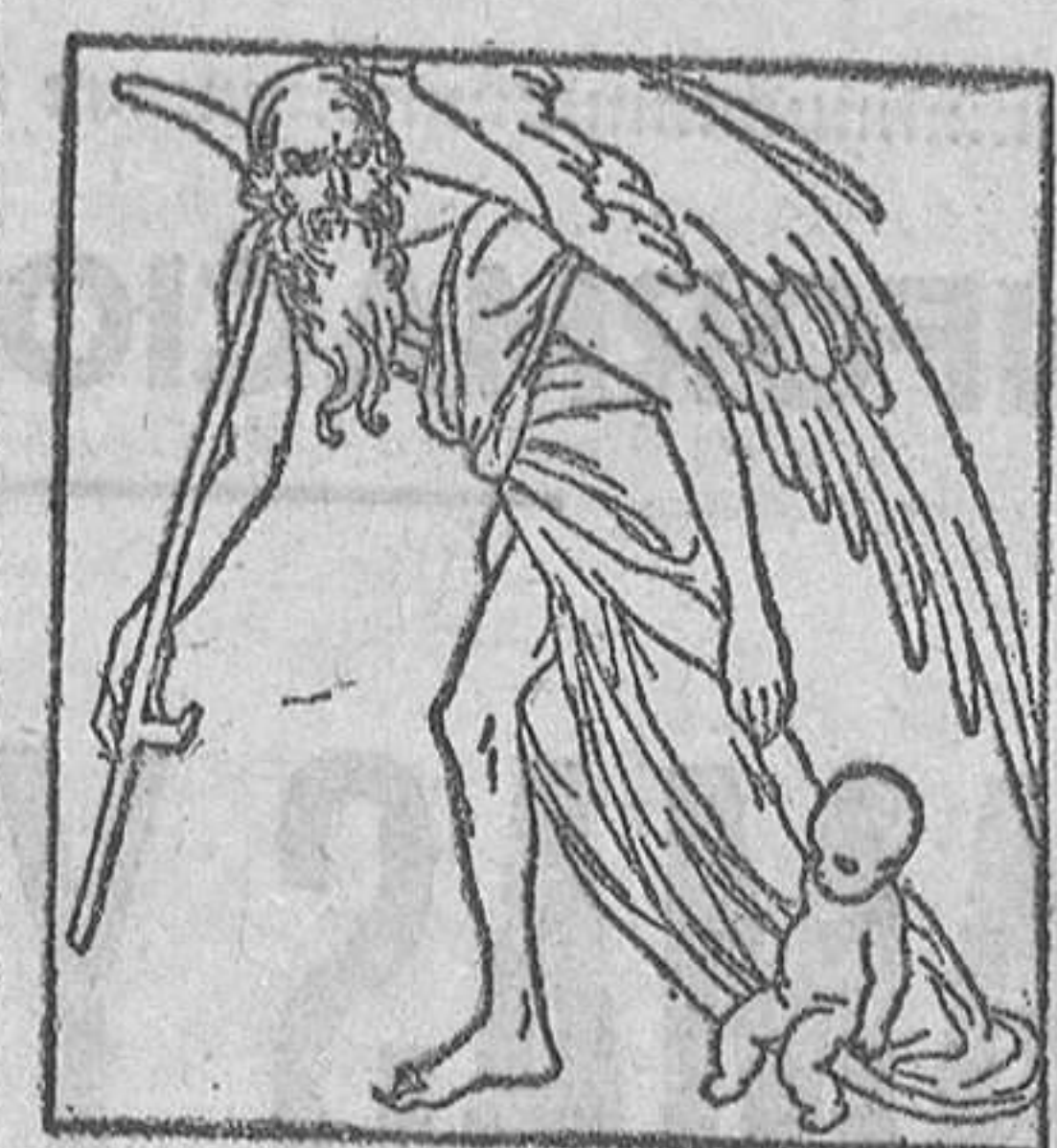
Enero es como la infancia del Año Nuevo, al que trajó de la mano el anciano Tiempo.