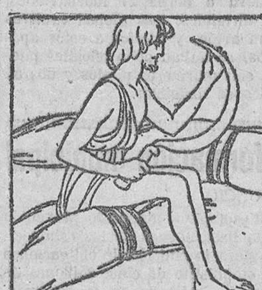
Junio es el año en la mitad de su vida, en la siega de las mieses.