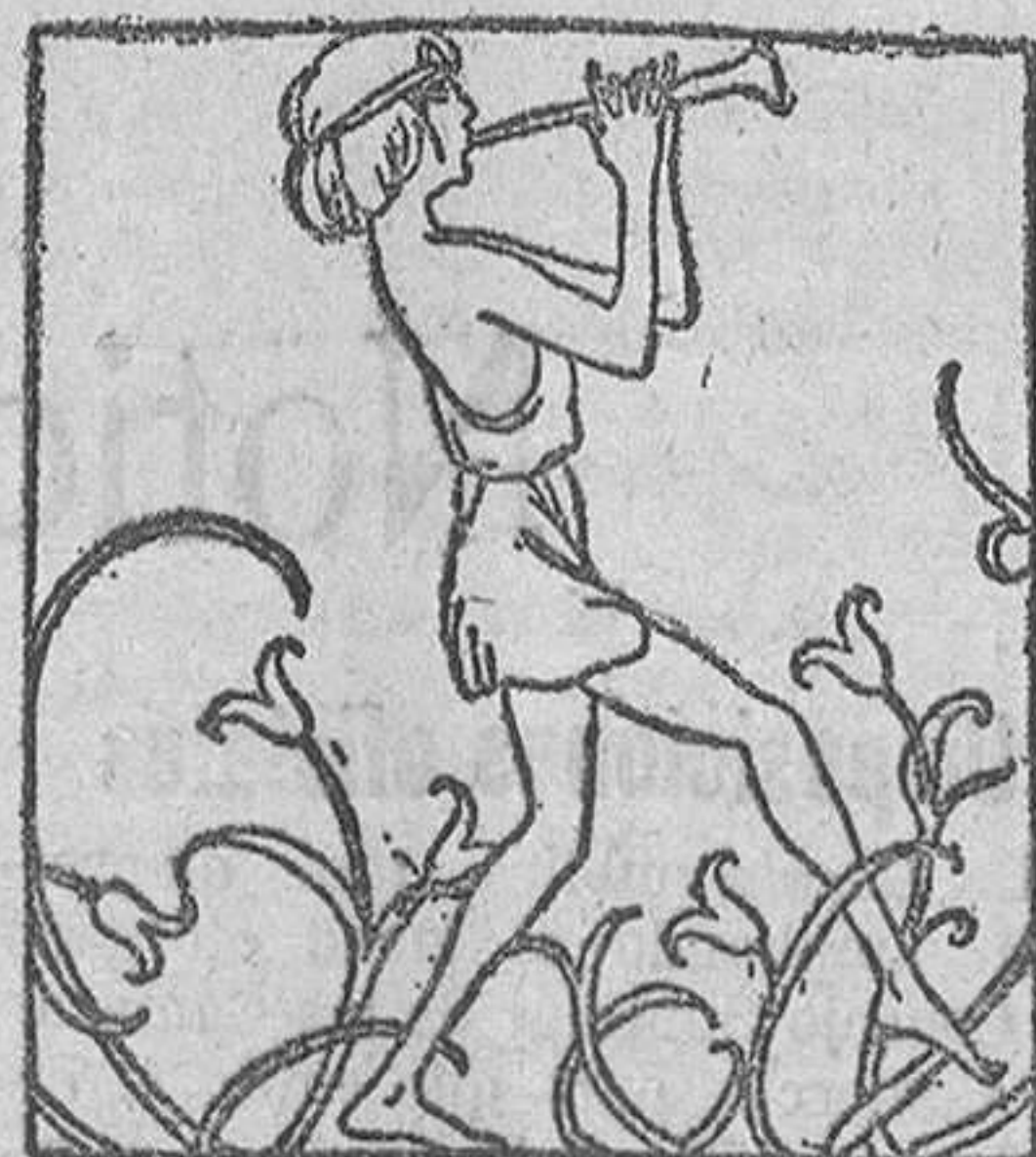
Mayo es un adolescente que tañe la flauta entre las flores abiertas.