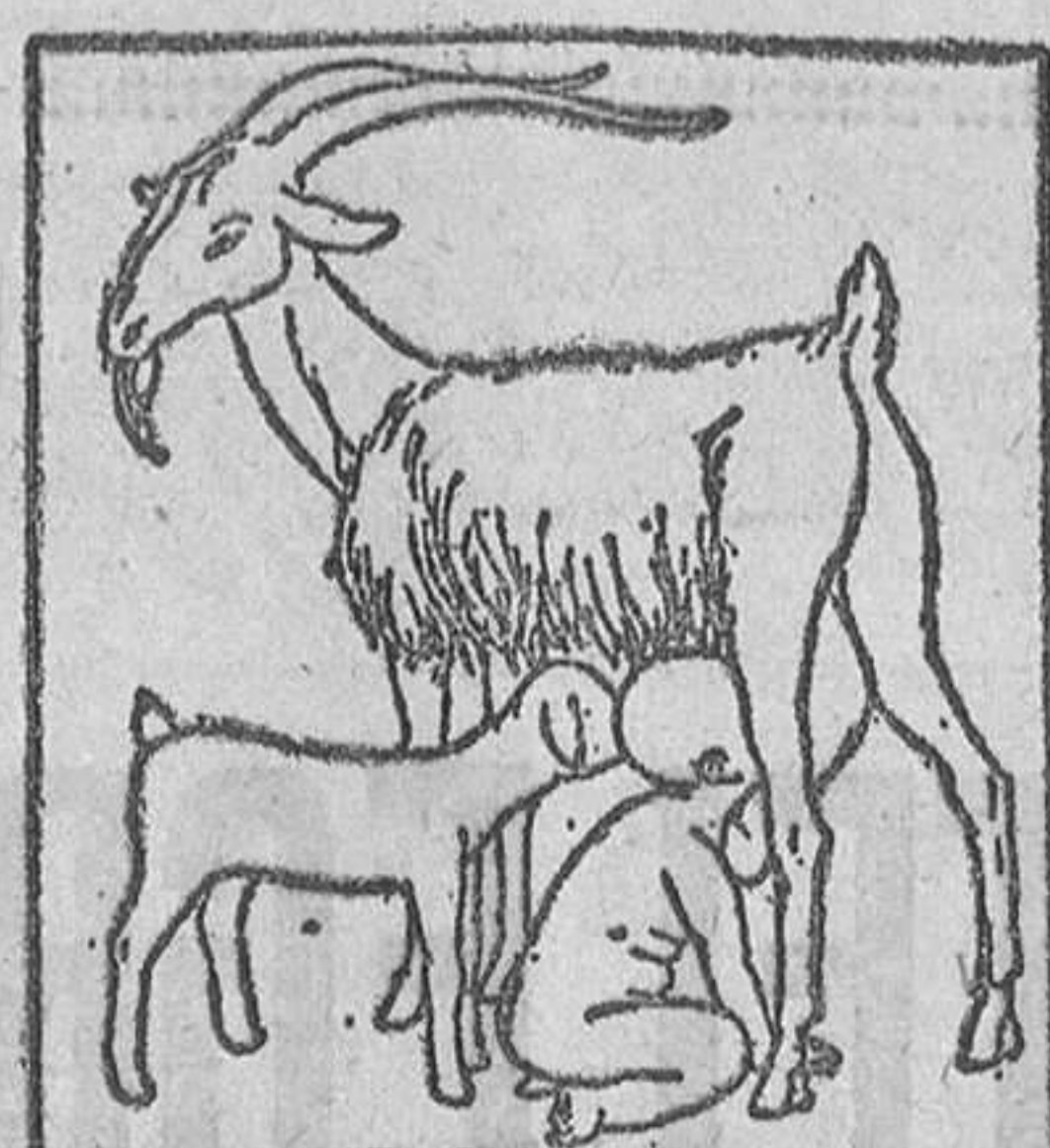
Febrero es como un niño que todavía está en la lactancia y apenas si hace pintitos.