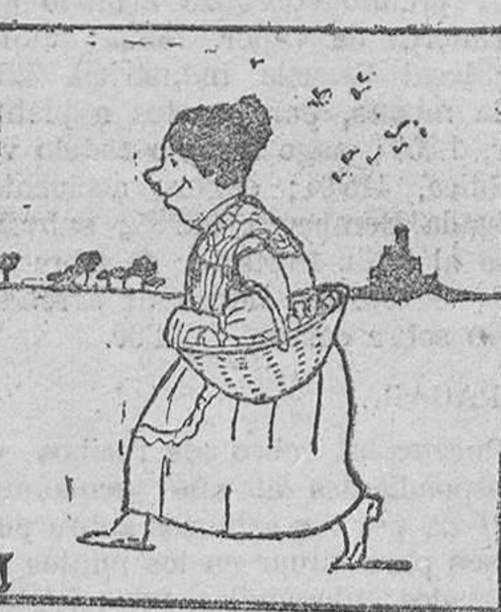
La tía Ramona va al mercado con su cesta de huevos frescos para vender.