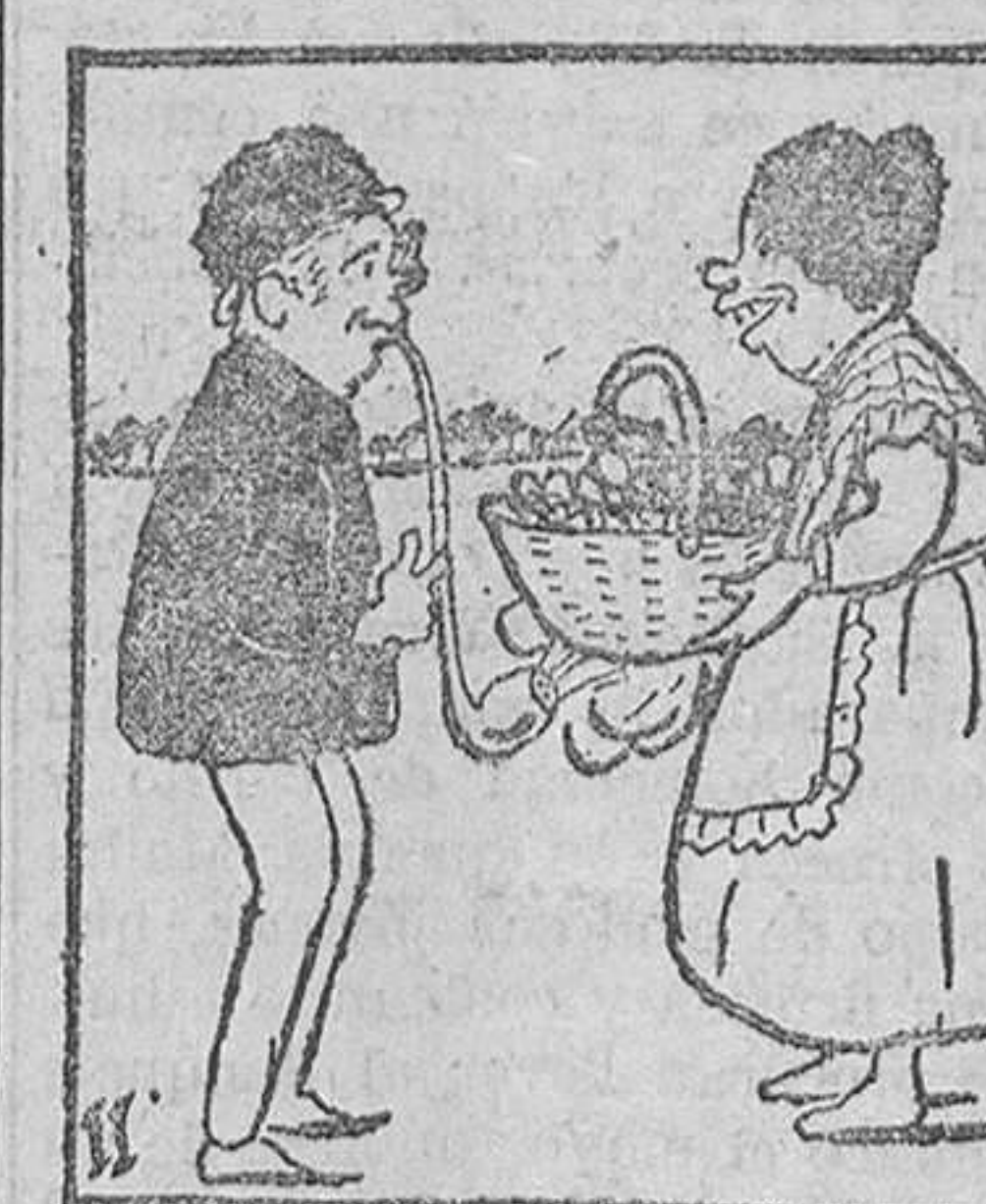
Cuando se encuentra con su compañero Filemón y su inseparable pipa. Como los dos tienen mucho que decirse