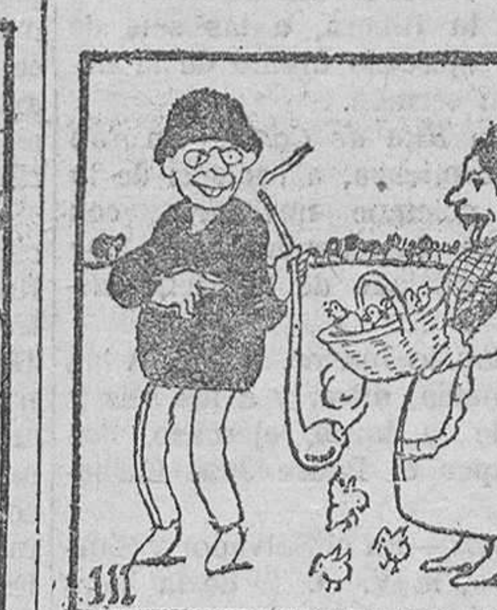
hablan y hablan y hablan; en tanto, el calorito de la pipa incuba los huevos, y surge triunfal de la cesta toda una manada de pollitos.