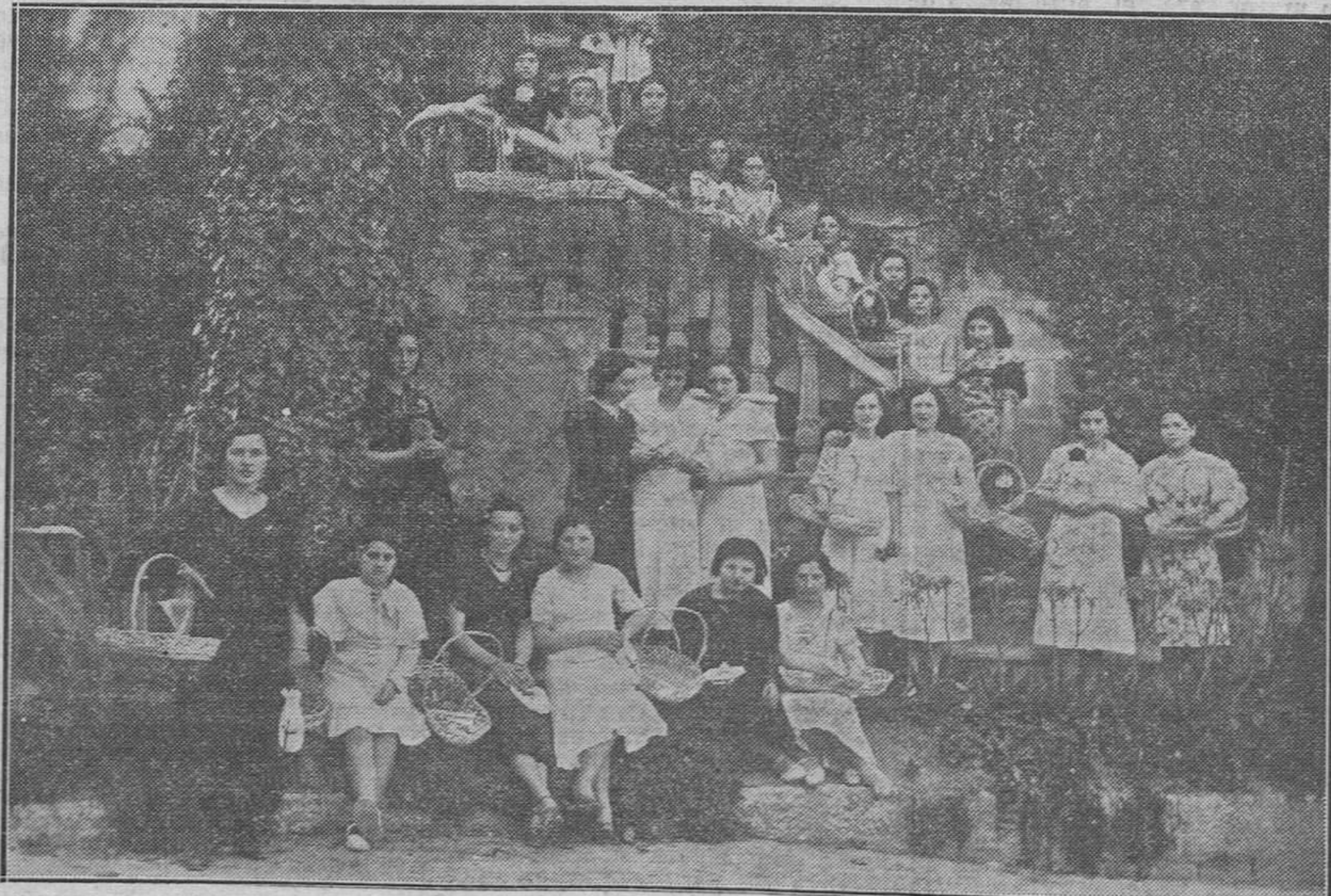
Játiva.—Señoritas que postularon el domingo para la Cruz Roja, en la Fiesta de la Flor.

Resulta, puix, que Catalunya tots els anys disposa de una nombrosa cantitat de premis de entitats oficials uns, i de corporacions i de particulars atres, que permetixen estimular totes les virtuts que fan grans als pobles, ja que no's limi-