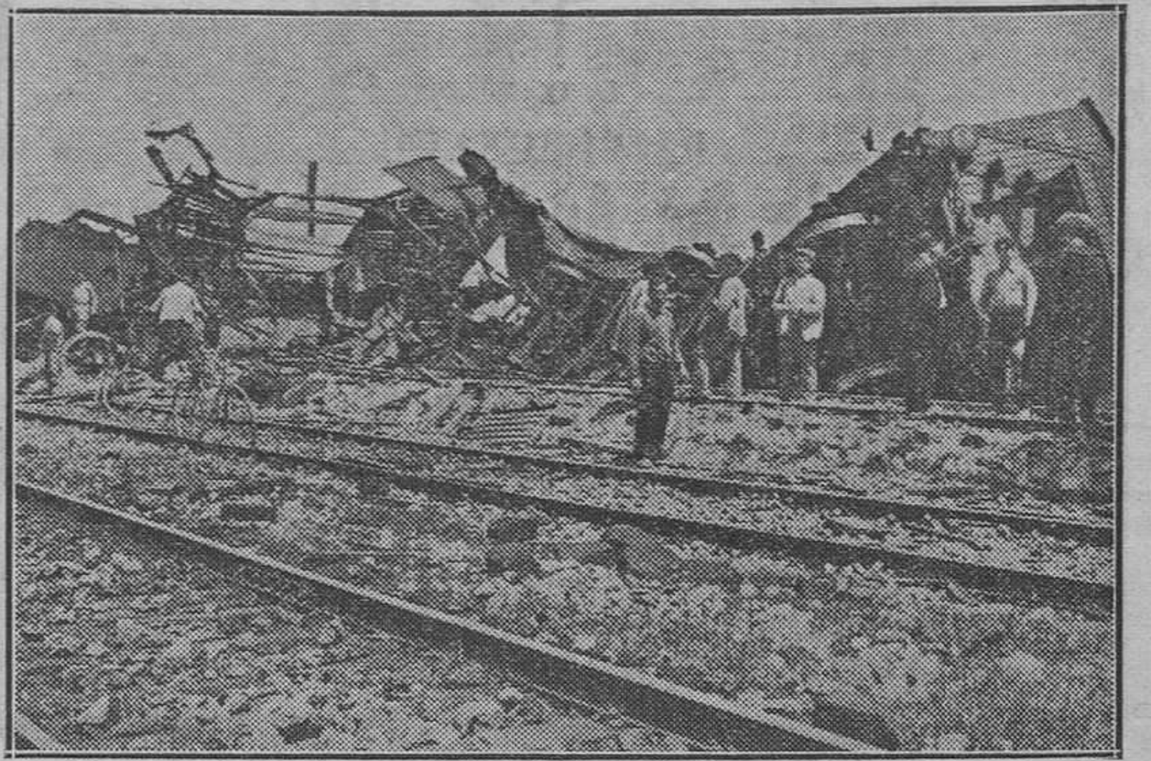
Estado en que quedaron los vagones destrozados por el rápido.

20'30: Crónicas del régimen. 20'45: Concierto variado. 23: Periódico hablado. Cierre de la Estación.