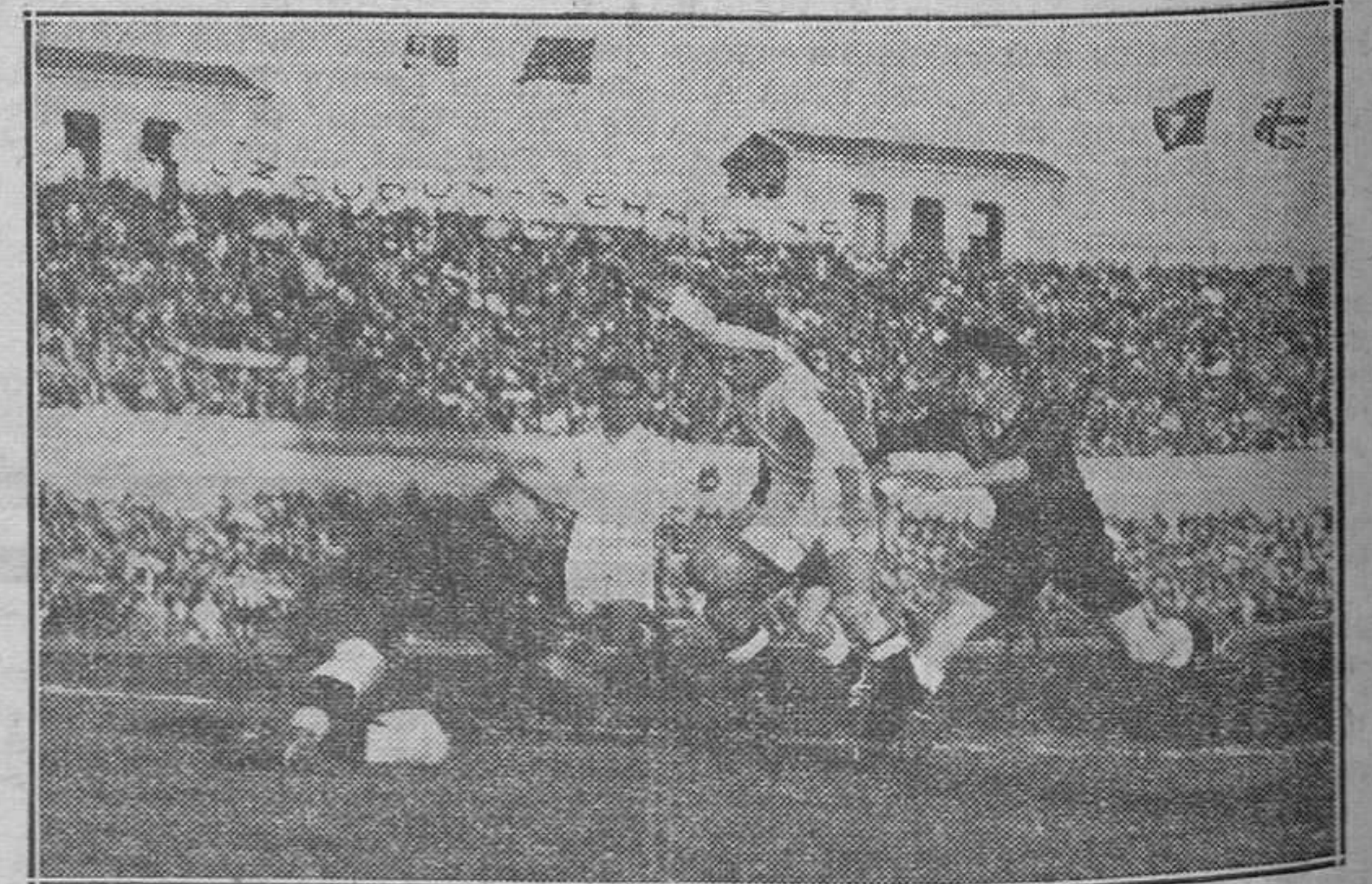
El duelo Vilanova contra Zamora-Ciriaco-Quincoces. El Chiquet entra con coraje para impedir que Zamora recoja la pelota y despeje