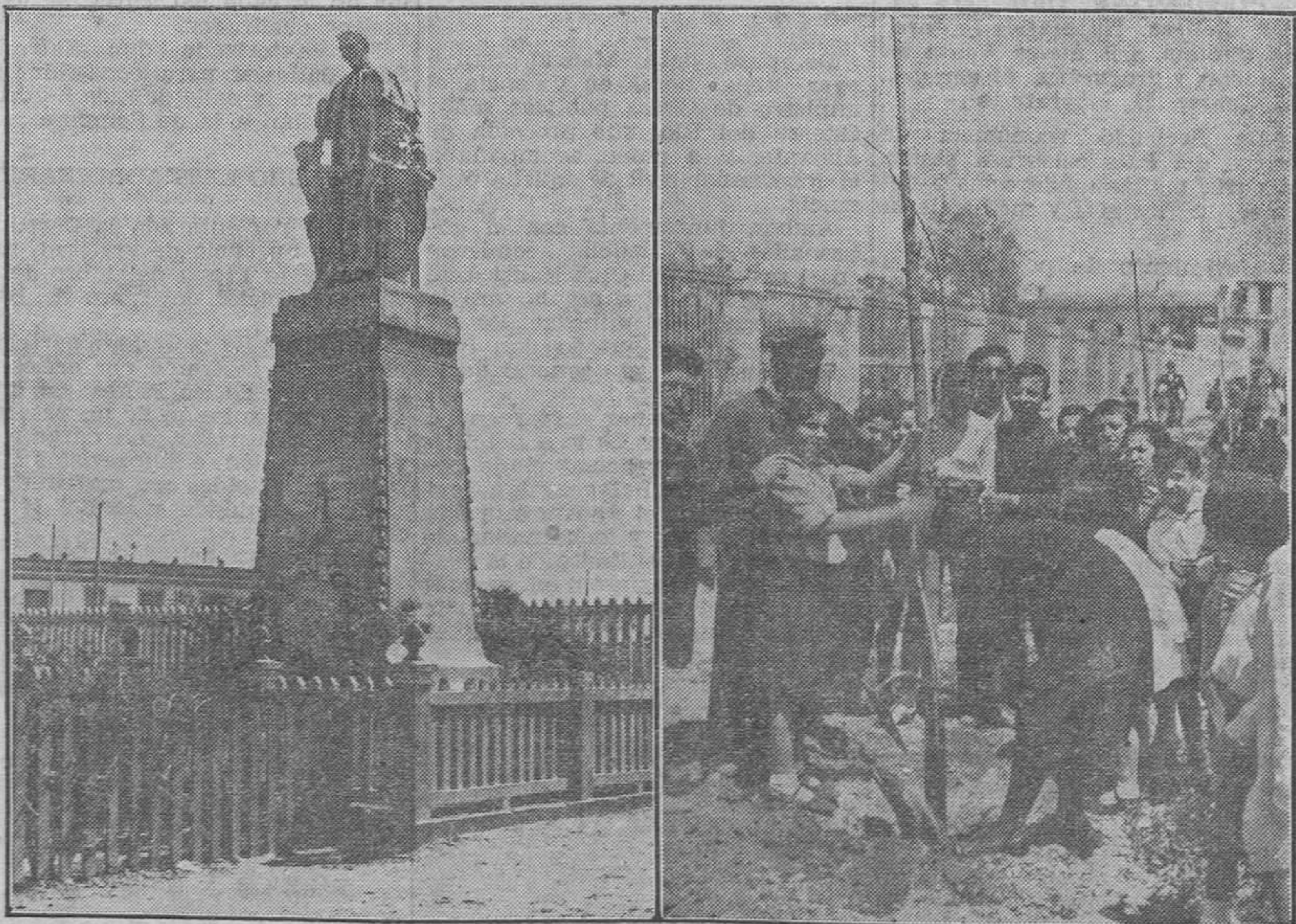
Monumento a San Juan Bosco, erigido en el patio de las Escuelas Salesianas.—La Fiesta del Arbol en Valencia.