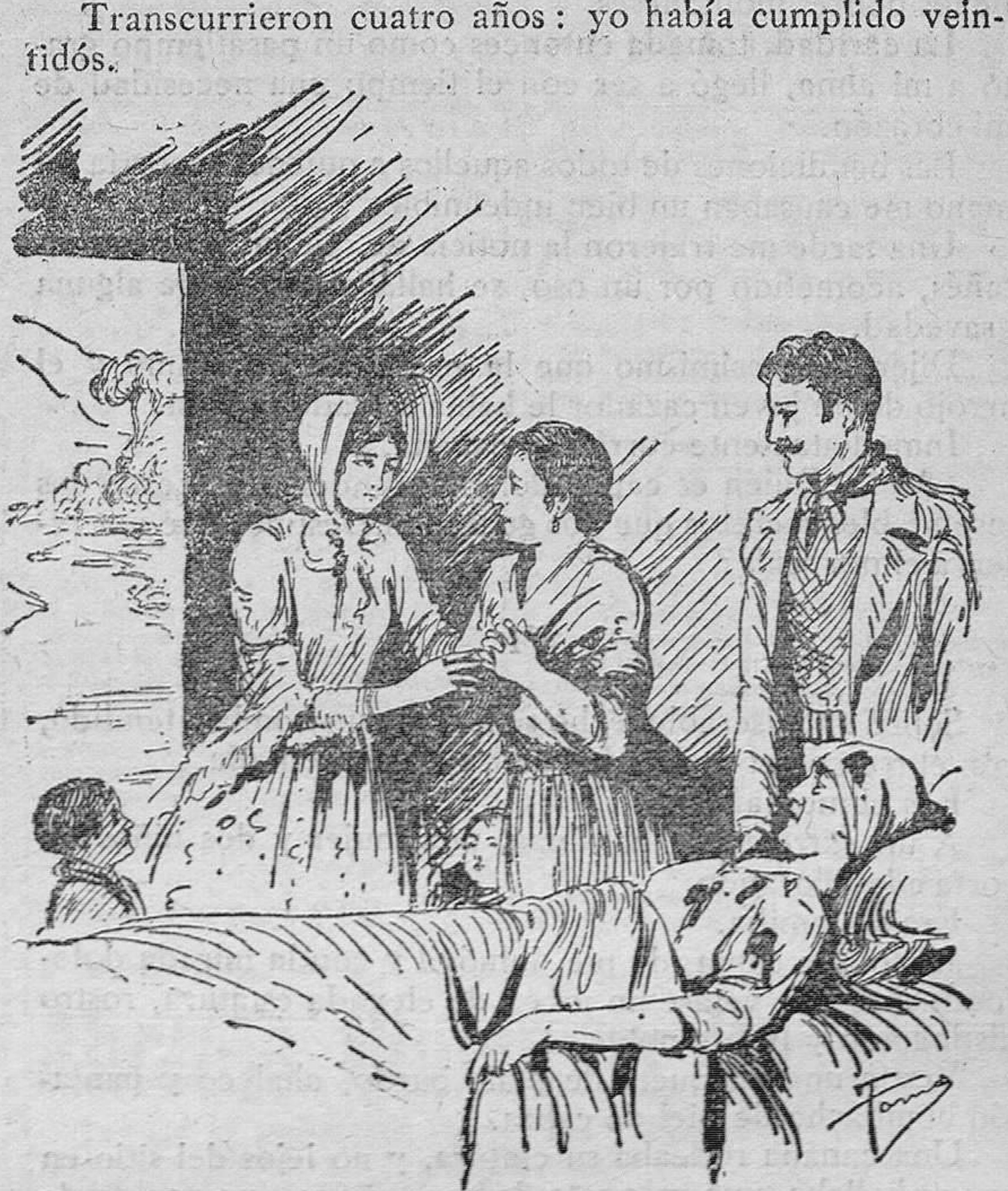
Sobre un miserable lecho se hallaba un hombre tendido

Transcurrieron cuatro años: yo había cumplido veintidós.