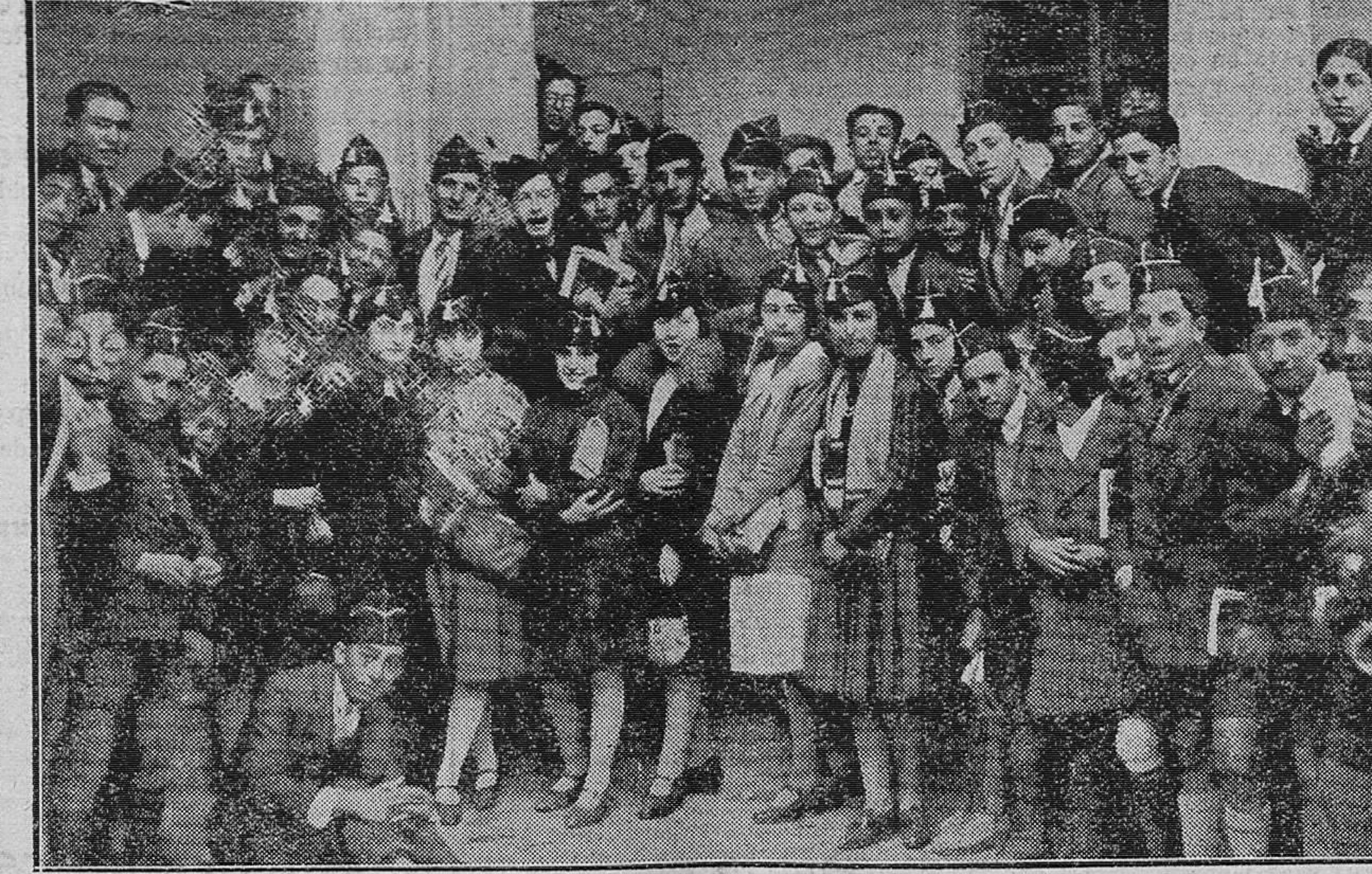
Grupo de estudiantes llevando los gorritos adoptados como distintivo estudiantil.

Para comprender esta orientación de gran parte de los católicos alemanes, hemos de decir que los socialistas son muy moderados en el Reich. El primer presidente del Reich fue un ex obrero y prohombre socialista, Fritz Ebert, y cuando el mariscal Hindenburg ocupó su puesto, rindió homenaje a la prudencia e imparcialidad de su predecesor. Asimismo, desde hace varios años, el primer ministro de Prusia es el leader socialista Braun, y el presidente Hindenburg (que es todo, menos un hombre de las izquierdas) ha expresado varias veces su satisfacción del modo de que el Gabinete Braun administra a Prusia.