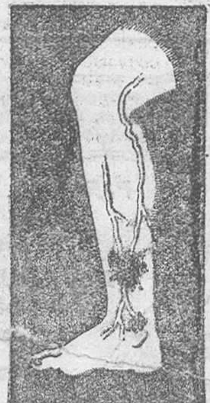
ESLENA CON VARICES

Enviamos made os (sin gastos) a quien lo solicite, dentro y fuera de la capital. Confección esmerada, precios económicos. Hernández, Correjería, 21, entresuelo. Valencia.