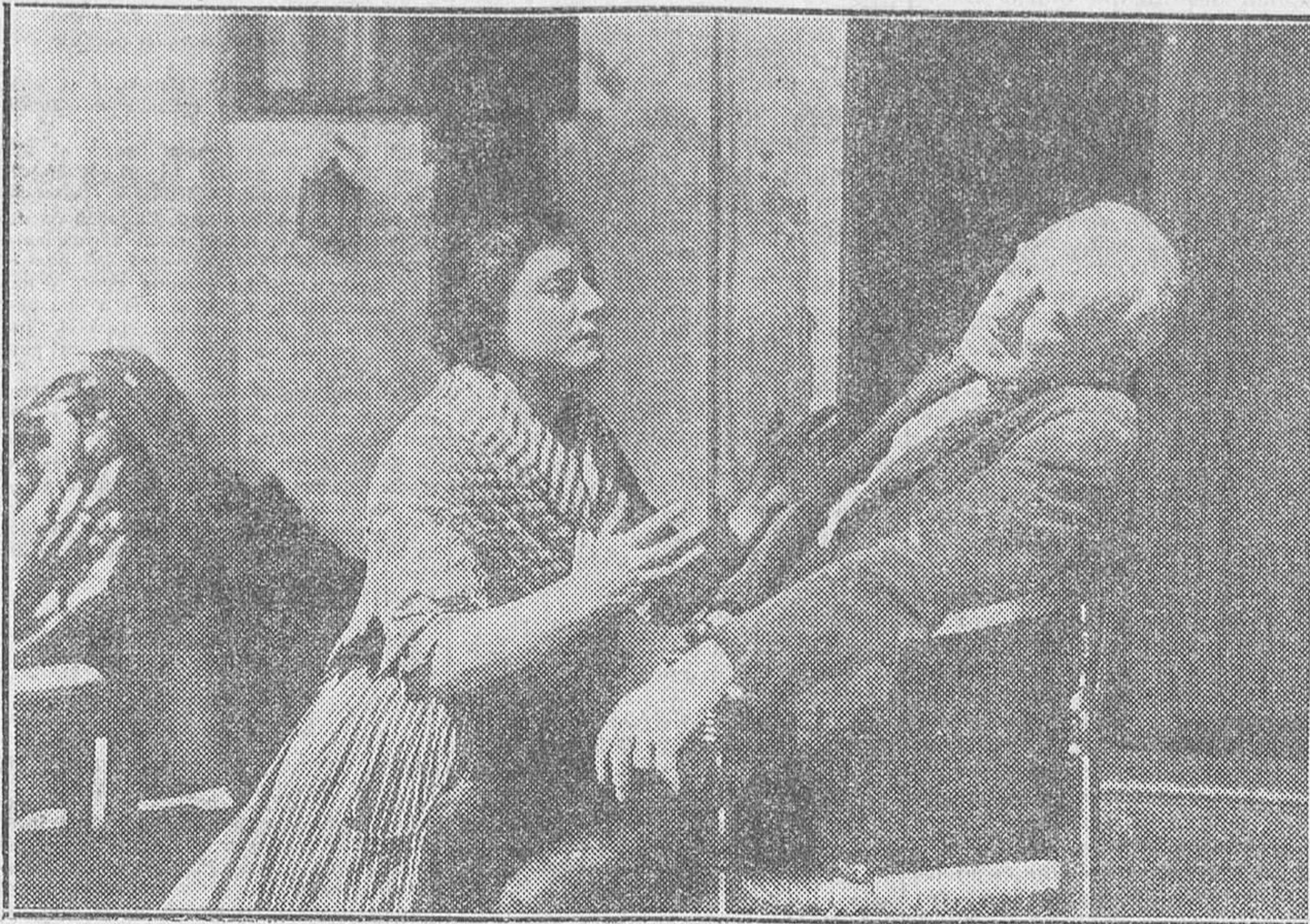
«ROSA DE LEVANTE»: Exaltación de la tierra levantina junto al mar azul; perfume de la poesía; un amor sublimado por la castidad y el sacrificio, que hace retornar arrepentido a aquel que aún en el pecado no logró manchar la pureza de «Tonela la Pescadora». Trozos de vida de la gente del Mediterráneo; hombres de bronce y de alma brava; raza de luchadores de los elementos y conquistadores de los tesoros que el mar Latino encierra: todo esto es la película que Levantina Films ha editado, y que la Casa Gaumont ha adquirido para sus selecciones «Diamante Azul»