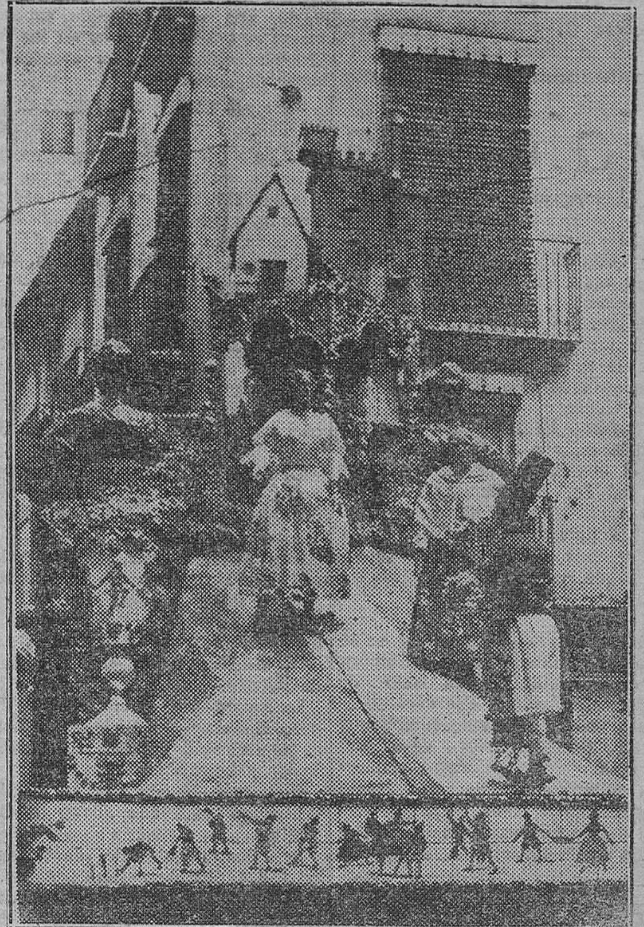
Un casamiento en que todos salen engañados. Instiada en la plaza de Calatrava.

monasterio de Santarem, y después se trasladó a éste de Santa Clara. Hasta 1649 fué habitado este convento, y construyó entonces un nuevo edificio don Juan IV, en la parte Sur de Coimbra, a donde se trasladó la Comunidad.