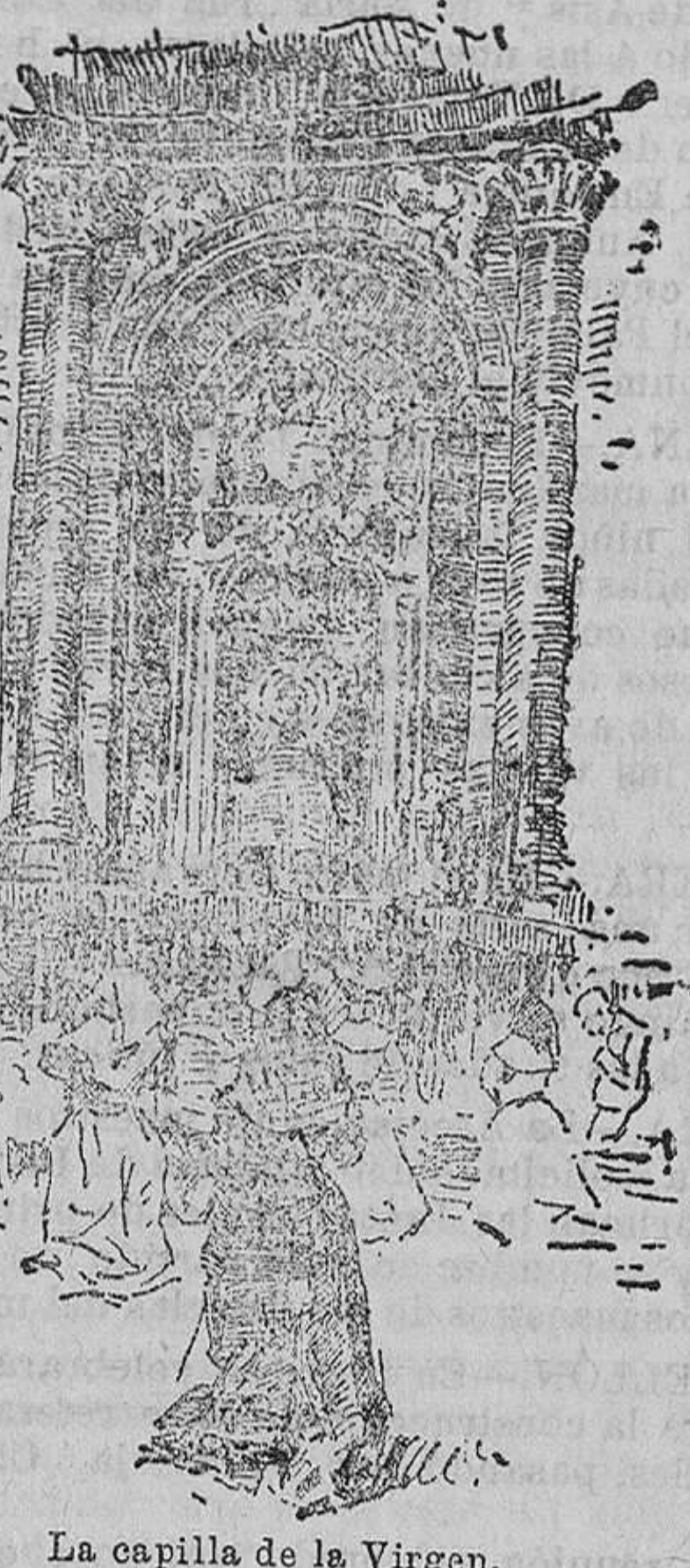
La capilla de la Virgen.