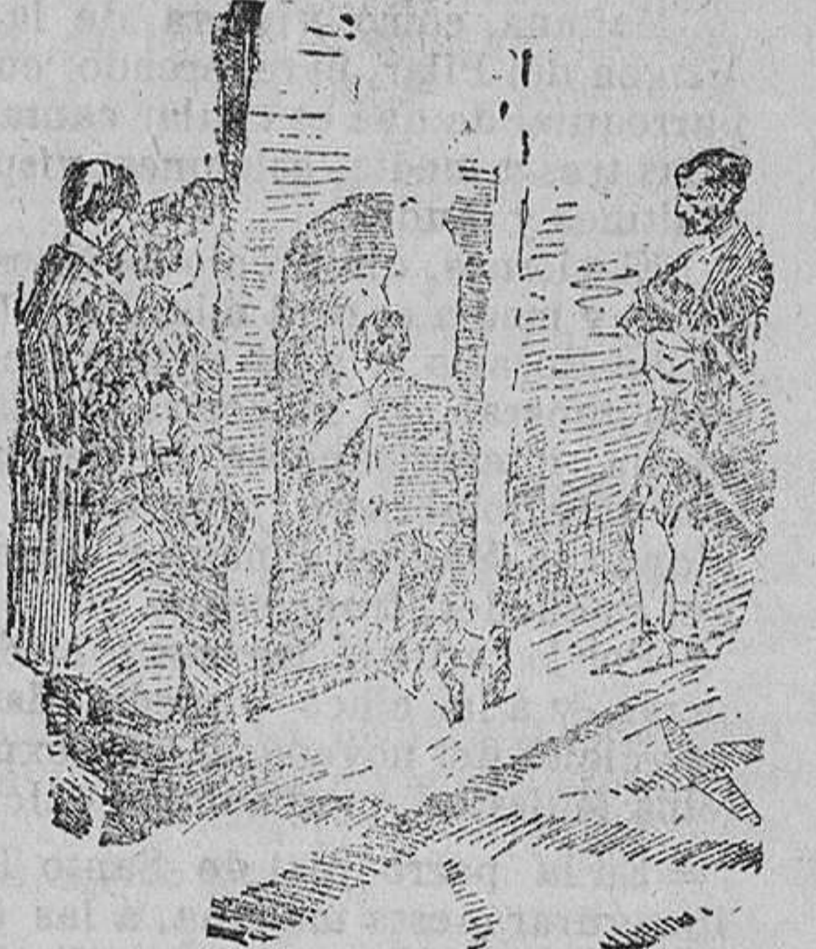
Aorando el Pilar.