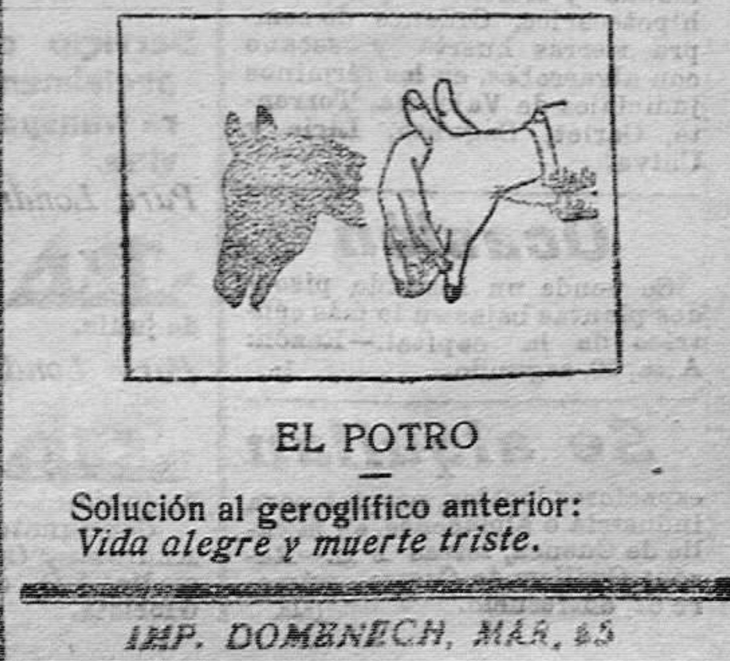
EL POTRO Solución al geroglífico anterior: Vida alegre y muerte triste.