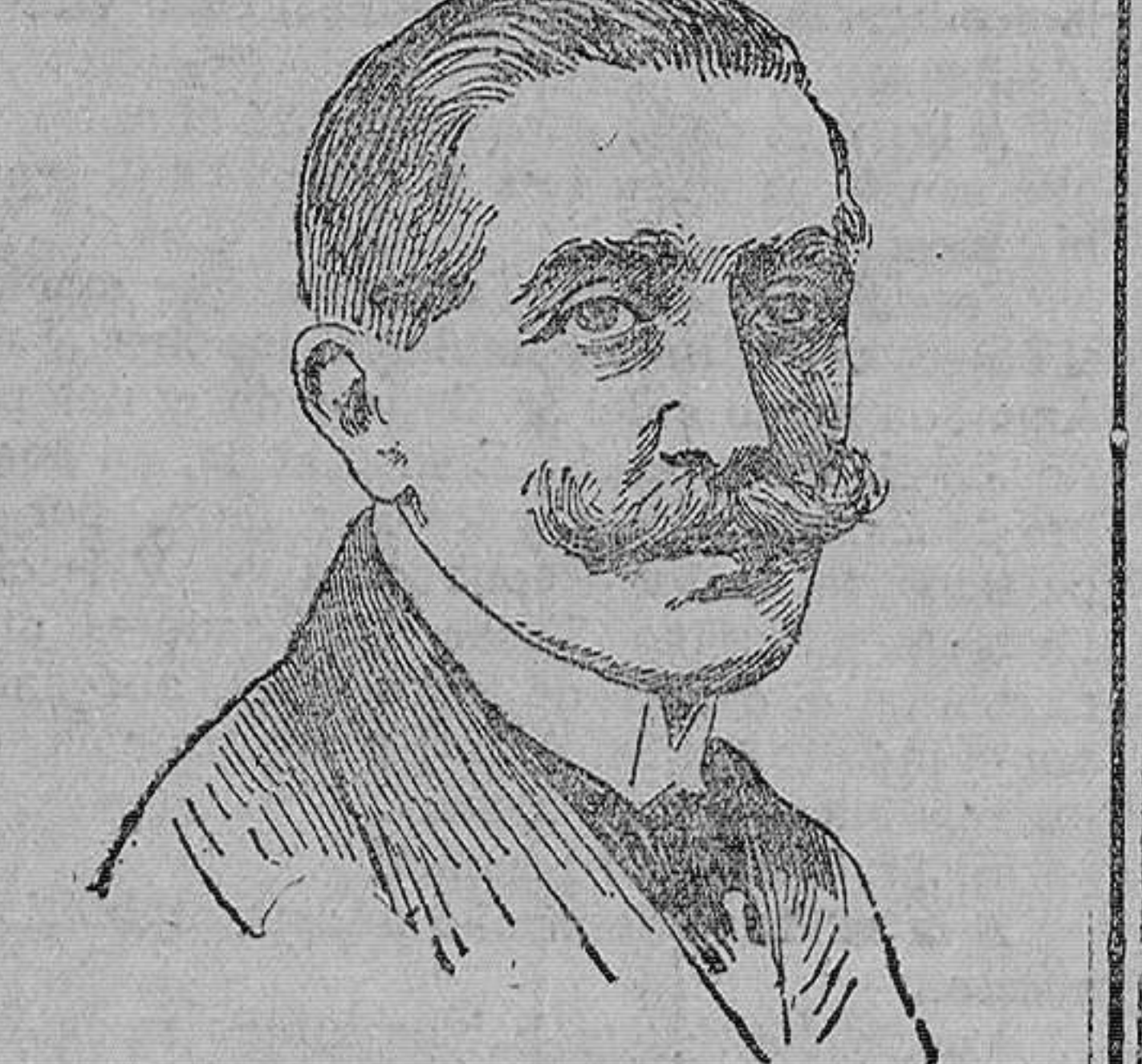
PAUL HERVIEU, autor del drama «Le destin est maître», escrito para María Guerrero y Fernand Díaz de Mendoza, y traducido por Jacinto Benavente.

Una de las lanchas consiguió llegar al costado del barco y el capitán del mismo dispuso que se embarcase en ella un cable para llevarlo á tierra, pero en tal estado, que ni aun hablar podía en los primeros momentos, prestando-se toda clase de auxilios y siendo asistido por el médico militar del puerto de Río Martín.