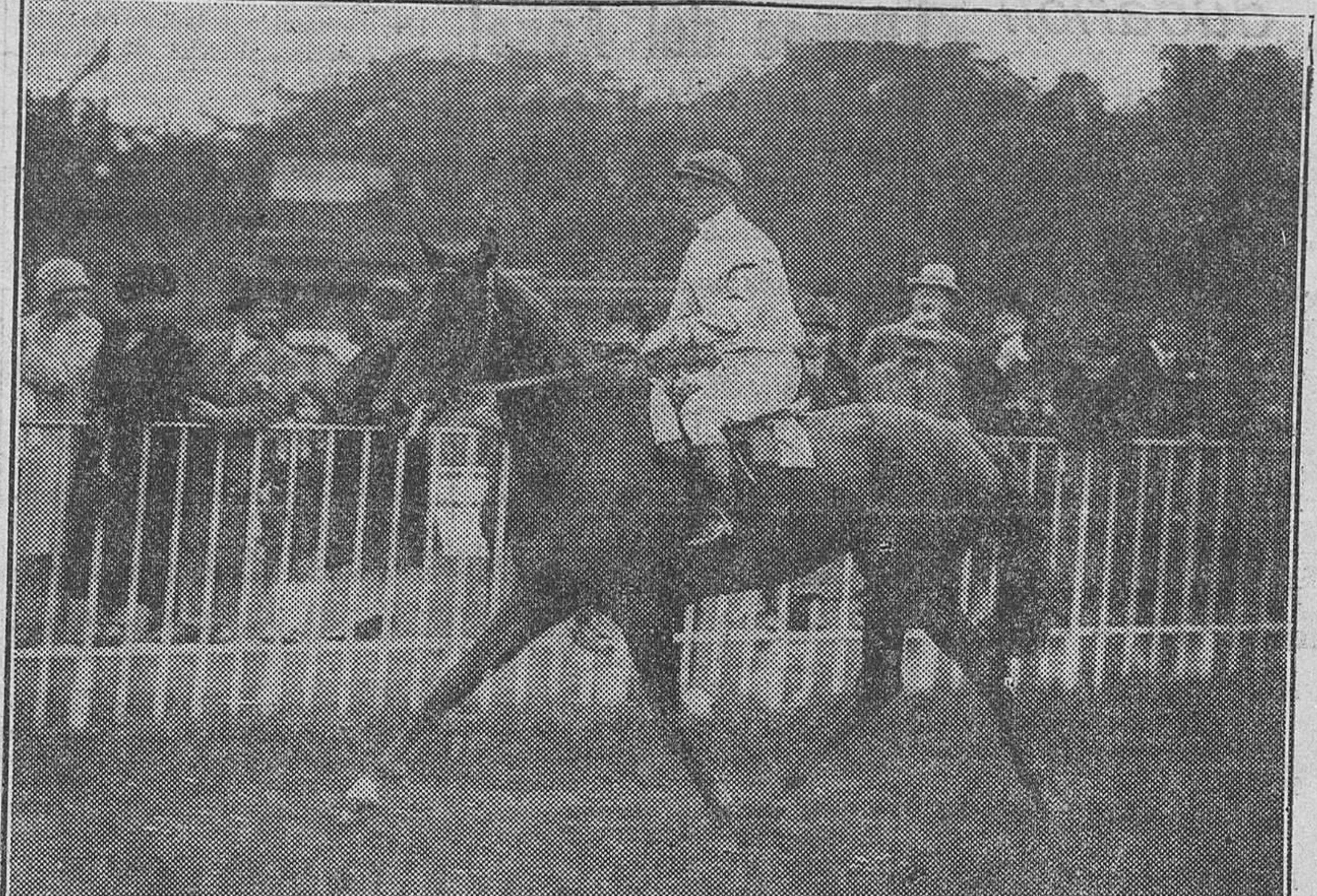
Caballo ganador del primer premio en las grandes carreras celebradas