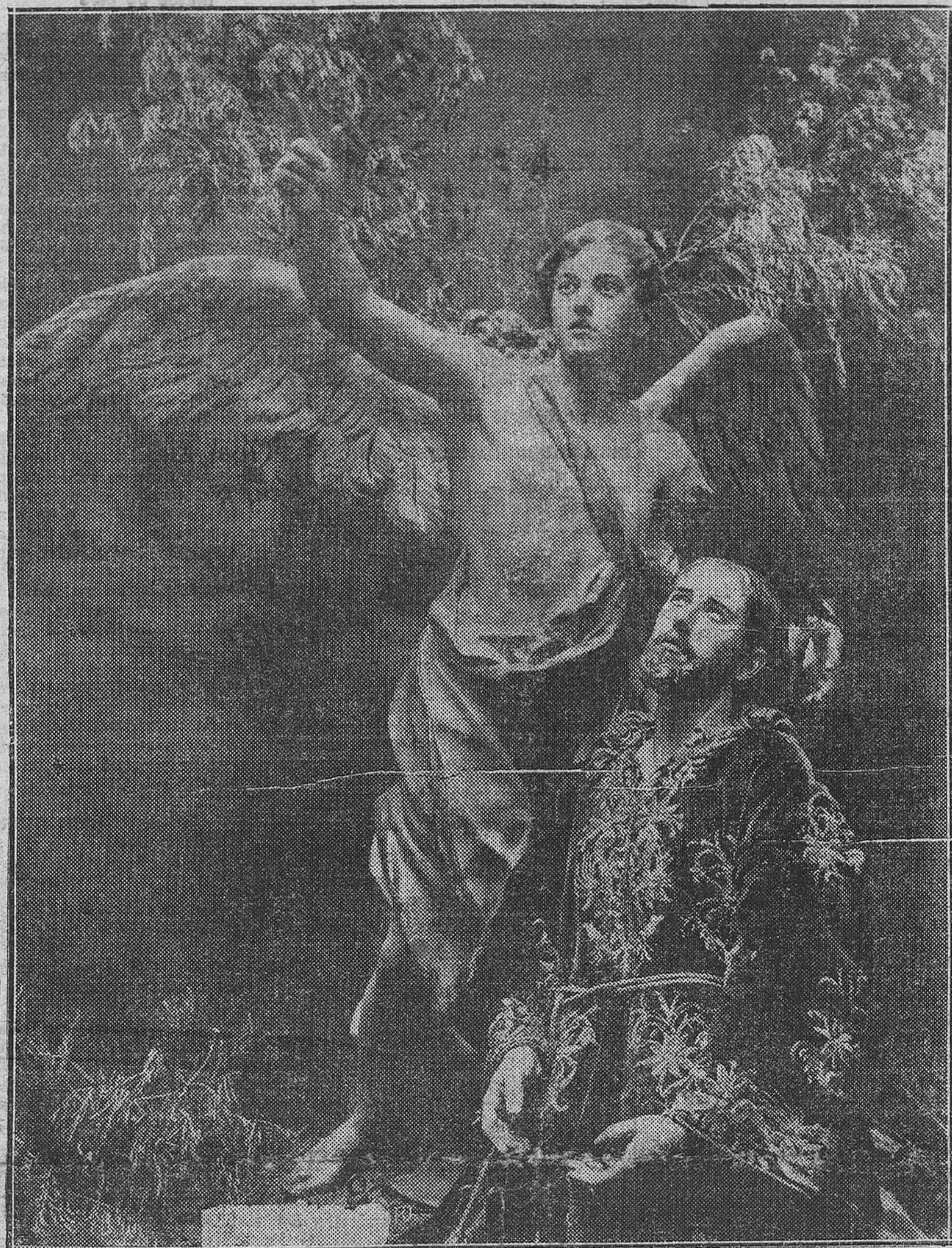
«La oración del huerto», obra maestra del escultor Salzillo

Las armas se llevarán a la fune-rala hasta el toque de Gloria, y los tambores y clarines y trompetas to-