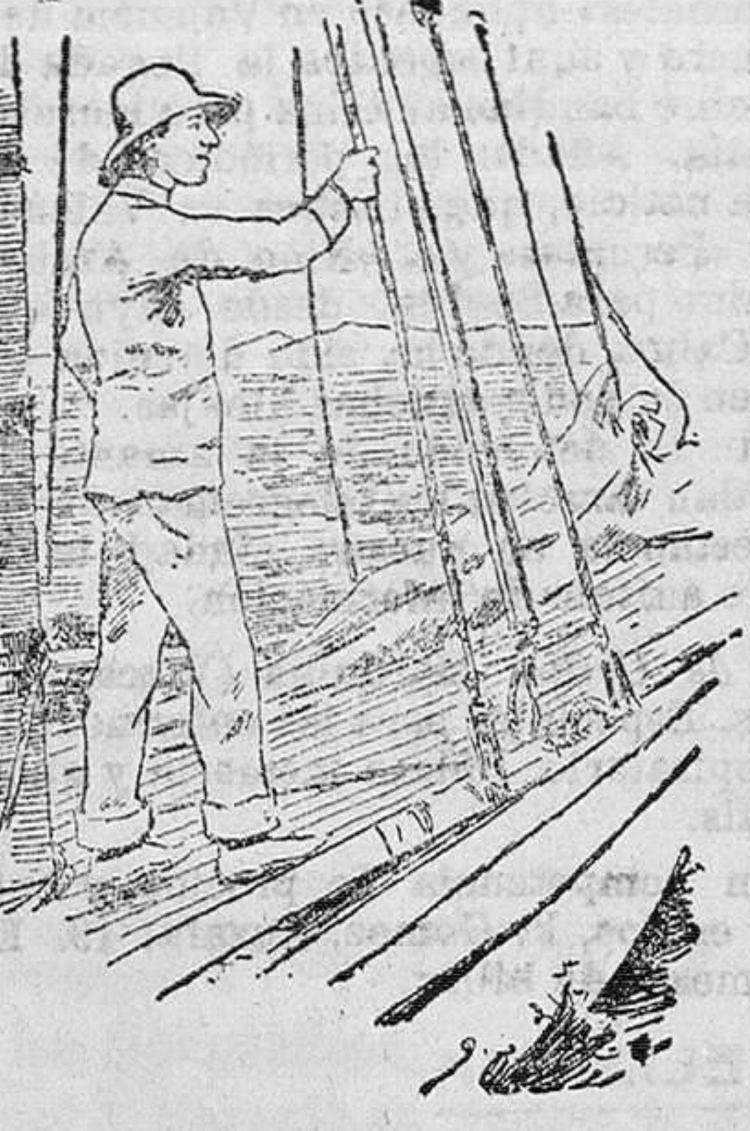
S. M. el rey en el balandro «Dios salve á la reina» momentos antes de embarcar en la regata.

Desde entonces fué creciendo su nombradía. Era mérito saliente en él una sensibilidad exquisita, una penetración muy perspicaz y sutil para profundizar todo lo que afecta á la humanidad.