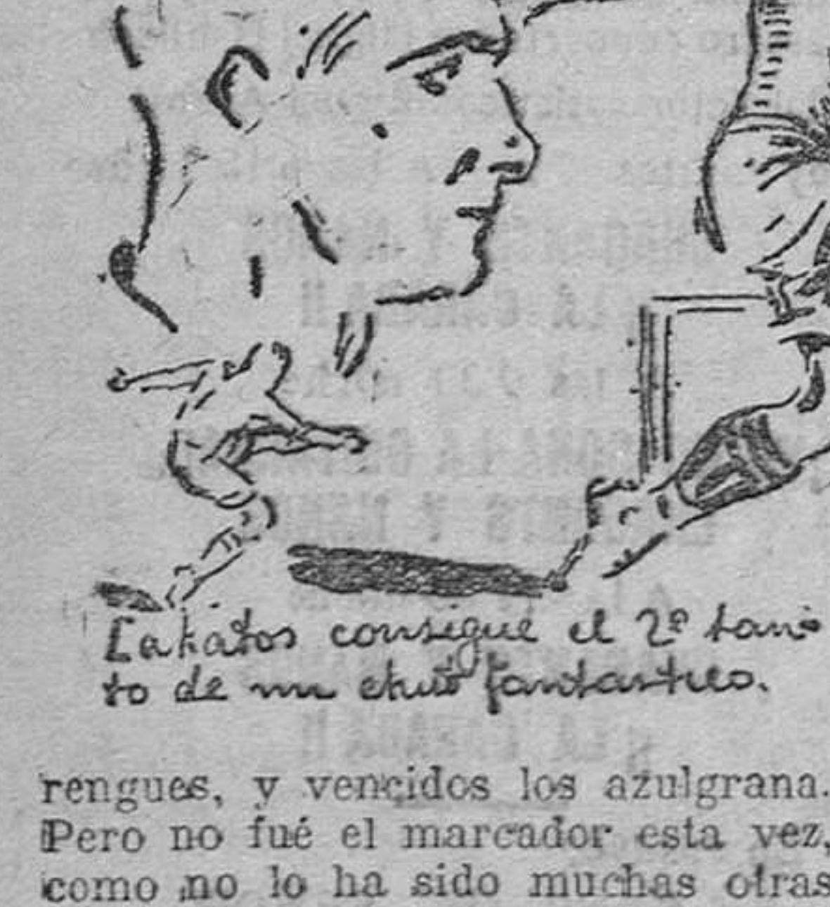
Lakatos consigue el 2º tanto de un club fantástico.

Ya montescos y capuletos, los eternos rivales, dirimieron su lucha, resultando vencedores los me-