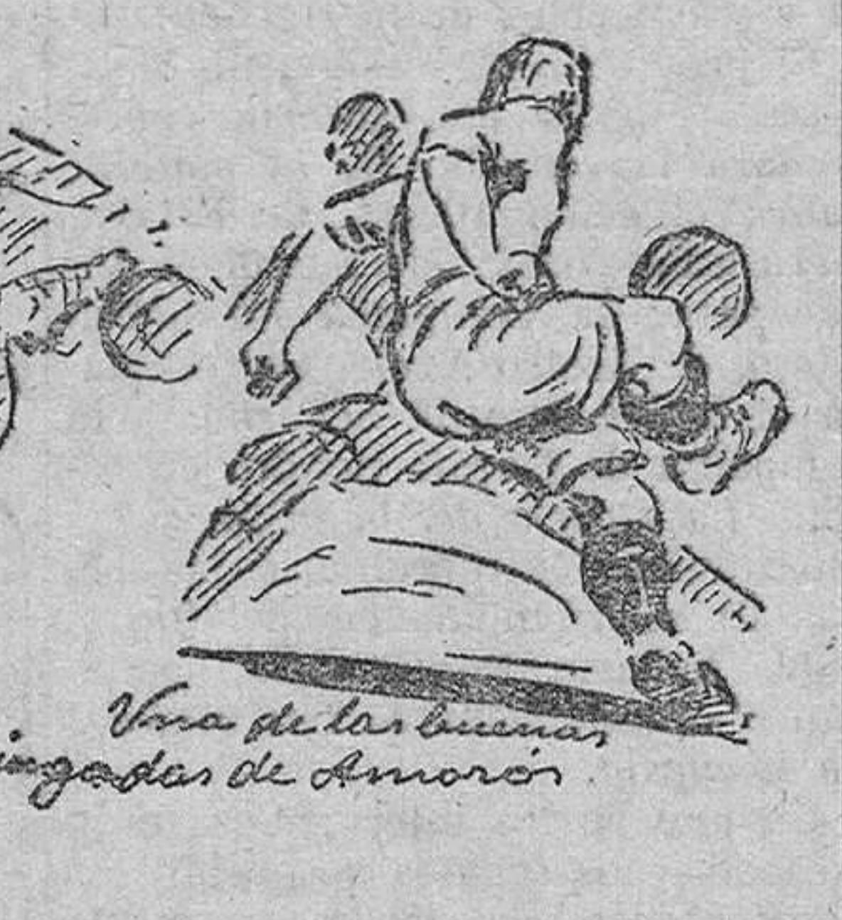
Vista de las buenas jugadas de Amorós

«match» amistoso, la siempre latente especie de su rivalidad ancestral.