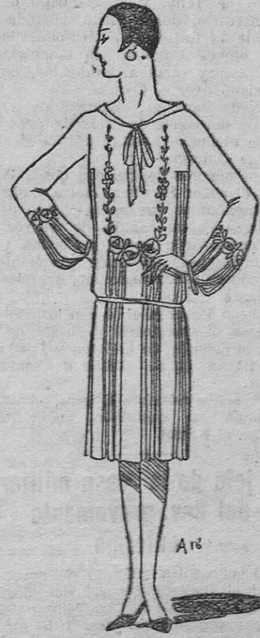
Vestido de crispón de china verde nito ensanchado por grupos de pliegues y ornado de bordado de color