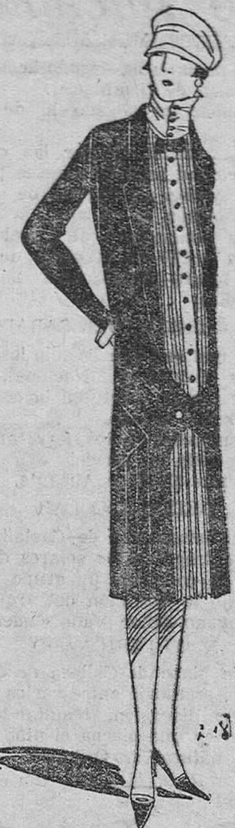
Abriego de tafetán negro sobre vestido de crispón plisado color pastelado