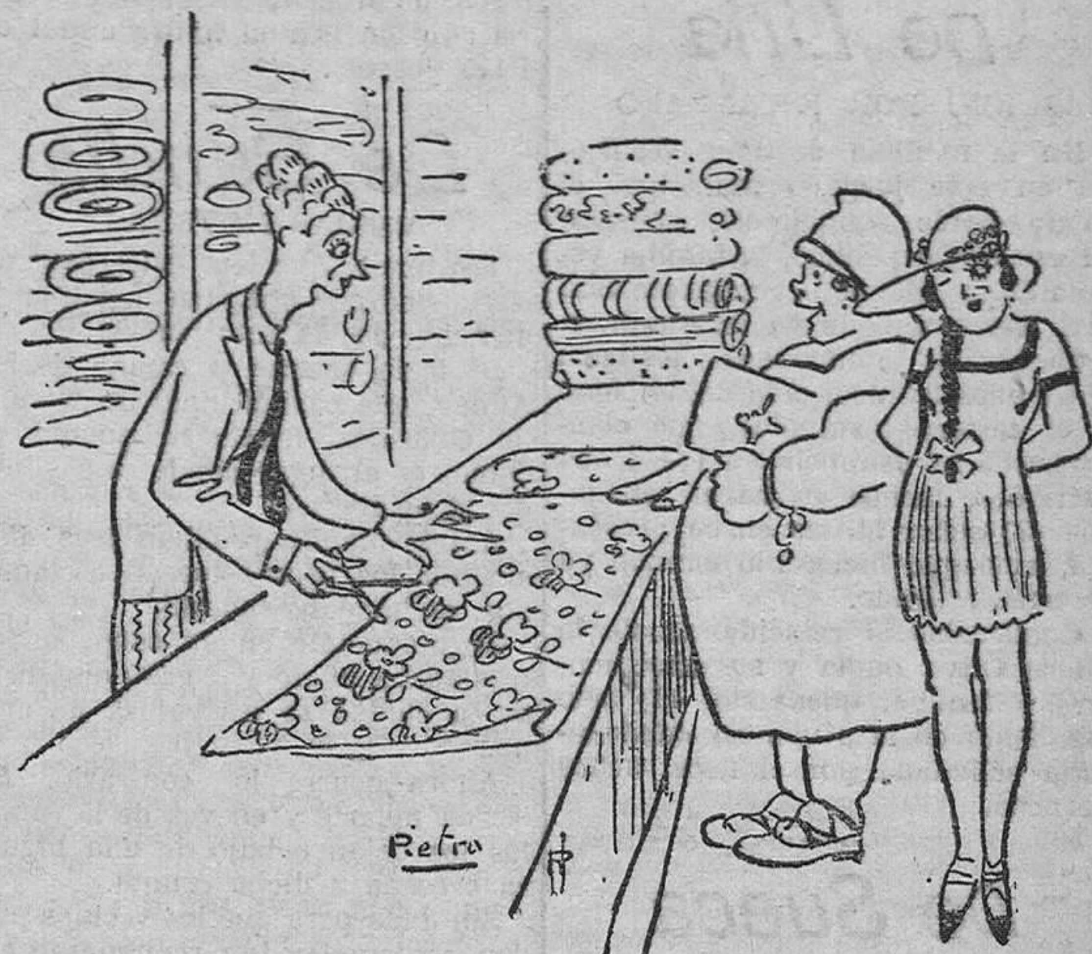
«¿Qué corto, señora? —Aquí está la niña, ¡Vd. verá! —¿Todavía más?»