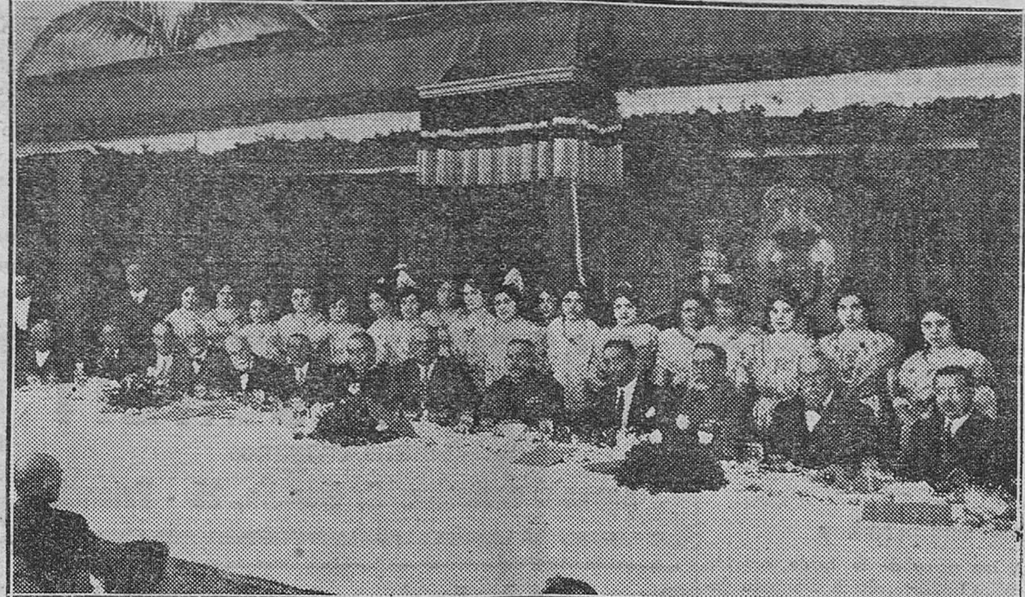
Dos bellas representantes de cada uno de los pueblos del distrito de Carlet, ataviadas con el típico traje, saludan a Primo de Rivera y a las autoridades valencianas

CHAMPAGNE VEUVE CLICQUOT PONSARDIN REIMS Fiel a su tradición secular, esta Casa sirve siempre los deliciosos vinos de sus afamados viñedos de la Champagne