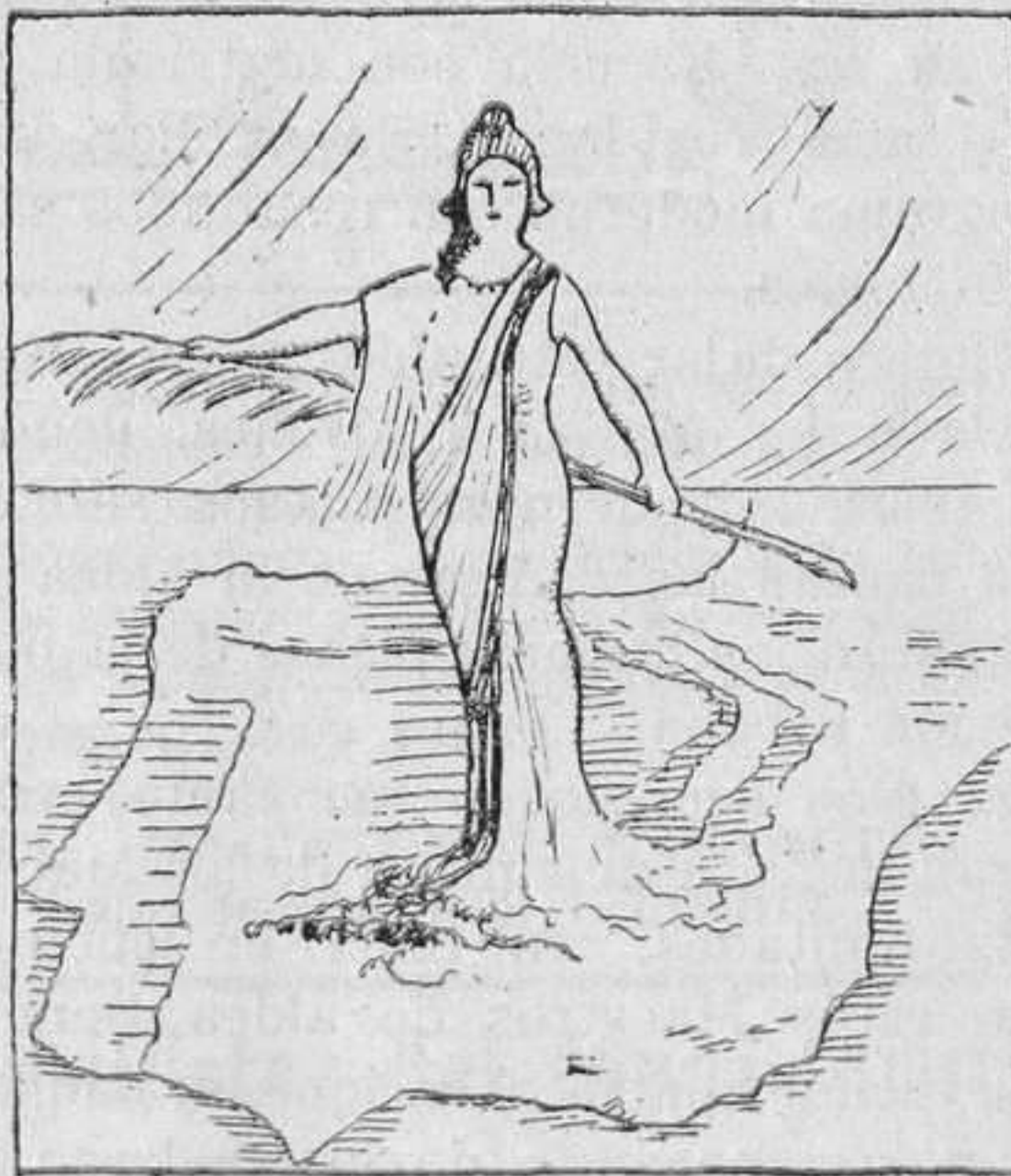
Nueva alegoría de la República, magníficamente impresa en once colores, tamaño 70 x 100. Siete pesetas.

Por cierto que según nos comunican se va a dar algún caso pintoresco de cursillistas destinados a hacer las prácticas en Escuela desempeñada por un interino o interina, que también hizo el primer ejercicio del Cursillo y resultó suspenso en él. ¿Y ha de ser ahora juez en cierto modo de las prácticas que hagan los que triunfaron?