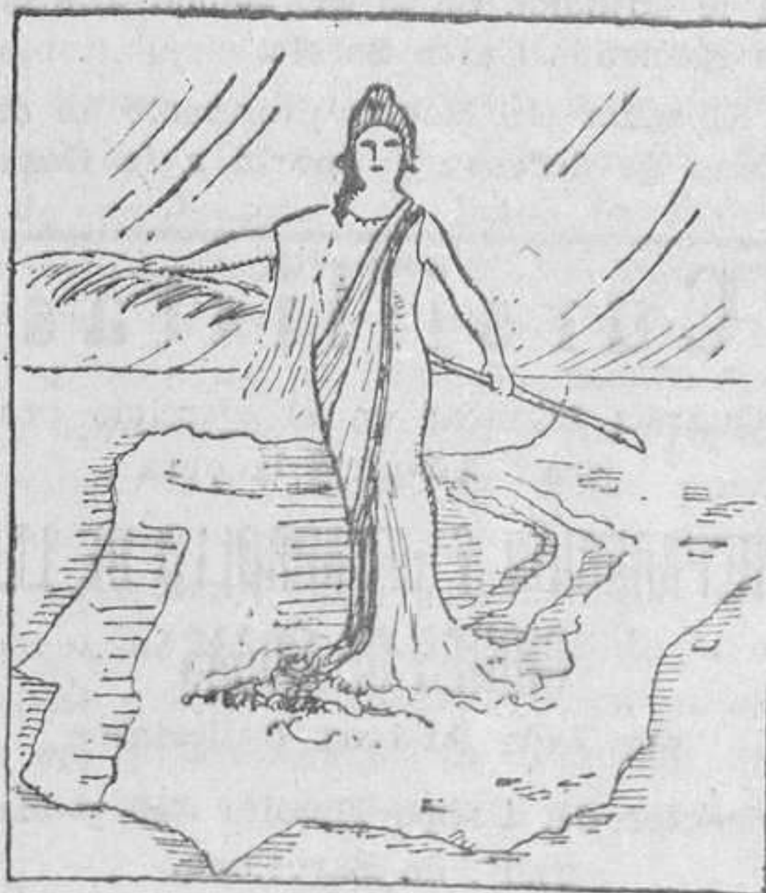
Nueva alegoría de la República, magníficamente impresa en once colores, tamaño 70 X 100. Siete pesetas.

—El Ayuntamiento madrileño nota una disminución en sus ingresos y por ello pedirá una compensación al Estado. Los concejales madrileños que fueron al Congreso municipalista de Londres han visitado Escocia. En las oficinas municipales se implantará la jornada de seis horas. Conforme a lo solicitado va abrirse una nueva puerta en el Retiro que dará acceso a la Avenida de