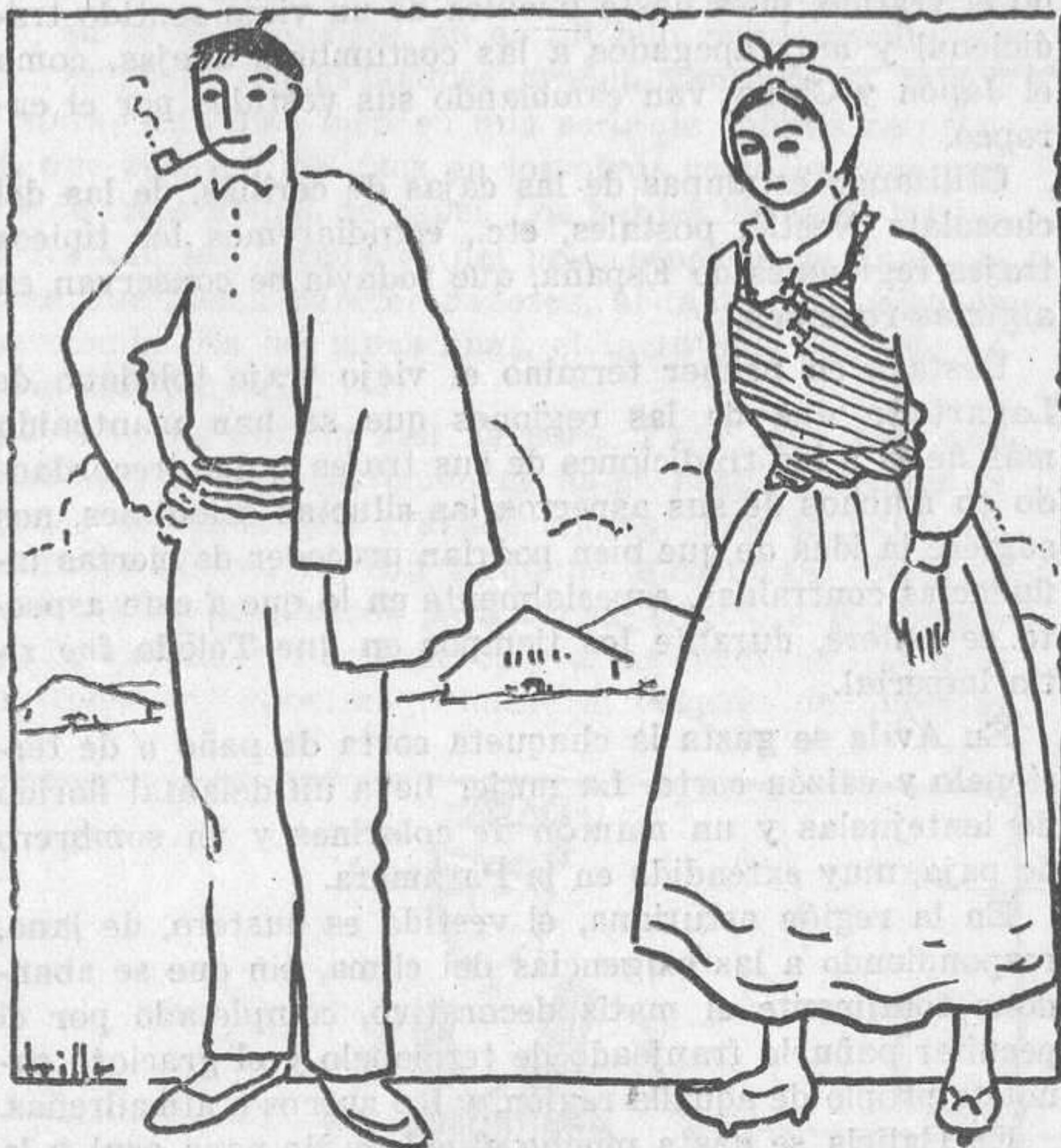
Vestidos regionales: trajes muy usados en la región vasco-navarra

Para el estudio ordenado puede seguirse la marcha cro-