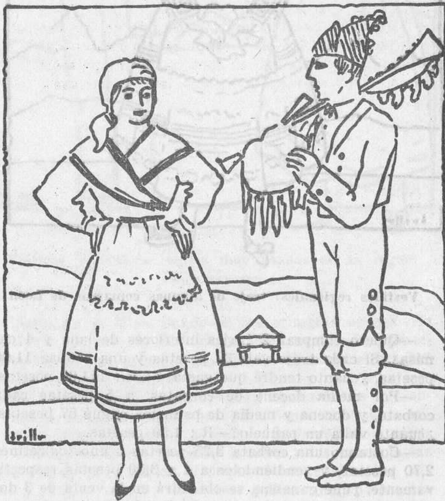
Vestidos regionales: pareja de Galicia o Asturias ataviados a estilo del país

—Compró una camiserita una pieza de tela de 44 metros por 105,60 pesetas. Hizo con ella camisas, entrando en una 2,20 metros. Los gastos de confección ascienden a