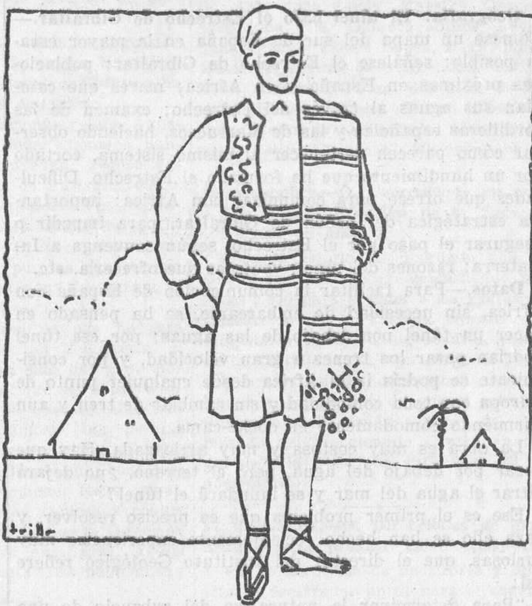
Vestidos regionales: traje típico masculino de la región levantina (Valencia, Alicante, etc.).

Condiciones higiénicas de los vestidos. —Los vestidos de pieles, lana, seda y algodón son malos conductores del calor, por lo que son vestidos de mucho abrigo y convienen en países fríos, húmedos y en invierno. Los