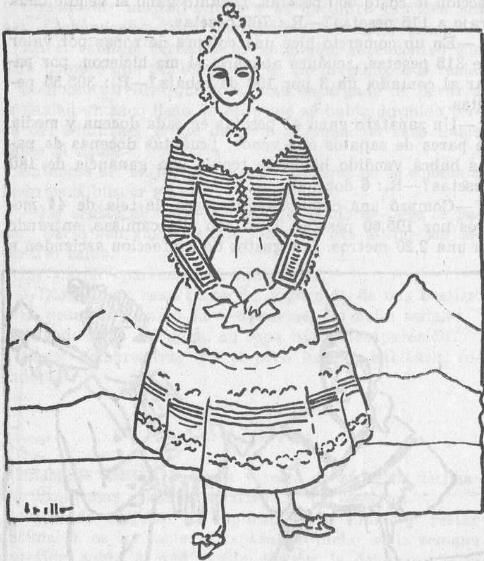
Vestidos regionales: traje de algunas comarcas de León

—¿Cuánto habrá que pagar por 6 pares de calcetines, a 2,75 pesetas el par; 3 cuellos, a 1,25 pesetas uno, y 4 pares de puños, a 1,50 pesetas el par?—R.: 26,25 pesetas.