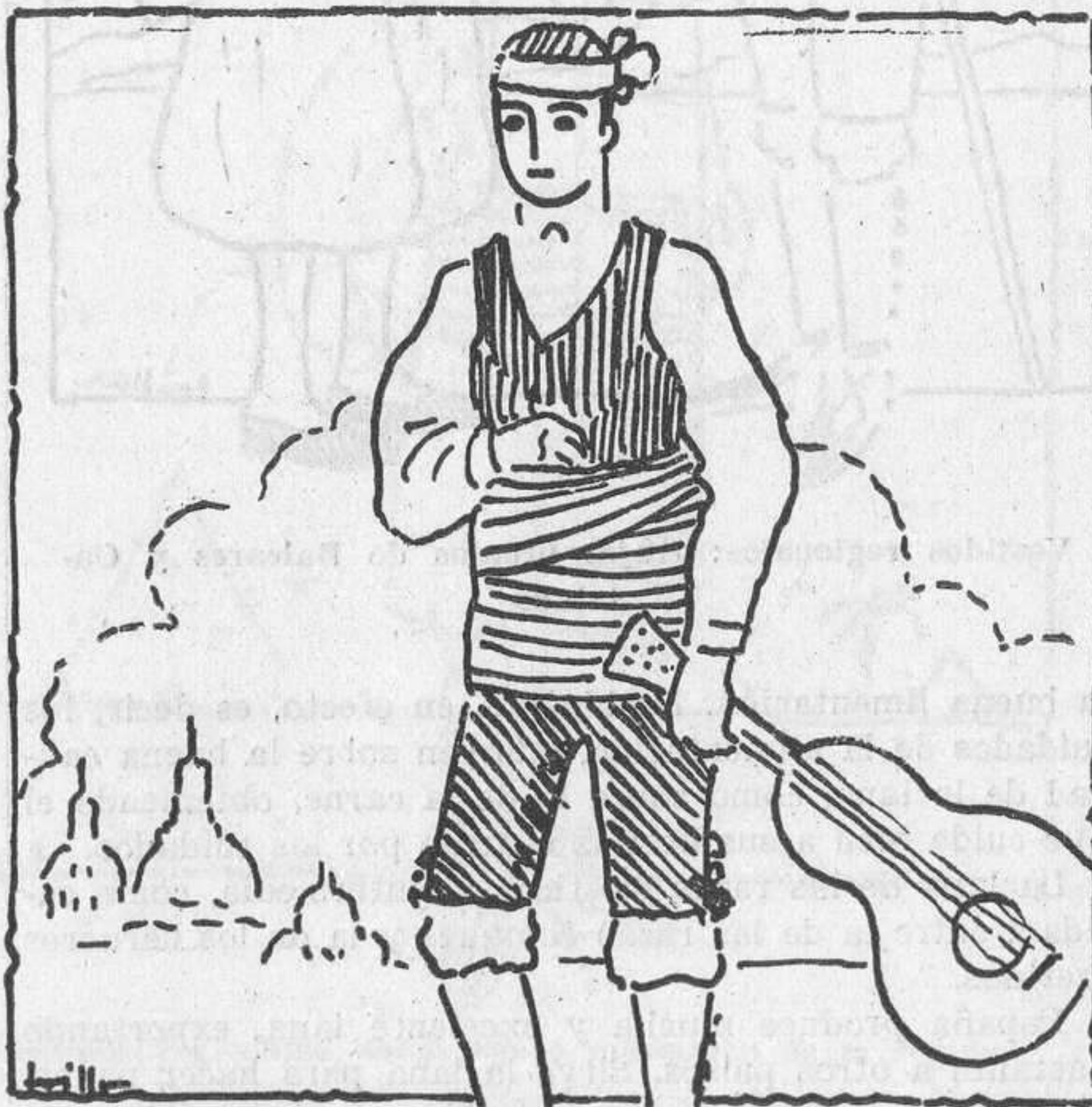
Vestidos regionales: traje propio de la región aragonesa

La lana se obtiene del carnero. Para esto hay que cortarla, y a esta operación se llama esquilar. Antes el esquila se hacía con grandes tijeras; hoy se hace, en casi todas las partes, con máquinas mecánicas, como las que usan los peluqueros para cortar el pelo a las personas. Se esquila a los carneros y a las hembras (las ovejas) todos los años, en primavera, después de haberlos