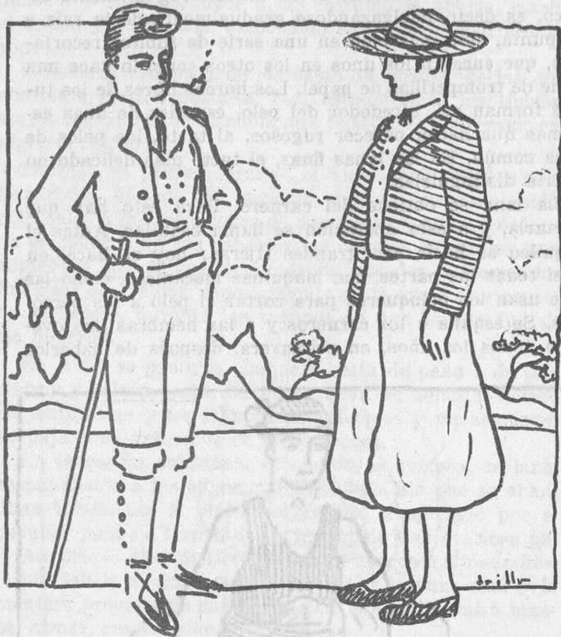
Vestidos regionales: trajes propios de Baleares y Cataluña

A menudo se contentan cruzando los merinos con razas ordinarias, formando así sus descendientes una raza intermedia, o como se dice, una raza mestiza. Algunas veces también hay que guardar las viejas razas de un país, buscando solamente su mejoramiento, por los cuidados y