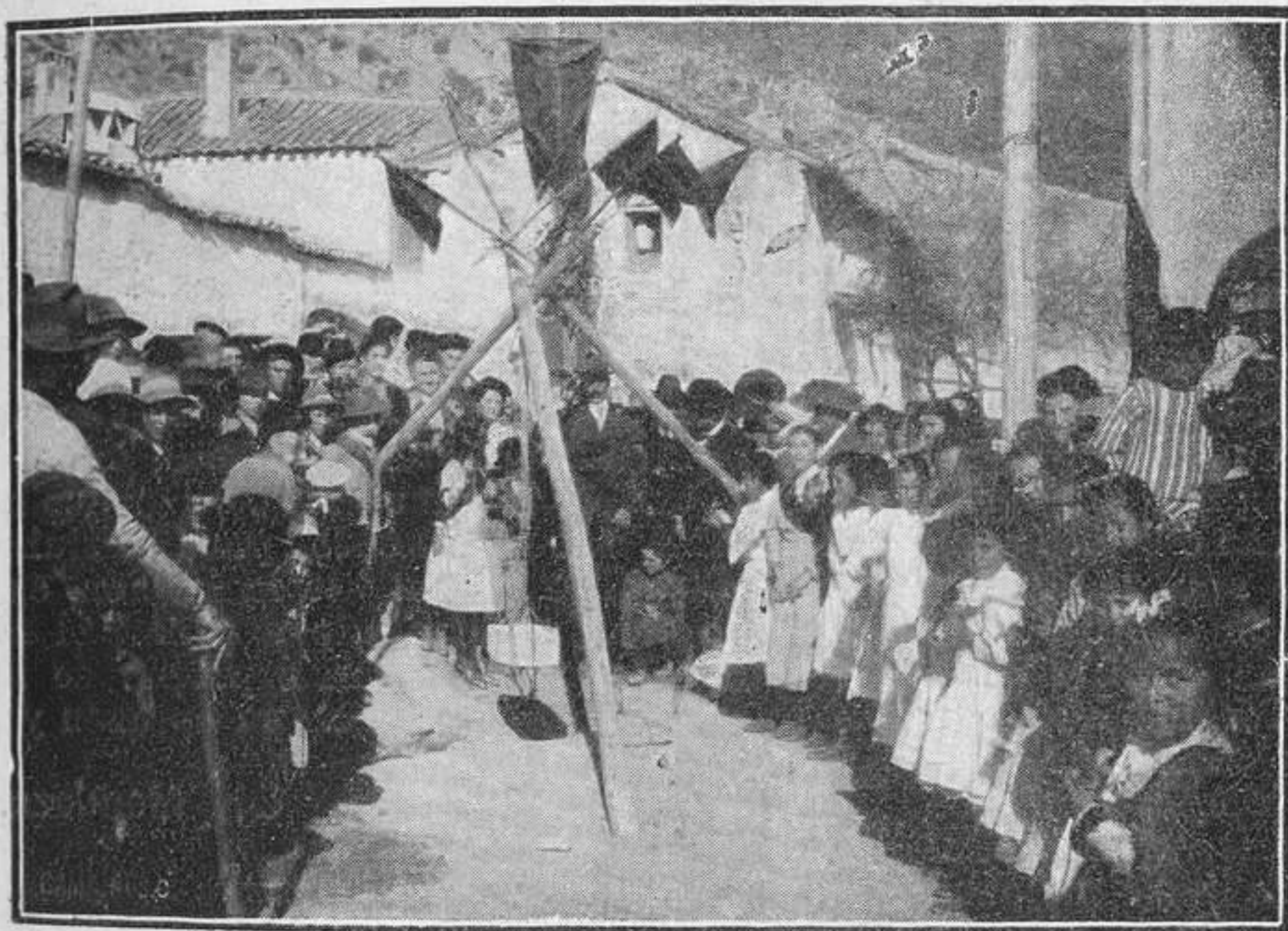
Pinos Genil (Granada.)