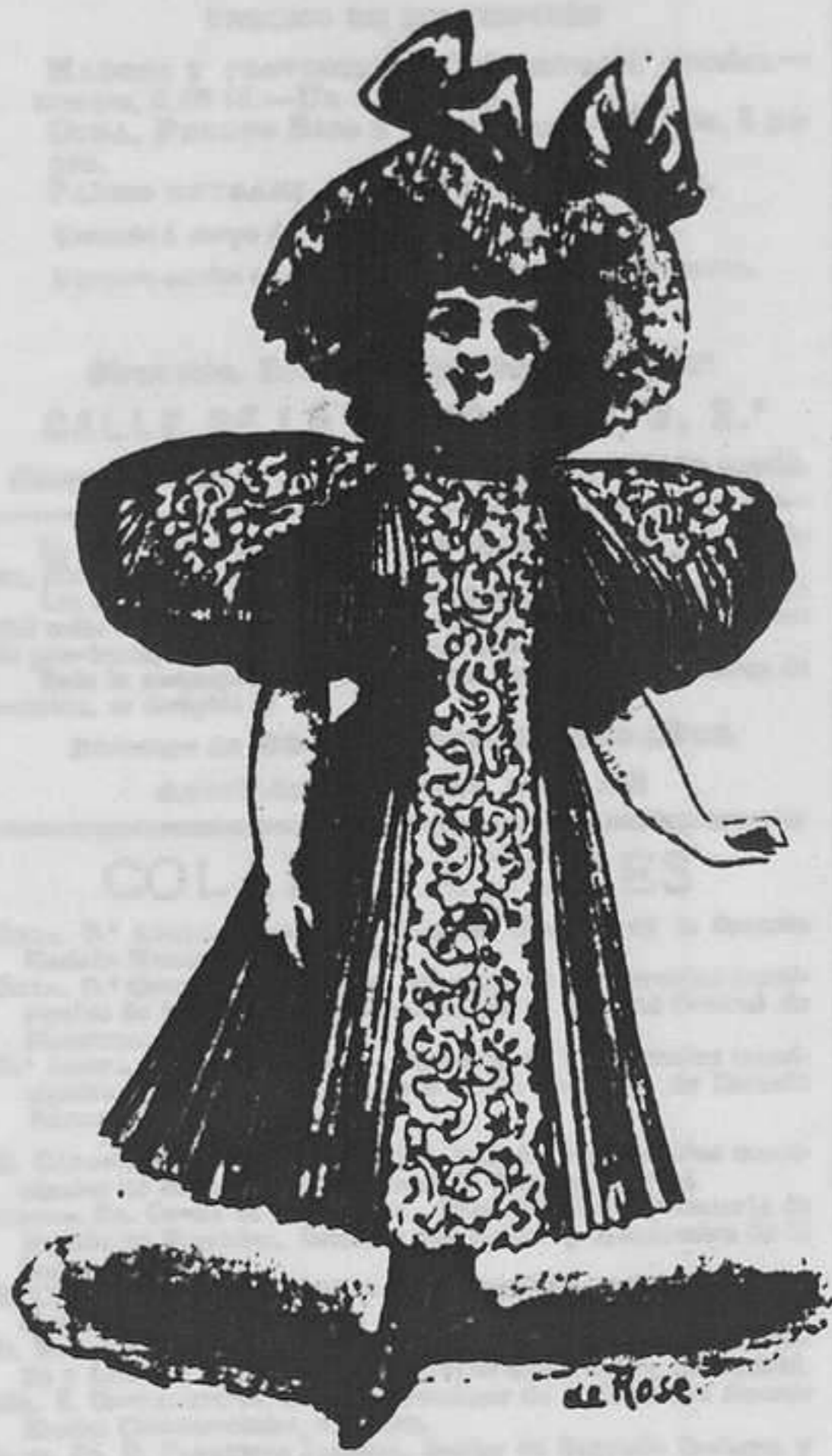
Vestido para niña de 6 á 8 años.

El modelo de vestido que representa el adjunto grabado, es uno de los últimos que da la moda y es también uno de los más elegantes y graciosos.